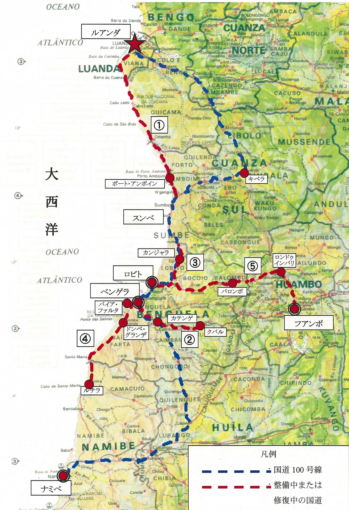
図 2.5 国道 100 号線及び周辺国道