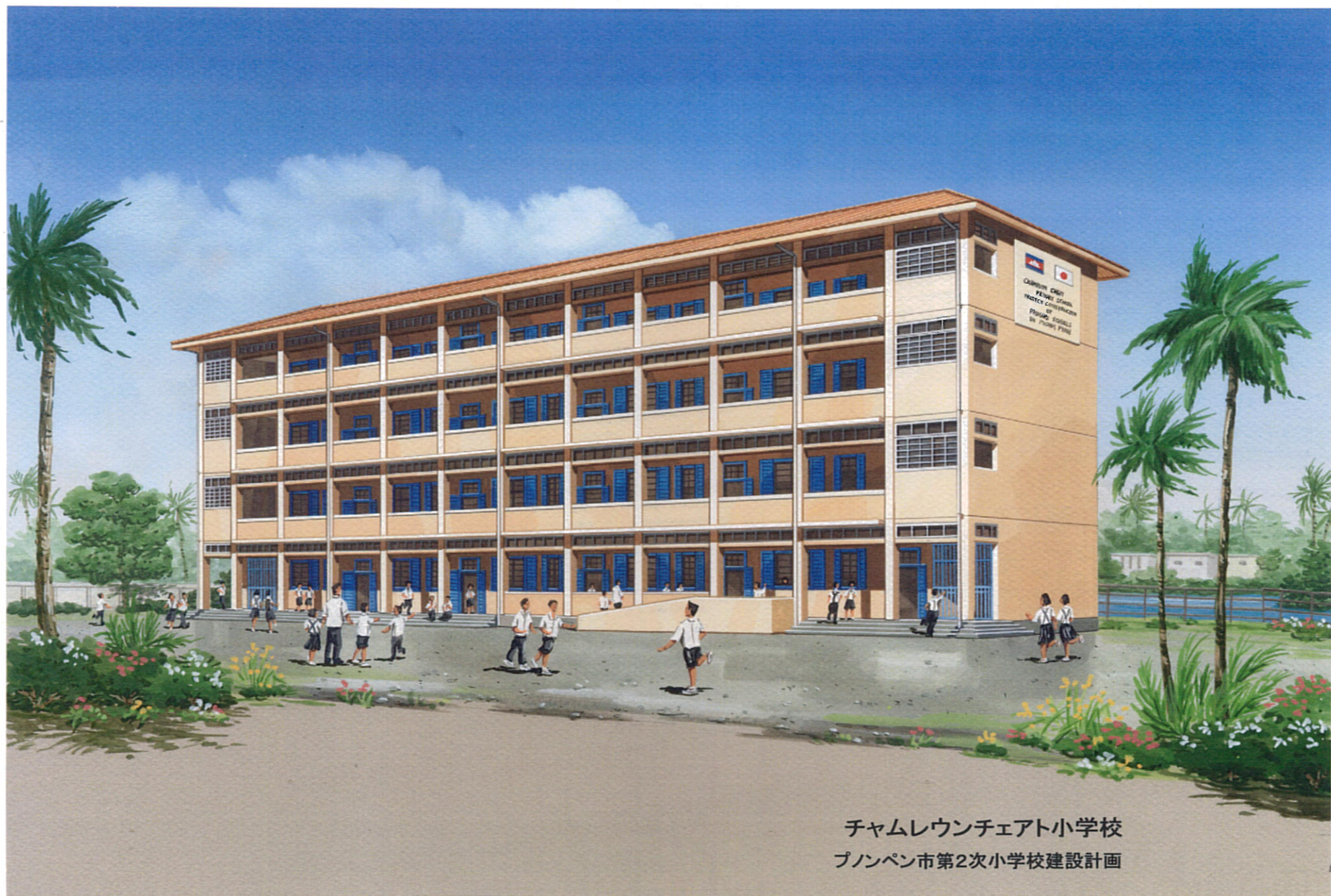
チャムレウンチェアト小学校 プノンペン市第2次小学校建設計画