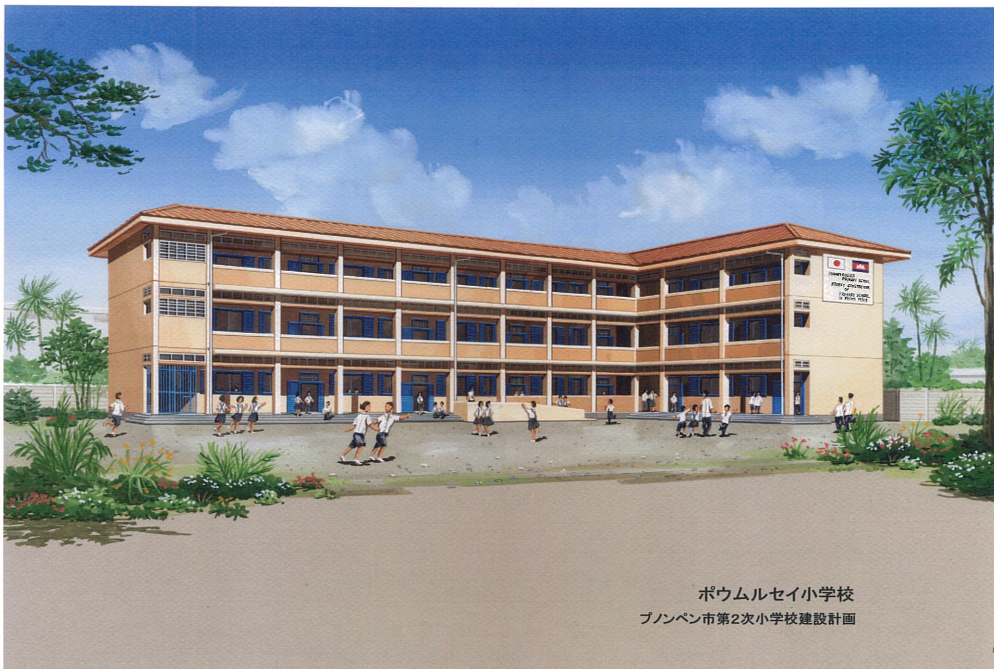
ポウムルセイ小学校 プノンペン市第2次小学校建設計画