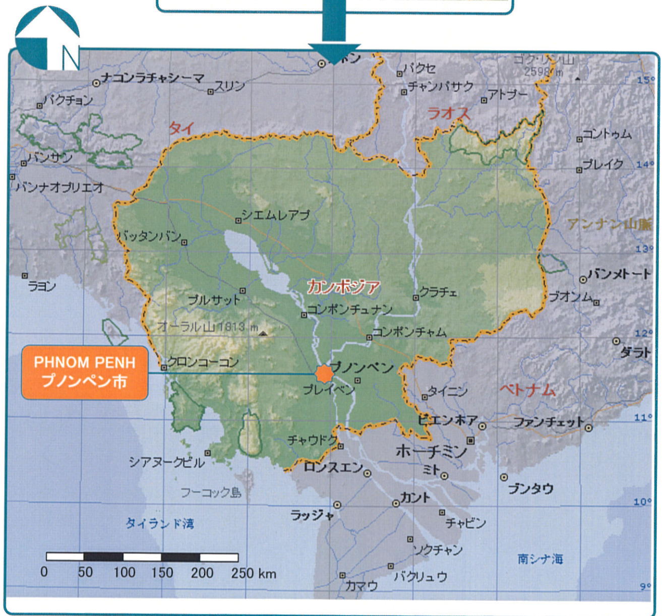
Map of Cambodia カンボジア王国 全図