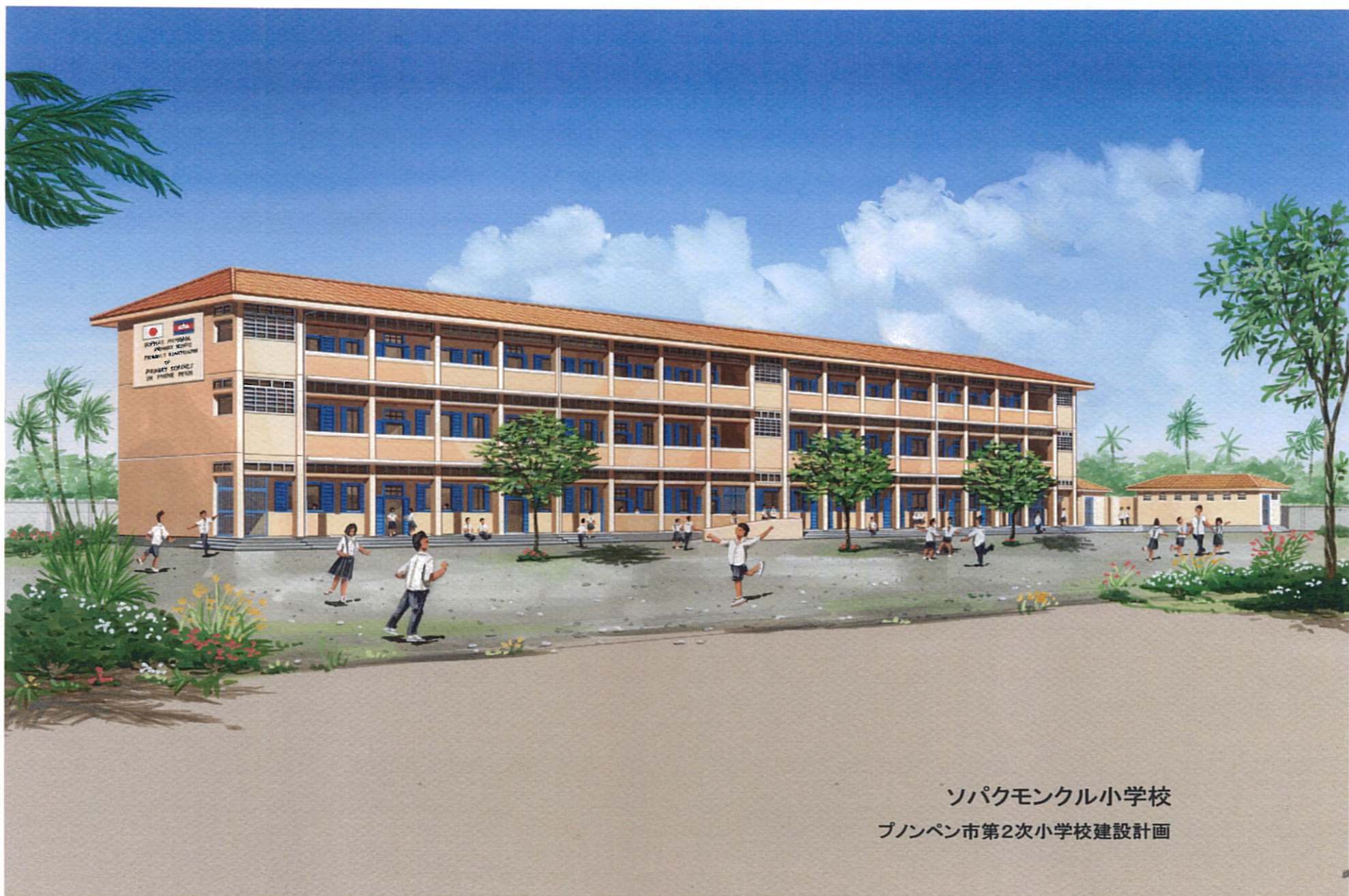
ソパクモンクル小学校 プノンペン市第2次小学校建設計画