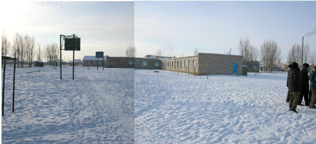
ダルハン第4学校 建設予定地