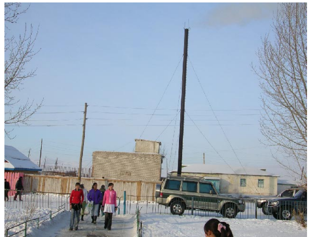
ダルハン第4学校 隣接する地域ボイラー