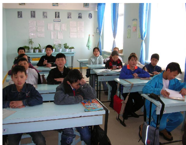
ダルハン第11学校 既存校舎教室