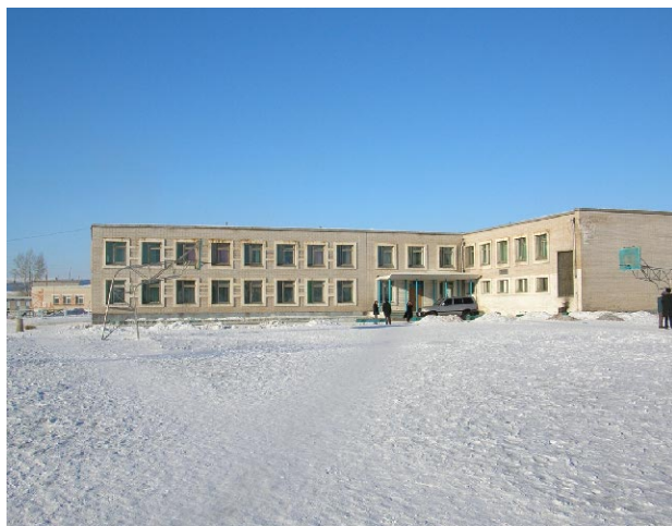
ダルハン第11学校 既存校舎