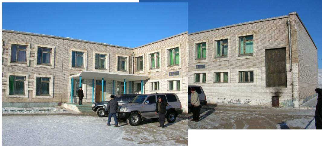
ダルハン第11学校 既存校舎