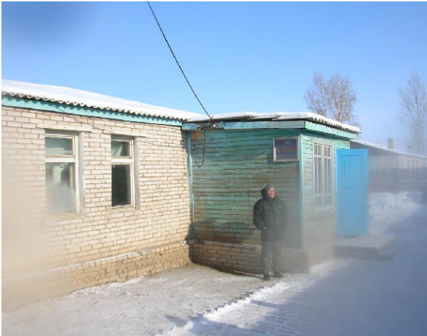
ダルハンod第3学校 既存校舎