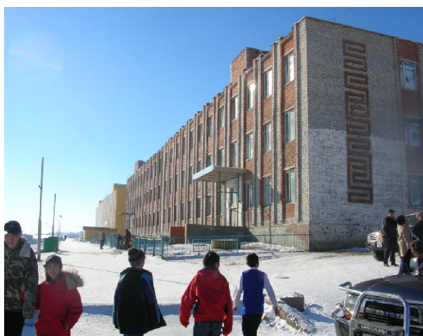
オルホン第7学校 既存校舎