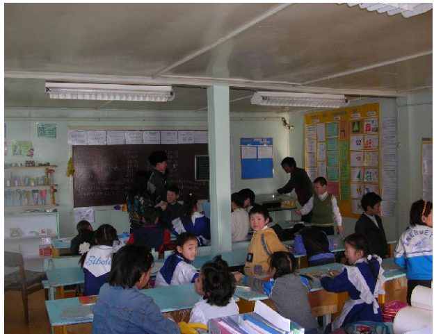
ダルハンod第3学校 既存校舎教室