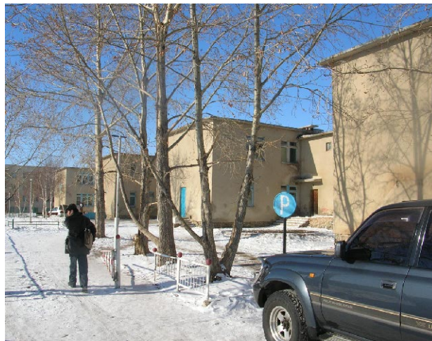
オルホン第6学校 既存校舎