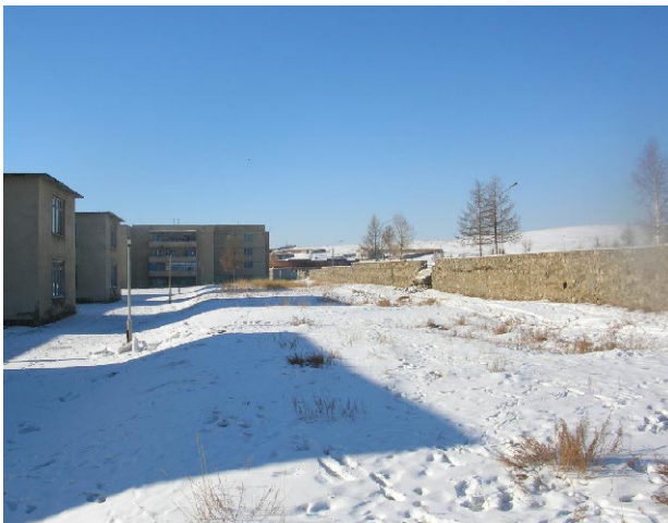
オルホン第6学校 建設予定地