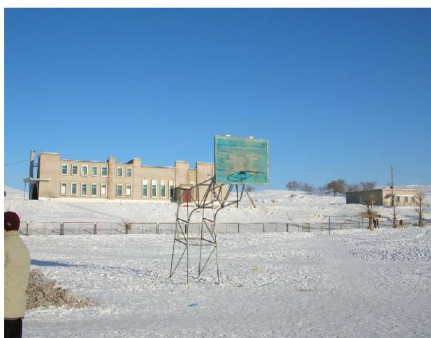
ダルハン第11学校 建設予定地