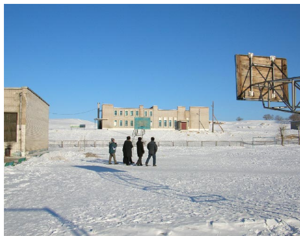
ダルハン第11学校 建設予定地