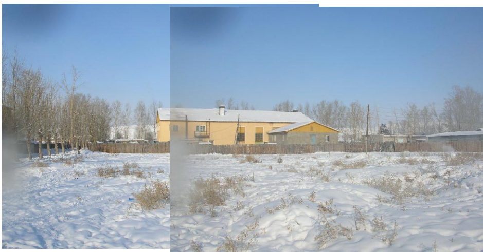
ダルハンod第3学校 建設予定地