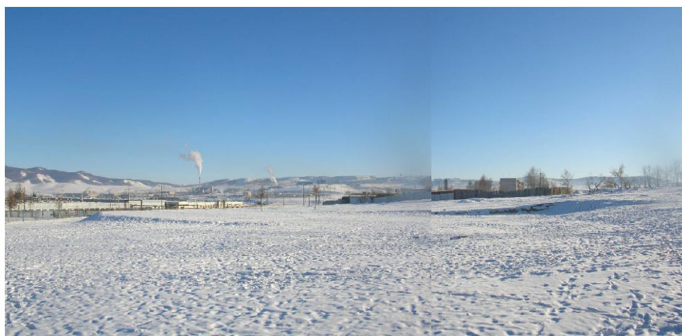
オルホン第2学校 建設予定地