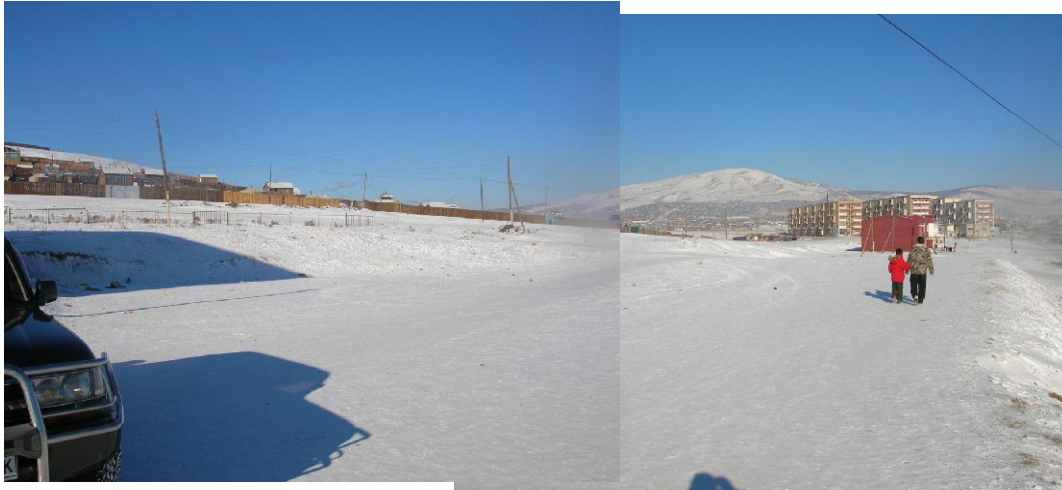
オルホン第7学校 建設予定地