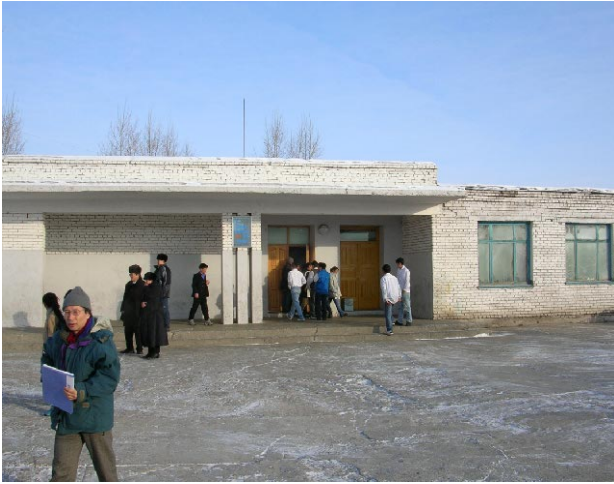
ダルハン第4学校 既存校舎