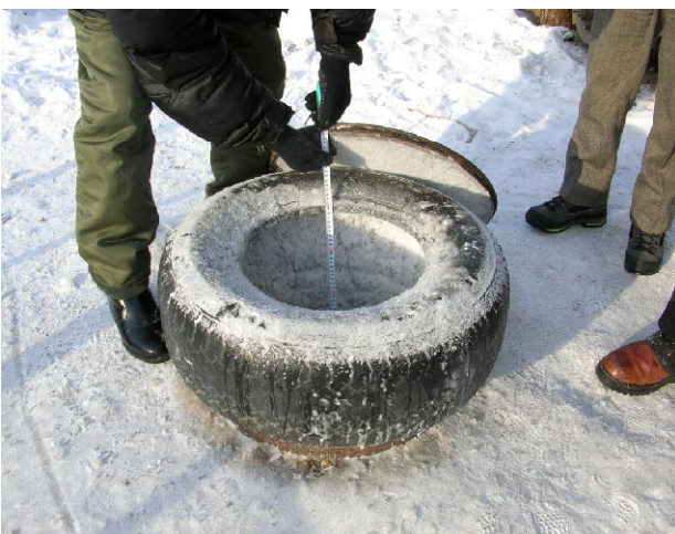
ダルハン第4学校 隣接住宅の井戸にて地下水位を測定