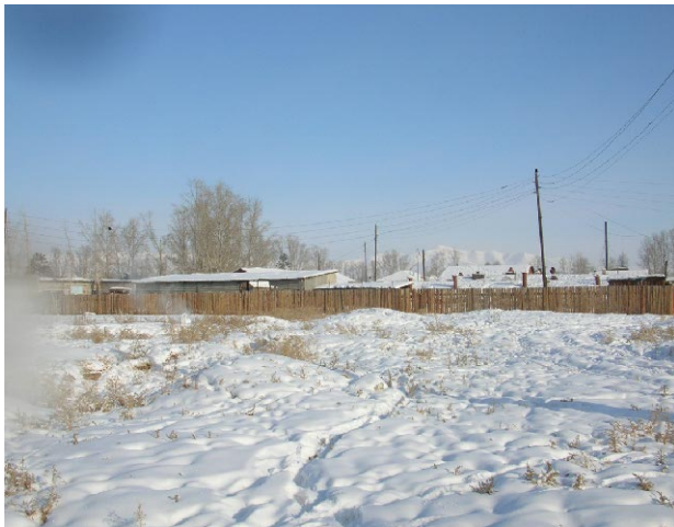
ダルハンod第3学校 建設予定地