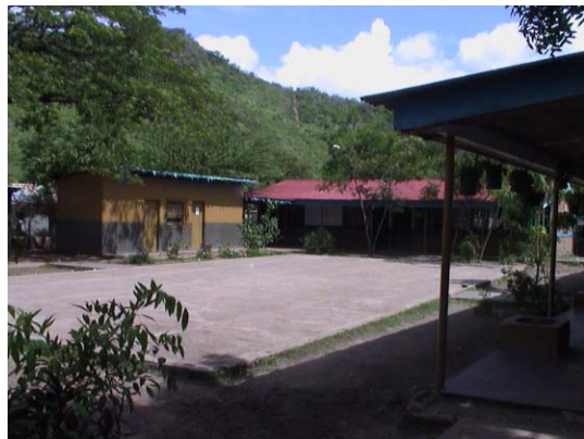
BO-13(B-69) Mixta Tecolostote