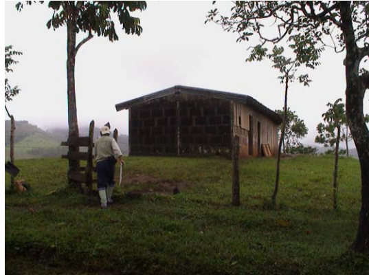
BO-35(B-97) San José de Rio Negro