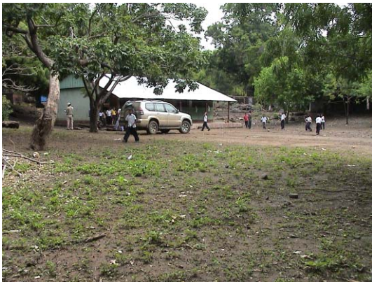
RI-11(R-17) Benjamin Zeledón