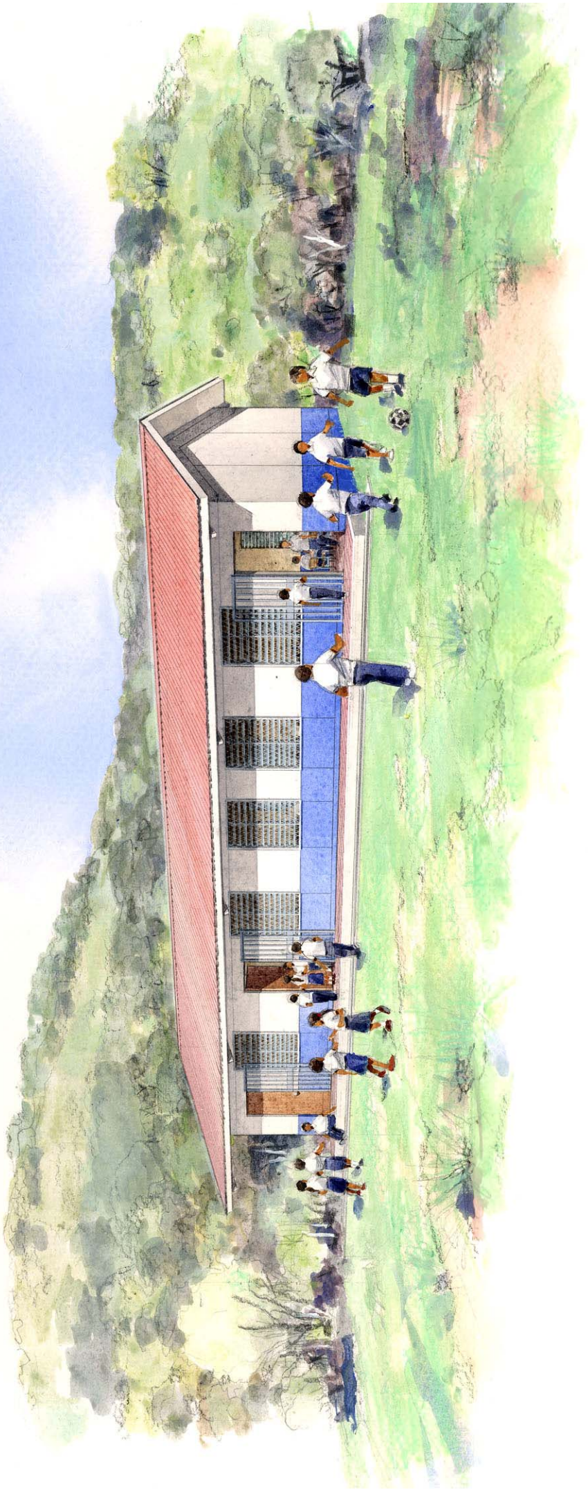
PERSPECTIVA DE EXTERIOR (1)