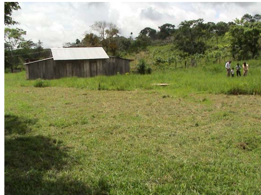
CH-50(C-34) Miguel Obando y Bravo