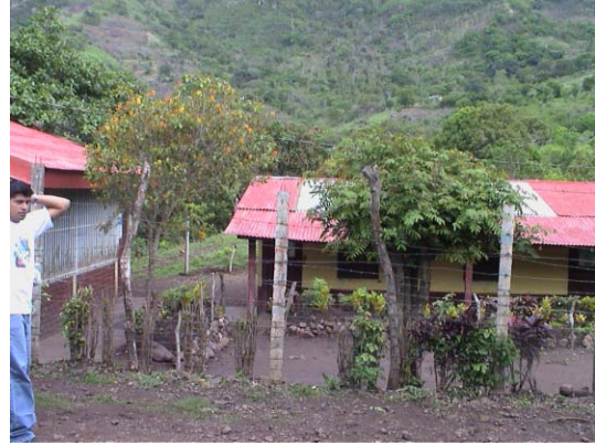
BO-25(B-86) Rubén Darío