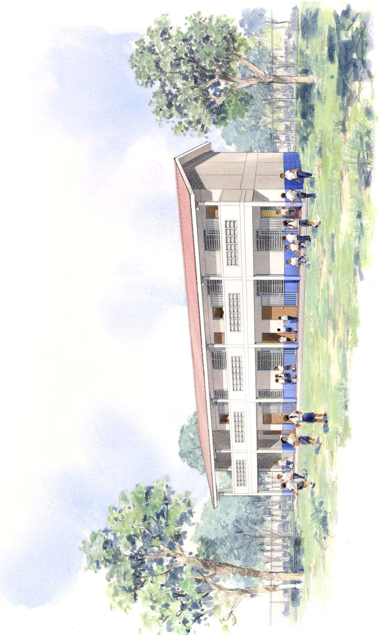
PERSPECTIVA DE EXTERIOR (2)