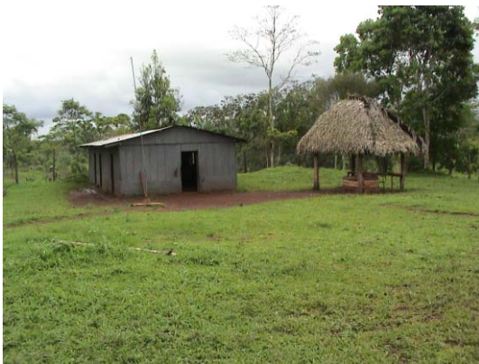
CH-45(C-29) San Francisco Xavier