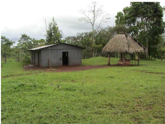
CH-45(C-29) San Francisco Xavier