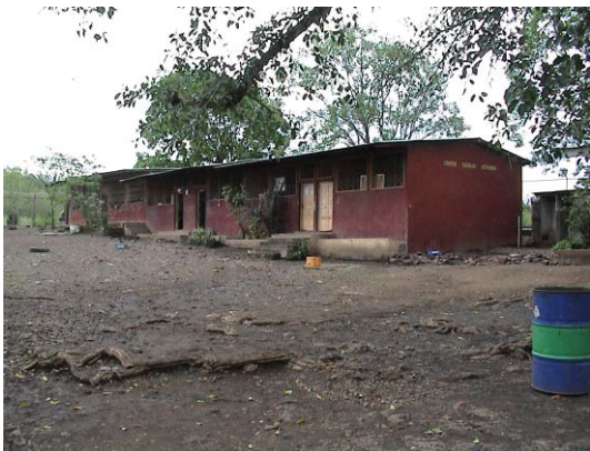
CH-51(C-37) Flor Esmilda Diaz