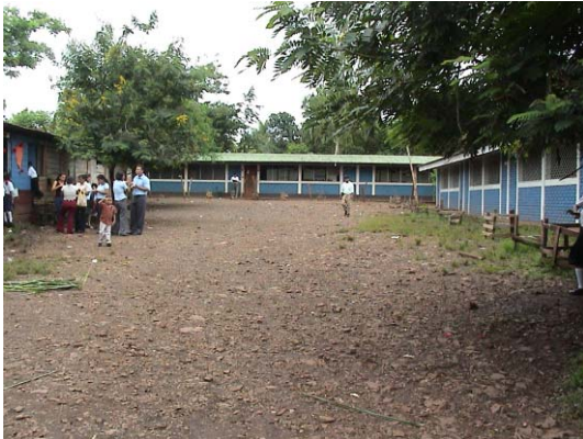
CH-39(C-22) Enmanuel Mongalo y Rubio