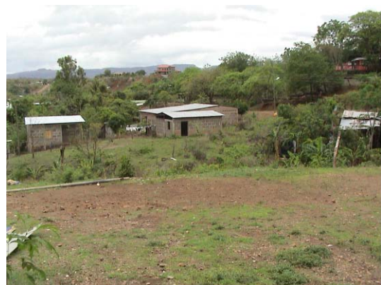
CH-54(C-40) Leopoldina Castrillo