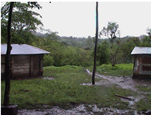
BO-28(B-89) Virgen de Guadalupe