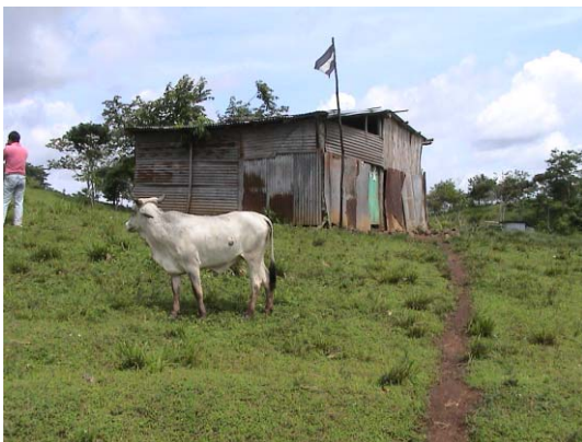
BO-20(B-79) Inés de Mondragón