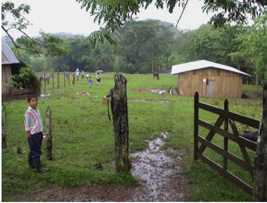
BO-32(B-94) Santa Rita Los Planes