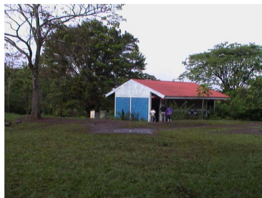
BO-21(B-80) Nuestra Señora de Guadalupe