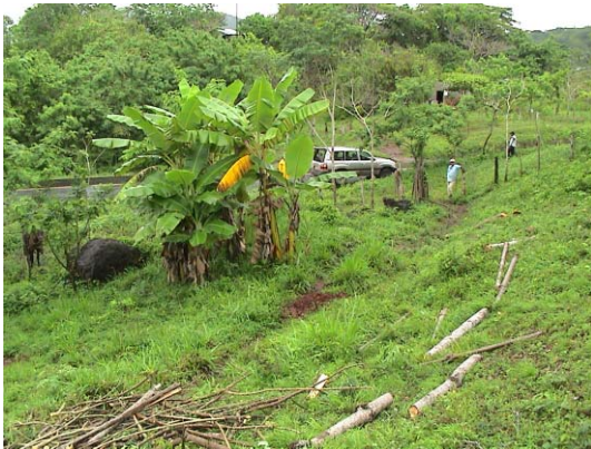
CH-49(C-33) El Socorro