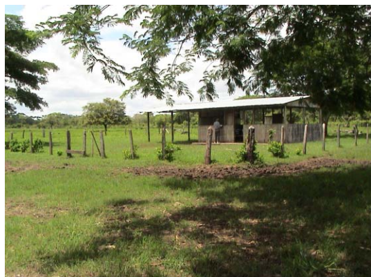
CH-62(C-49) San Isidro