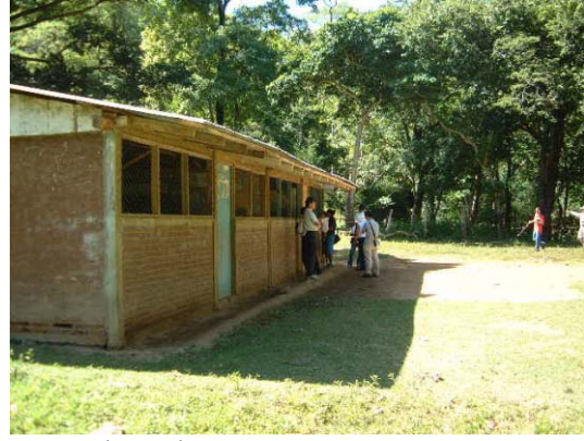
RI-10(R-16) Rubén Darío