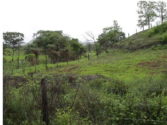
CH-66(C-56) San Esteban