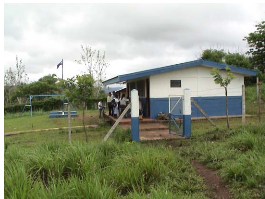
CH-74(C-64) Concepción de María