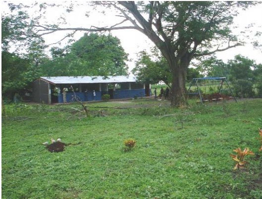
RI-1(R-1) San Ramón