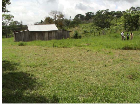
CH-50(C-34) Miguel Obando y Bravo