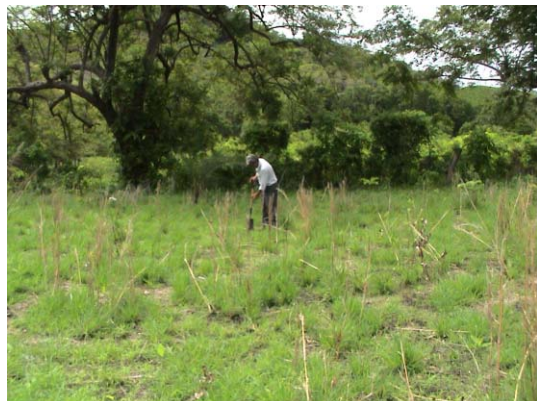
CH-70(C-60) Divino Maestro