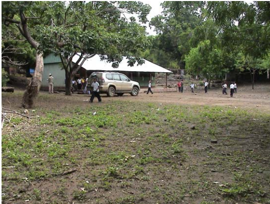
RI-11(R-17) Benjamin Zeledón