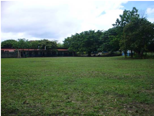
RI-3(R-3) Los Angeles-Esquipulas