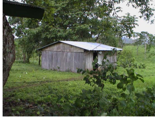
BO-17(B-76) La Unión del Pedermal