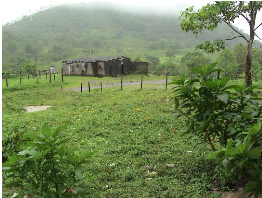
CH-41(C-25) La Unidad