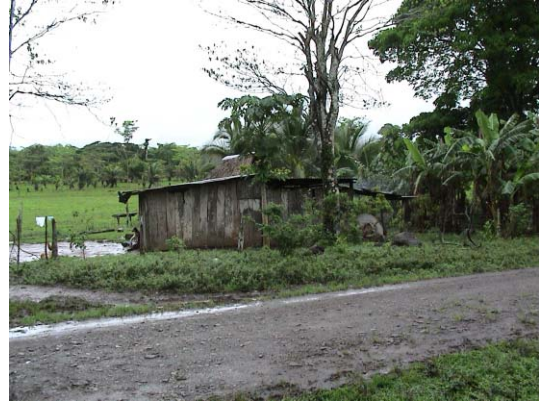
CH-48(C-32) Fuente de Saber