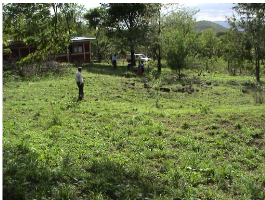
CH-59(C-46) El Rayo