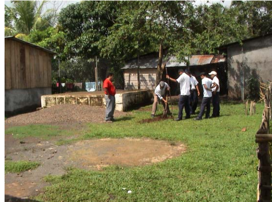
CH-40(C-23) Los Chinamos