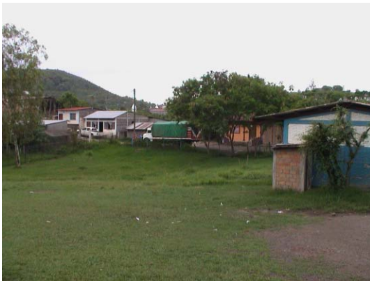
BO-36(B-98) Angelita Robleto