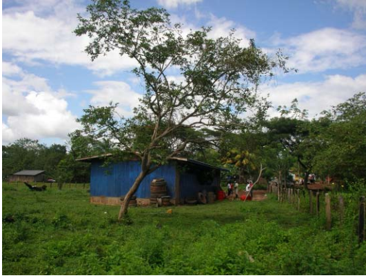
CH-47(C-31) Chontal(El Conejo)