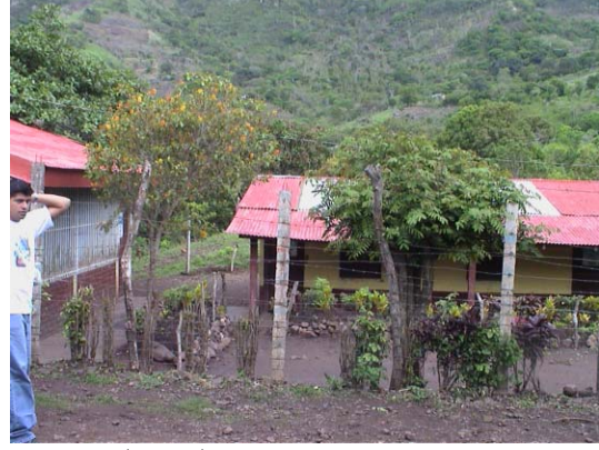
BO-25(B-86) Rubén Darío