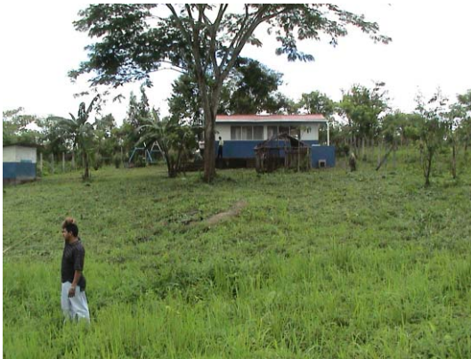
CH-73(C-63) El Silencio