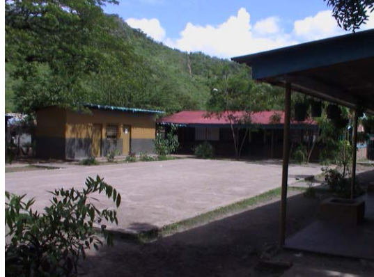
BO-13(B-69) Mixta Tecolostote