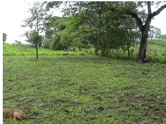
CH-60(C-47) Puertas Rojas