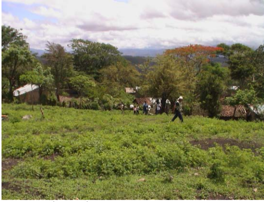
BO-24(B-85) Dolores Alemán