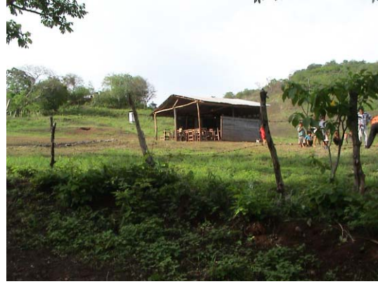
CH-56(C-42) Octavo Gallardo