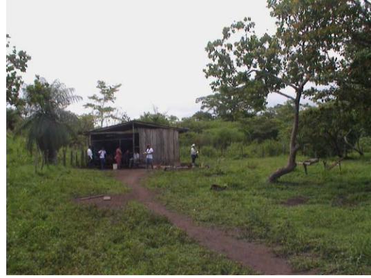
CH-64(C-53) El Chinal