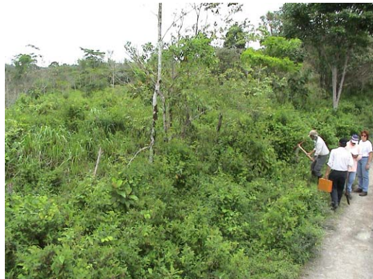
CH-68(C-58) Puerta de María