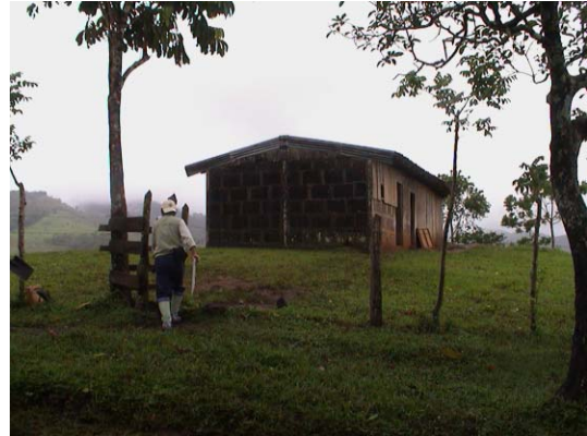
BO-35(B-97) San José de Rio Negro