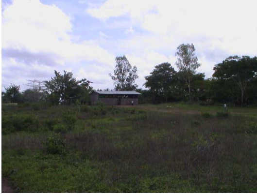
CH-63(C-51) Monte Alto