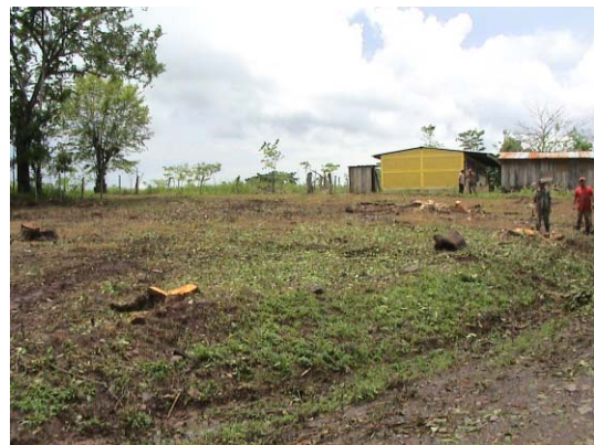
CH-44(C-28) María Auxiliadora