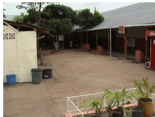
CH-52(C-38) Nuestra Señora de Asunción