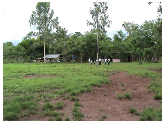
CH-46(C-30) Corazón de María