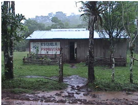
BO-18(B-77) La Primavera