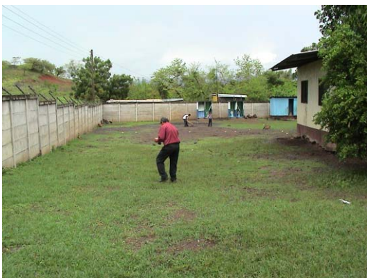
CH-53(C-39) La Haya