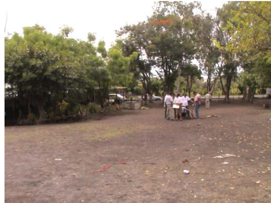
RI-2(R-2) Koos Koster