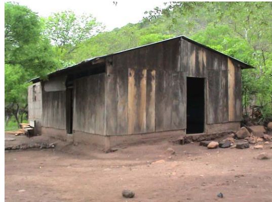
CH-58(C-45) Piedras Grandes 2