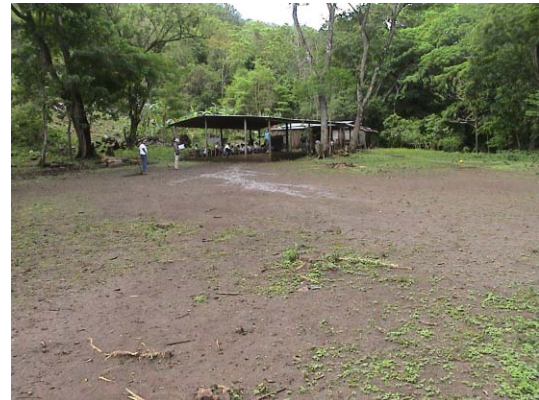
RI-6(R-11) El Carmen