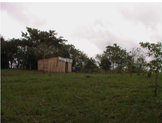
BO-14(B-72) Pablo Antonio Cuadra