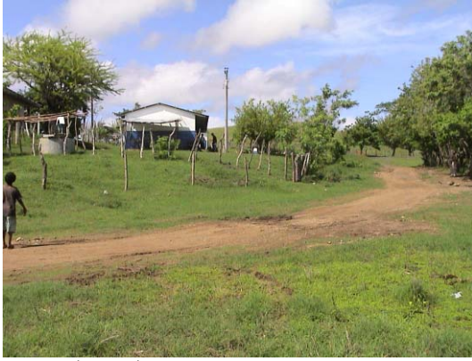
RI-9(R-15) Las Banderas