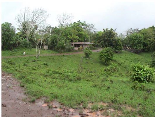
CH-43(C-27) Estrella de Belén