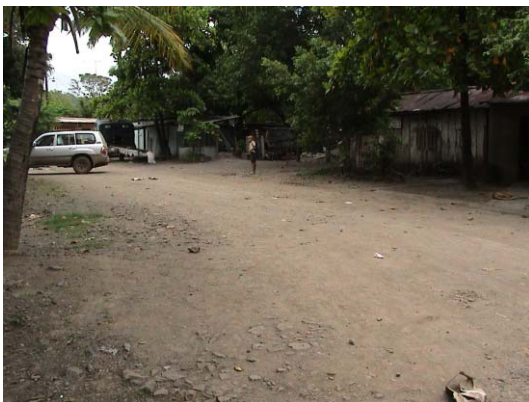
CH-67(C-57) San Pedro