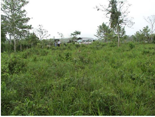
CH-71(C-61) Padre Carios