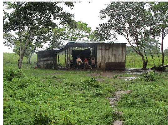
CH-42(C-26) Miguel de Cervantes