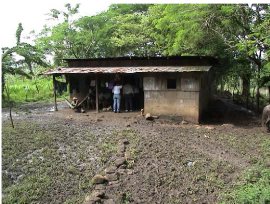
CH-69(C-59) Inmaculada Concepción