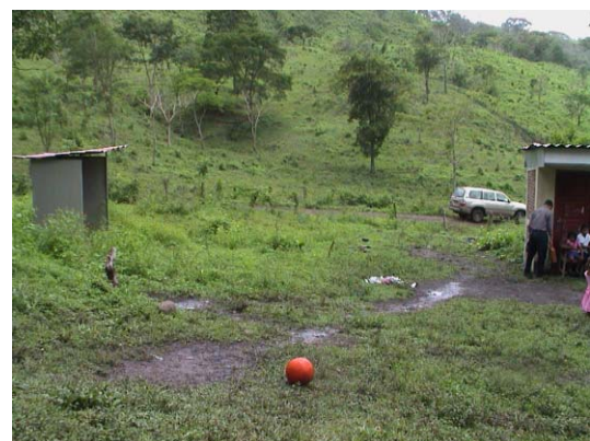
BO-31(B-93) 14 de Septiembre