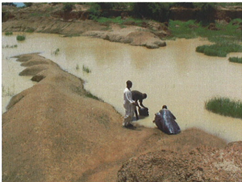
ため池で水汲みをする人々 生活用水としてだけでなく、飲料水として も直接飲んでいる住民も少なくない