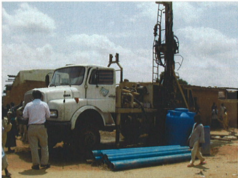
RUWASA保有リグ③ RUWASA設立時UNDPが調達