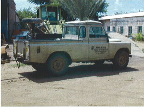
RUWASA保有の小型トラック①