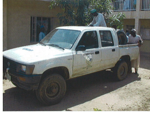
RUWASA保有の小型トラック②