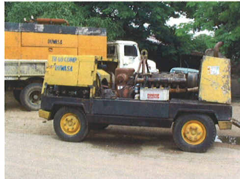
RUWASA保有コンプレッサー①②