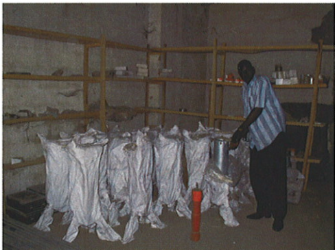
RUWASAの倉庫に保管されている ハンドポンプ