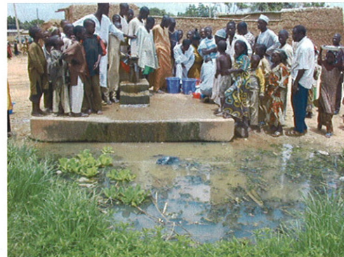
既存のハンドポンプ付井戸の状況② 周辺はこぼれ水で汚染されている