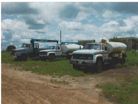
過去の日本の無償資金協力で供与され た掘削支援車輛(ナイジャ州)