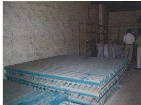
RUWASAの倉庫に保管されている ケーシングパイプ