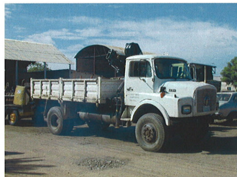
RUWASA保有のクレーン付トラック: クレーンの部分が故障している