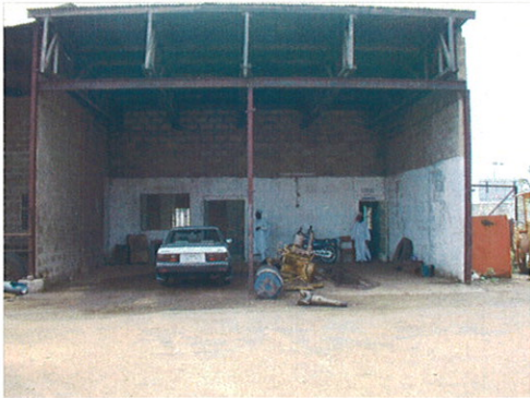
RUWASAのワークショップ