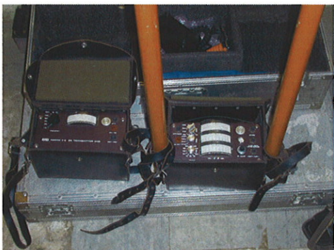
RUWASA保有の電気探査機