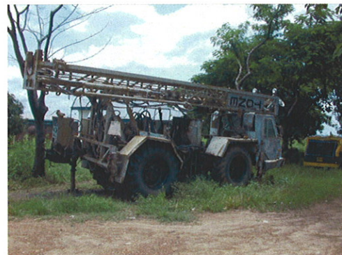
過去の日本の無償資金協力で供与され た掘削リグ(ナイジャ州)