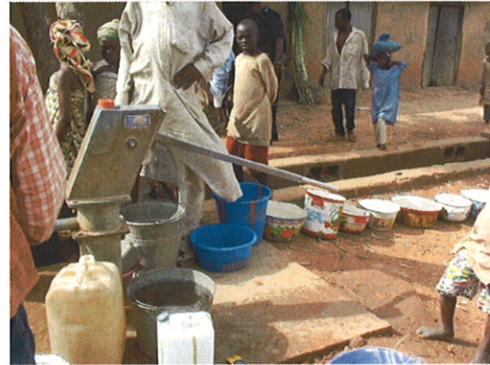
既存のハンドポンプ付井戸の状況① 多くの住民が水汲みの順番を待っている