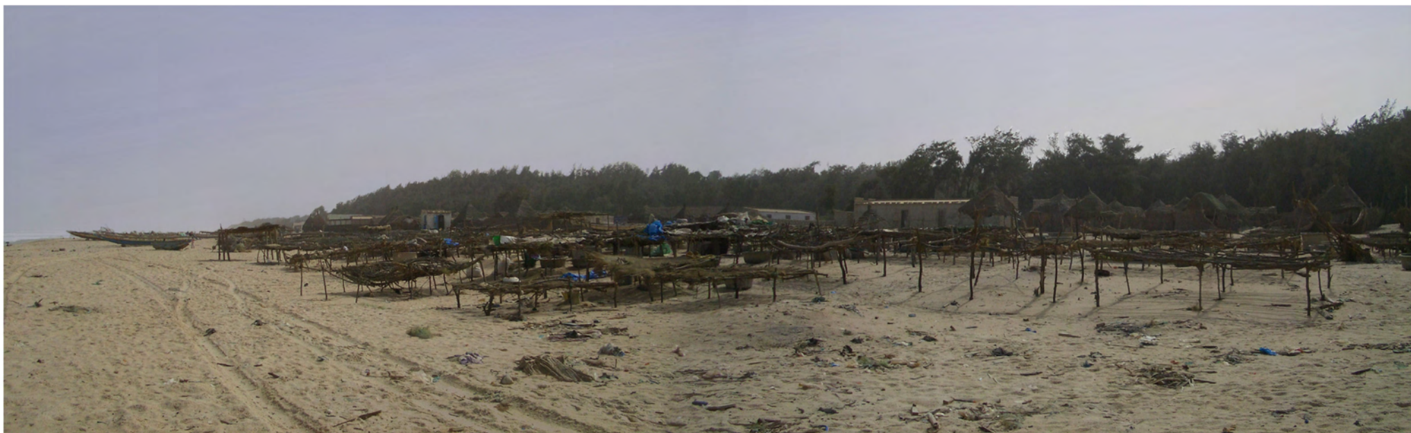
写真-3 南側加工場の状況