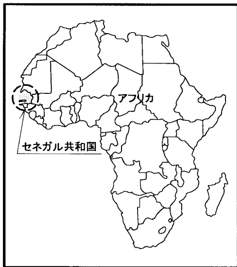
セネガル国 ロンプル水産センター建設計画 サイト位置図