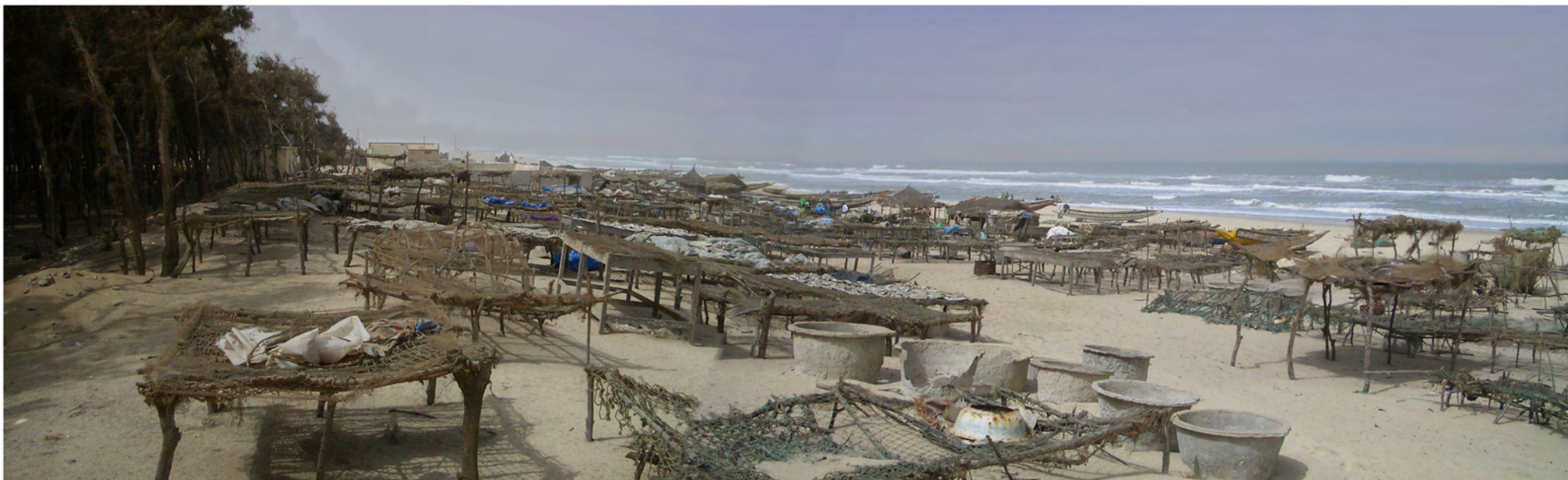
写真-2 北側加工場の状況