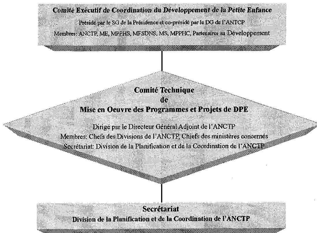
Figure 4.4 Organigramme proposé pour le Comité Exécutif du DPE

La structure proposée pour l'organisation de la mise en oeuvre est présentée dans la figure ci-dessous.