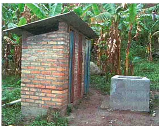
トイレと給水施設