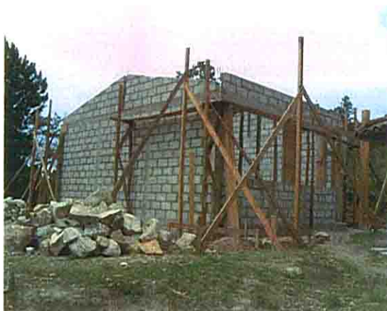
建設中の校舎外観