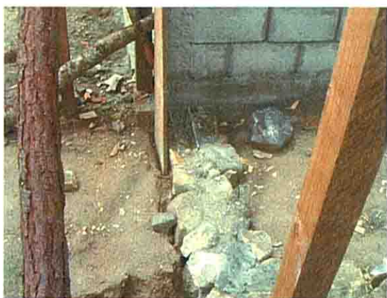
建設中の校舎基礎まわり