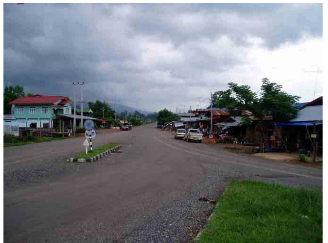
ビエンカム(Viengkham)村から ベトナム側に伸びる道路