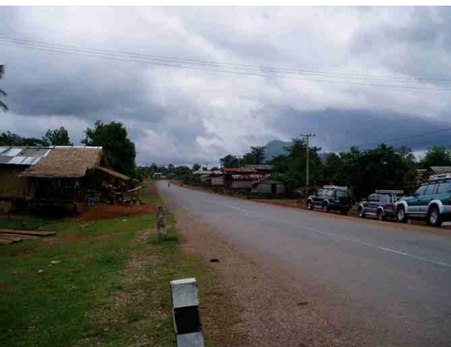
ナインノック(Na Innok)村 (奥にファーソム山が見える)