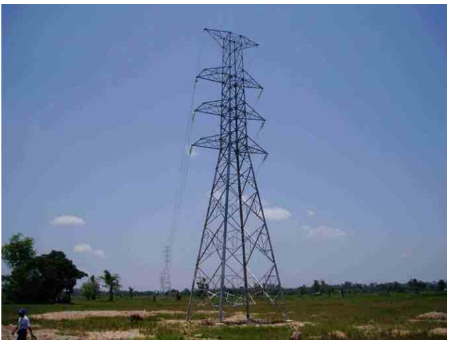
タイとの国境～タケック変電所間 115kV送電線