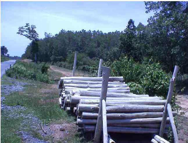
材木の積み出し状況、違法伐採が多いとのこと 送電線建設管理上の問題になりうる