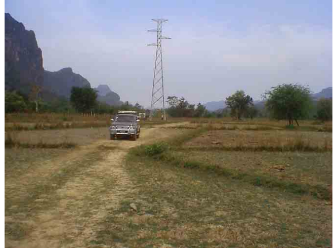
水田での鉄塔建設 水田の中にアクセス道路を作る問題が生ずる