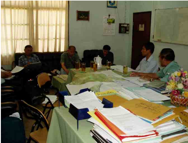
EDLサバナケット支所との打合せ