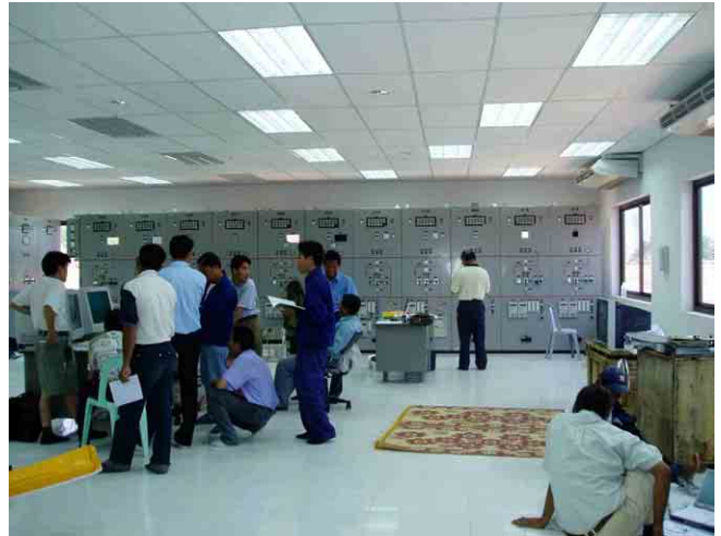
タケック変電所の制御室内 (運転指導中)