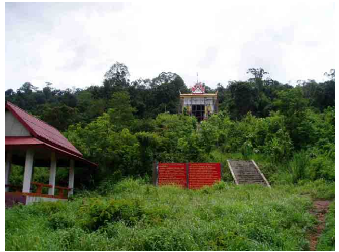
カディン(Kading)川の北側の山裾にある寺院