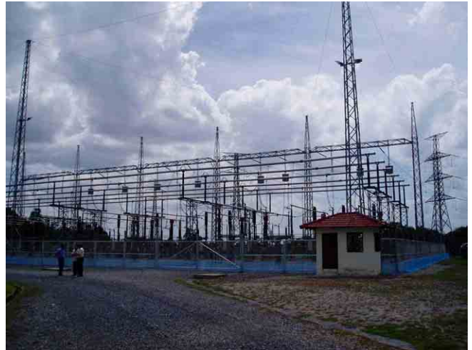
バンブン(Ban Veun)開閉所 (将来は変電所)