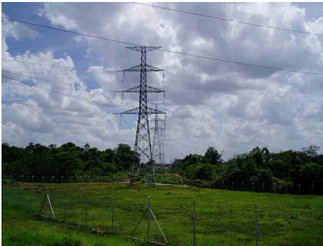
バンブン変電所からメコン河に伸びる送電線