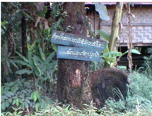
村民への環境敬愛活動の標語 ”自然を愛するなら木を植えよう”