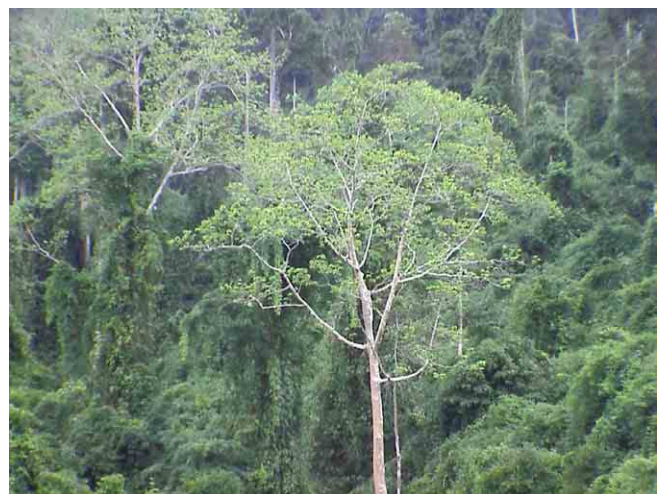
フタバガキ科の大木 ポリカムサイ県立保護林にて