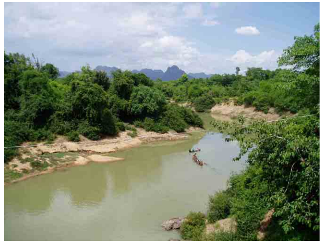
ナムドン(Nam Don)川横断箇所