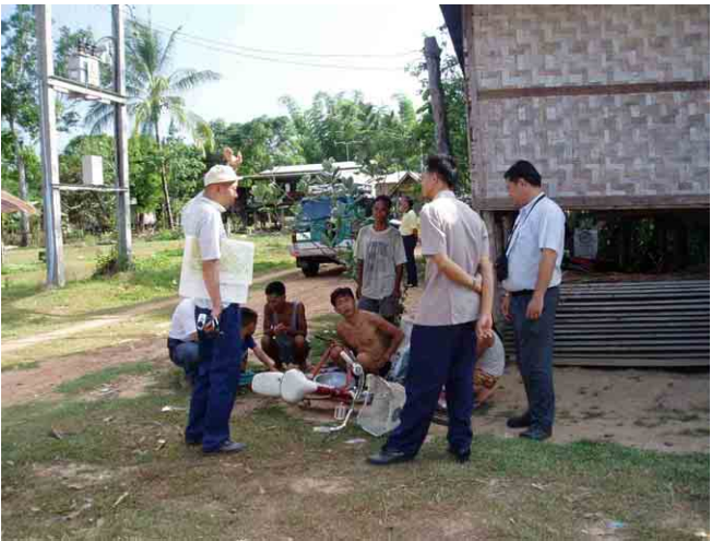
マイフォシ(Mai Phosi)村での村民インタビュー