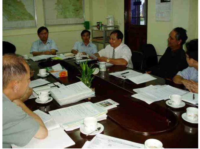
ビエンチャンでのEDL-MIHとの打合せ