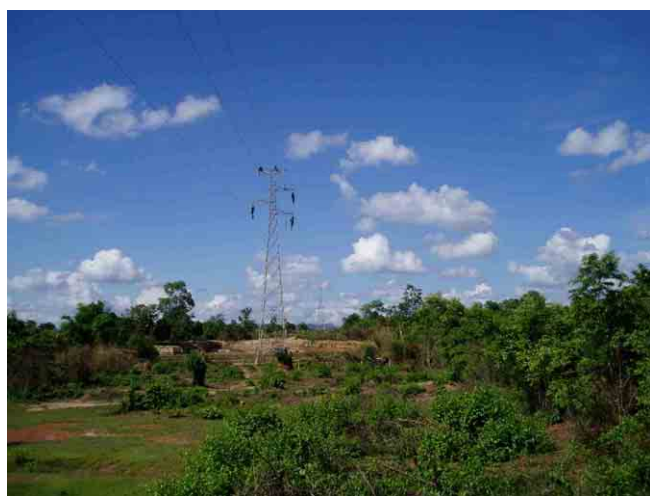
タケック～マハサイ～セボン鉱山線 (架線工事を実施中)