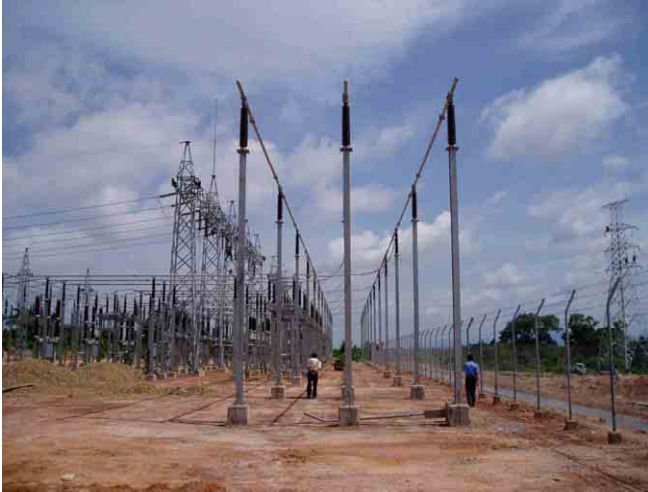
タケック変電所 (竣工間近)