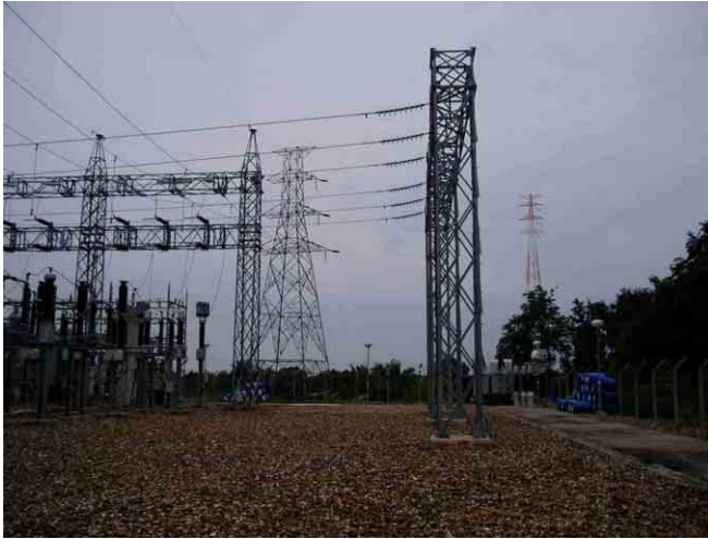
パクサン変電所、右奥はメコン河横断鉄塔