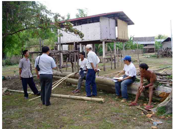
ムアンバ(Muangba)村での村民インタビュー