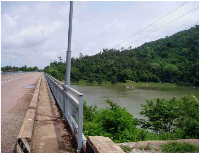
カディン川横断箇所