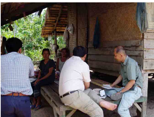
ドンマンゲオ(Dongmakngeo)村での村民インタビュー