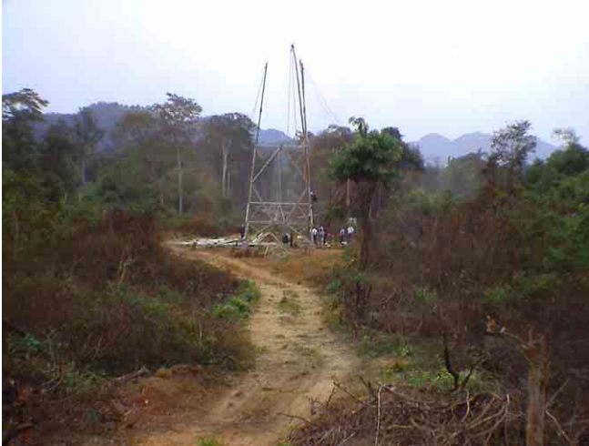
鉄塔建設状況、25 m幅で森林を伐採する