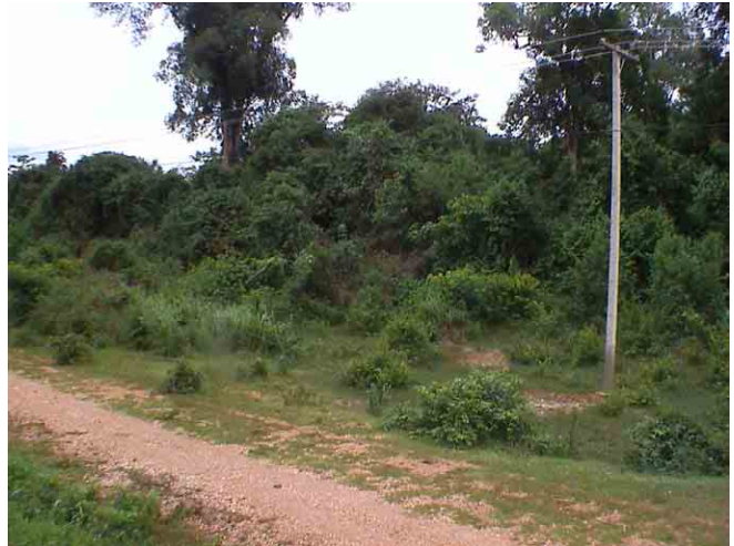
国道13号線脇の植生 基本的には”藪”である