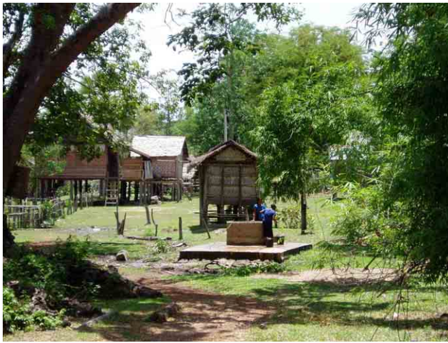
ダンケセン (Dangkasen) 村