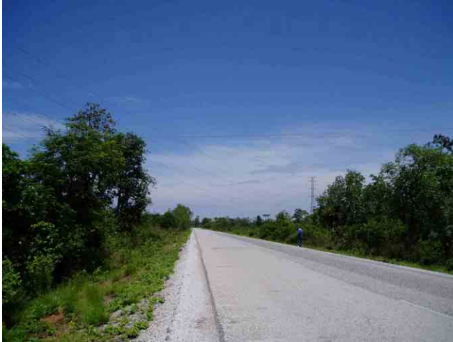
230kVテンビンブン～タケック線横断箇所