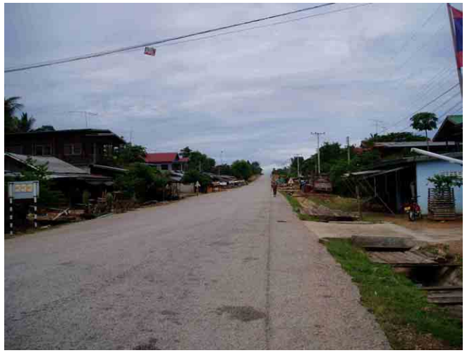
ナダン (Nadeng) 村