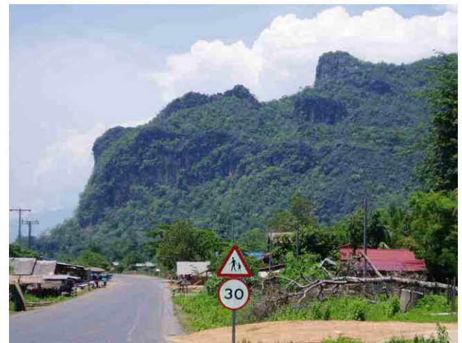
ファーソム(Pha Som)山 (ボリカムサイ県とカムアン県の県境付近)