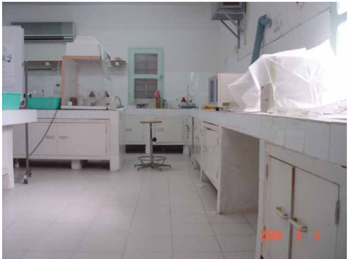
IMROP ヌアディブ検査所：理化学検査部門の検査室の内部の様子。