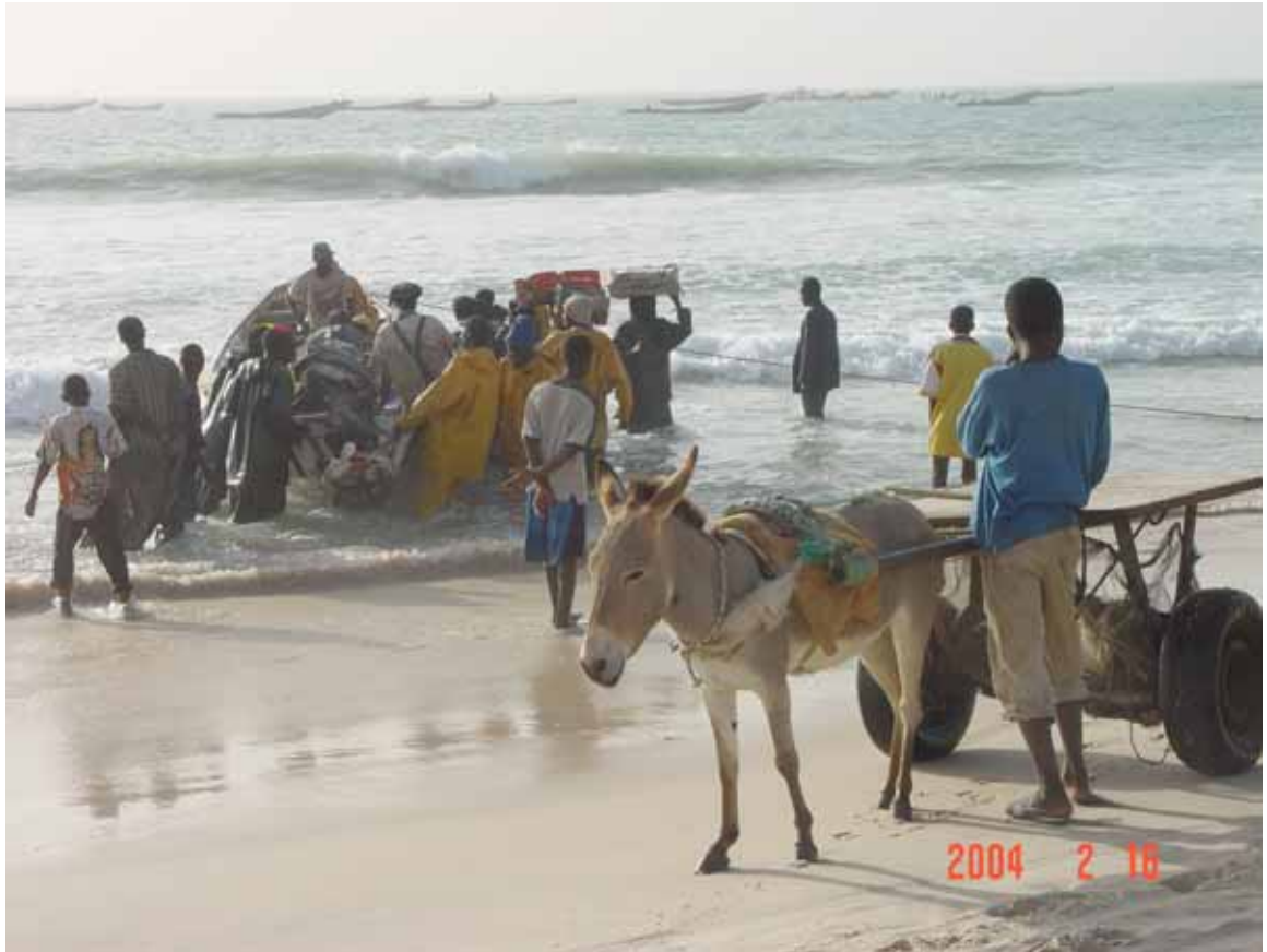
水産物水揚風景：ヌアクショット魚市場前の水揚浜で底魚類が水揚げされている。