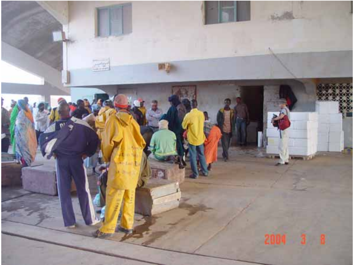
水産物荷捌風景：魚市場ホール内の仲買人ブース前での水産物荷捌。