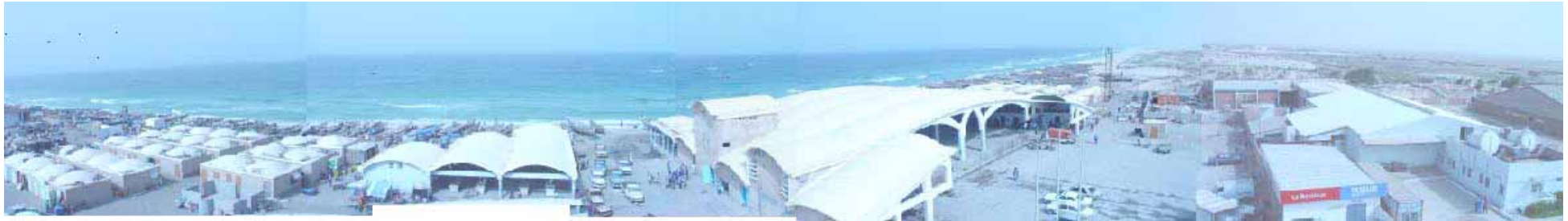
サイトの現状（1）：ヌアクショット魚市場を海側に望む。