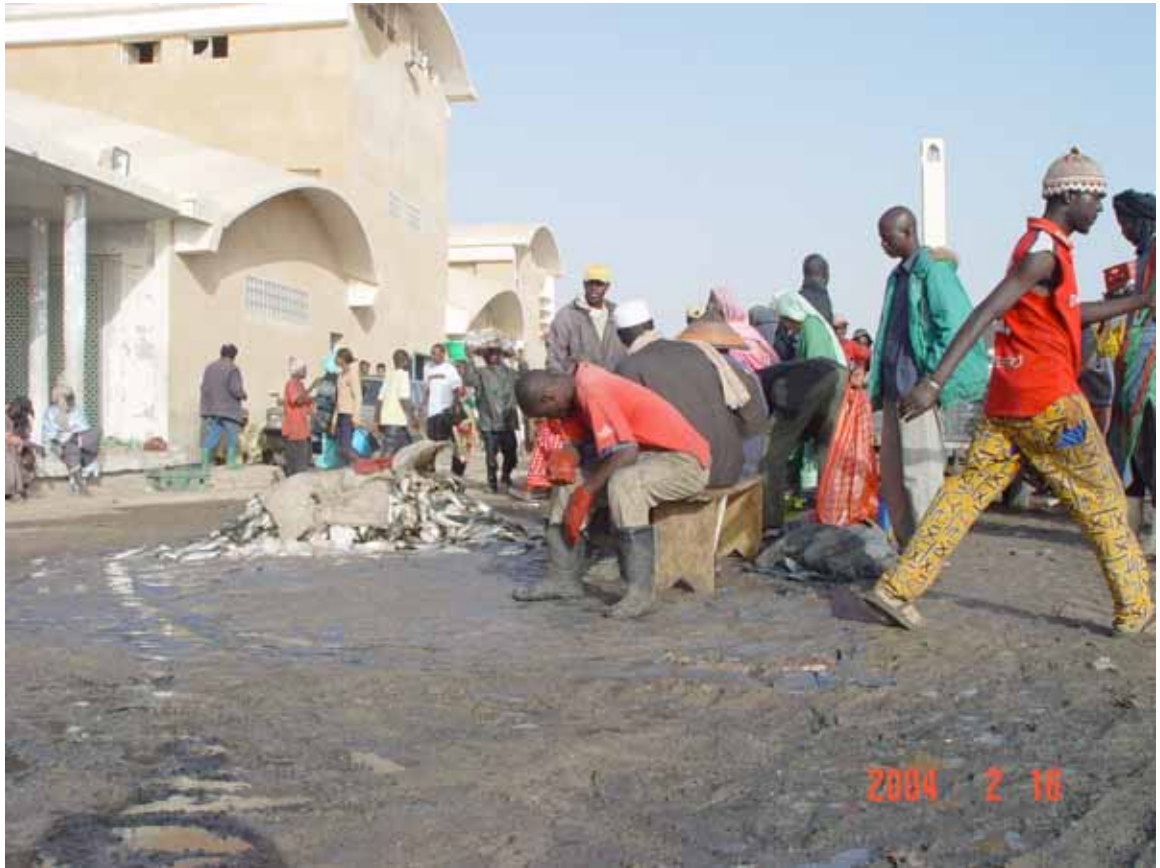
サイト周辺の現状 (3) : ヌアクショツト魚市場の浮魚仮置場の状況。