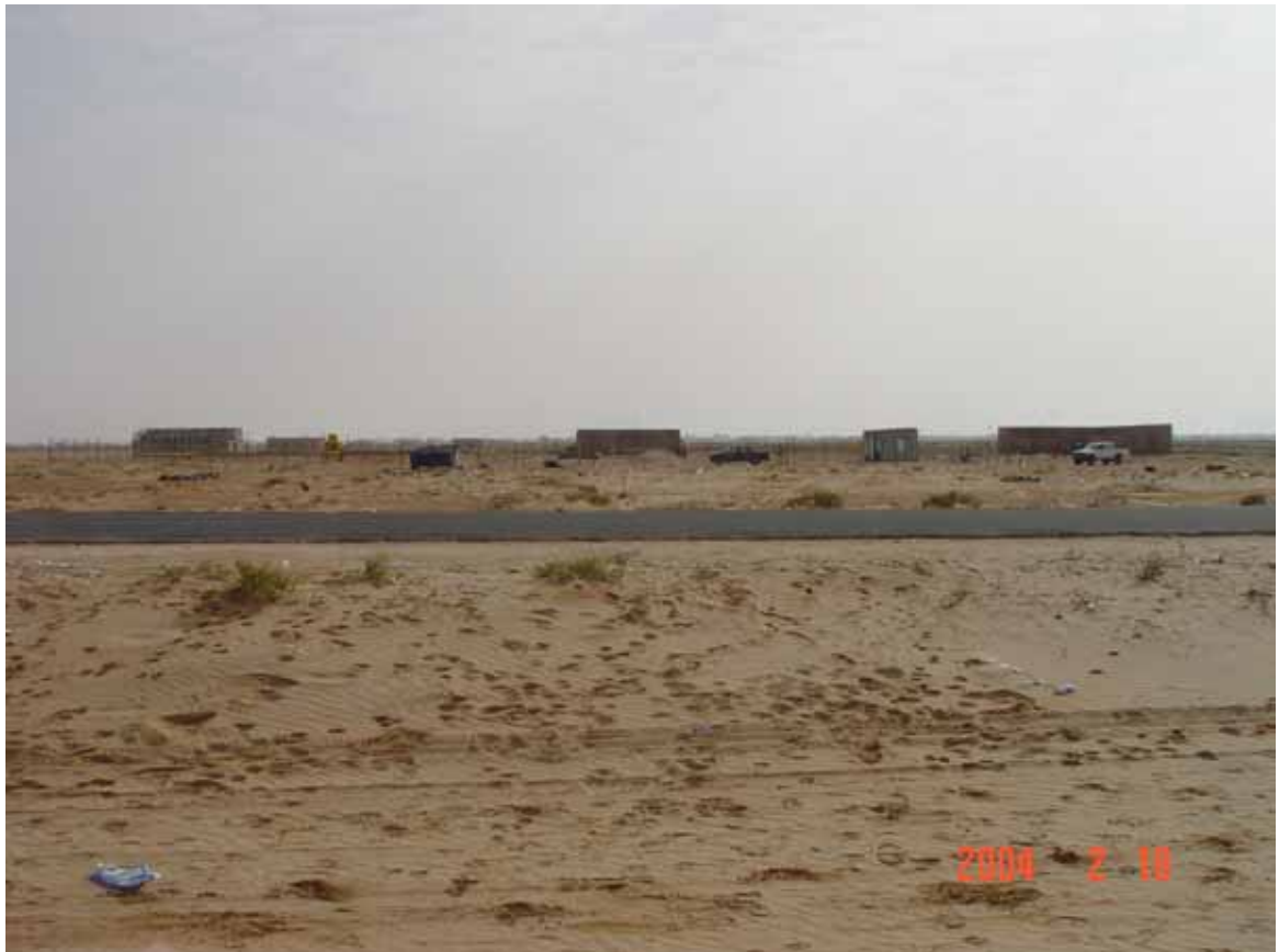
サイト周辺の現状 (4) : ヌアクショツト検査所敷地の状況。