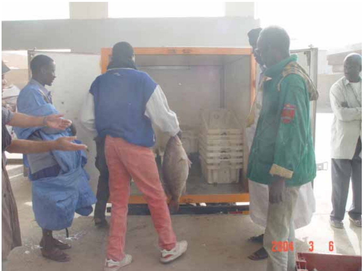
水産物荷捌風景：水産物の輸出加工場への出荷。