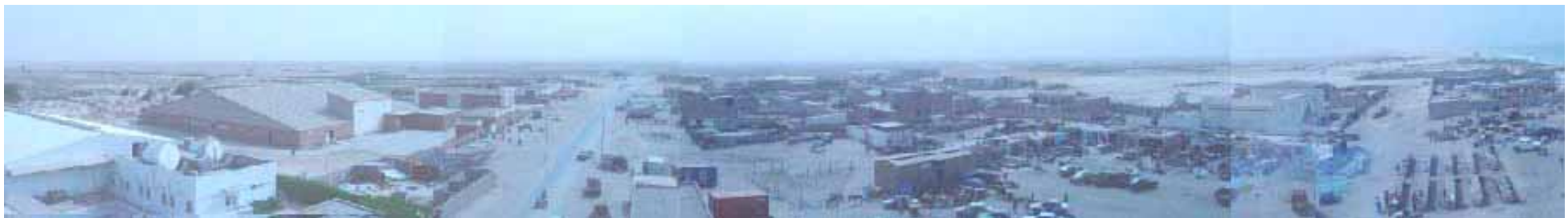
サイトの現状（2）：ヌアクショット魚市場より陸側に望む。