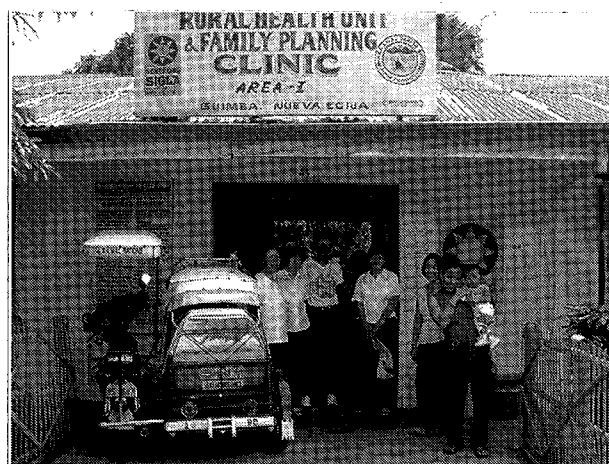
JICAプロジェクト終了後の地域保健局 (RHU)