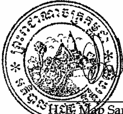
H.E. Map Sarin Deputy Governor, Phnom Penh Municipality (The Kingdom of Cambodia)