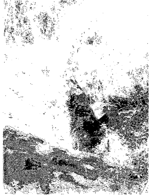
Nhabirira 堰堤から延びる送水パイプ