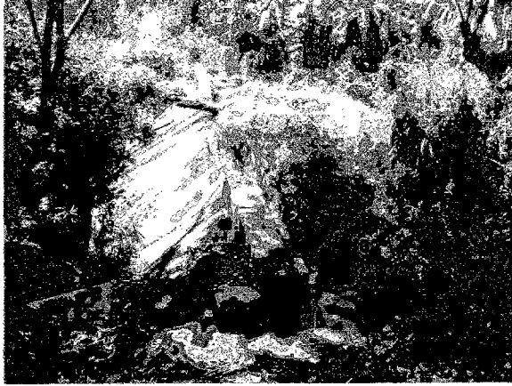
南西部半乾燥地域にある既設の Nhabirira 堰堤