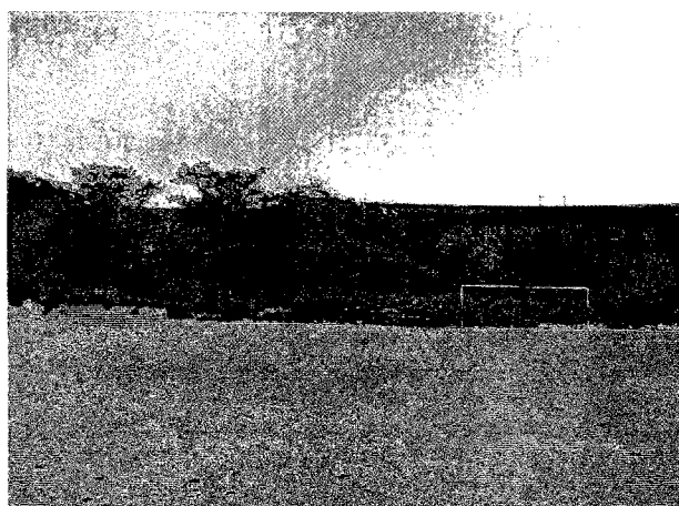
シモイヨ市の水源である Chicamba ダムの堤体