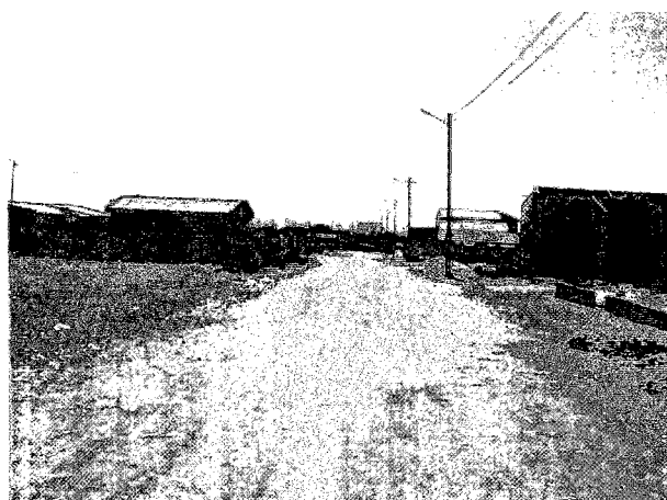
シモイヨ市給水予定地域