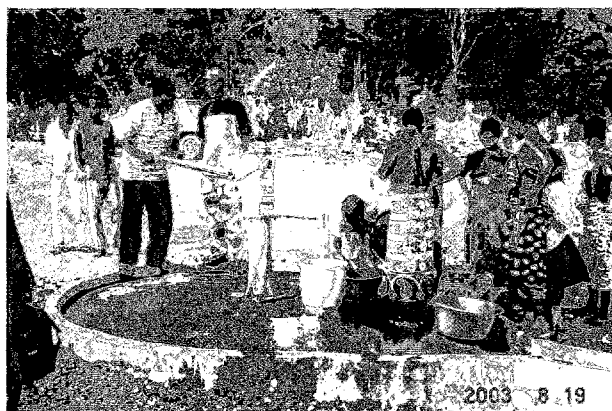
同左プロジェクトで建設したモクバ郡トンガ村の井戸の稼働状況