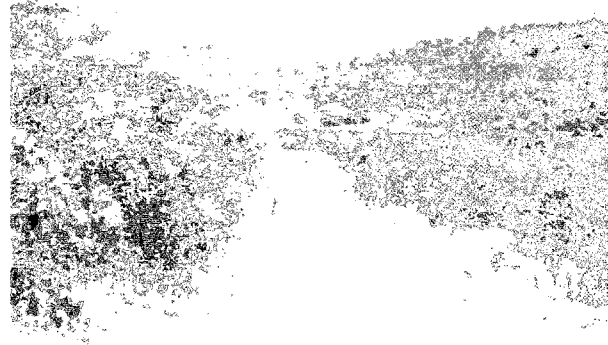
Chicamba ダムからシモイヨ市への予定送水路線