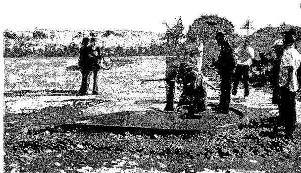
「ザンベジア州地下水開発・村落給水計画」で建設したモクバ郡メブダナ村の井戸の稼働状況