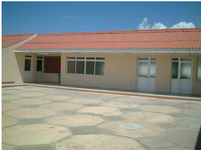
33 ルアンダ州政府が建設したパンギラ校 (レベル2・3) : 中庭から見た教室で、ドア・窓はアルミ製。