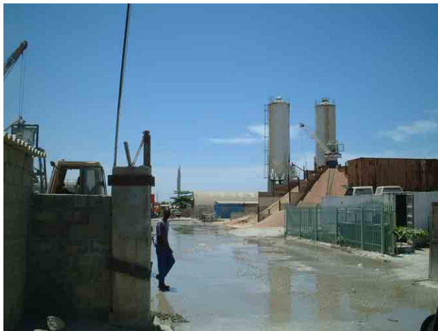
39 コンクリートプラント。南アフリカの建設会社 Grinaker が所有し、自社現場の他に他社現場にも供給。