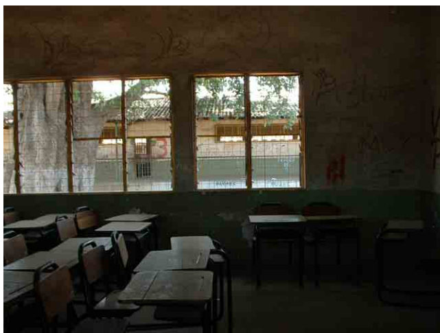
11 要請校 No.512(Rangel 市):暗くて老朽化している教室内部。