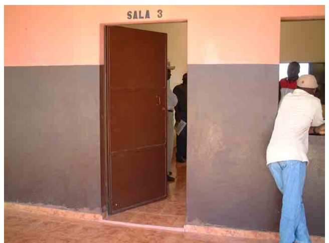
18 FAS(社会支援基金)が2003年に建設した学校 No.806:スチールドアの価格は150US$。