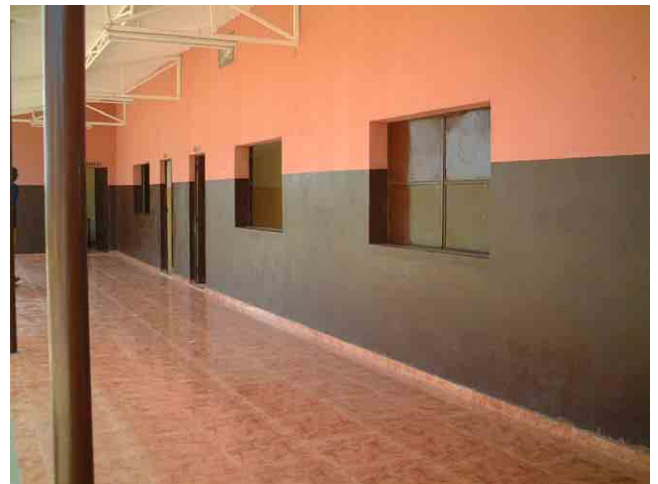
22 FAS(社会支援基金)が2003年に建設した学校 No.806:外廊下の床仕上げはセラミックタイル貼り。