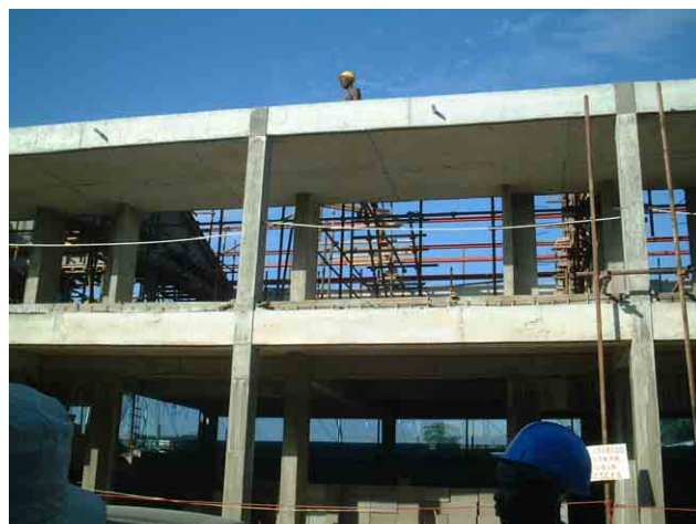
2 「第一次計画」の対象校 No.229: 2階建ての場合、廊下で多量の鉄筋コンクリートが必要。