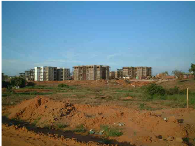
37 郊外の大規模住宅開発。南アフリカのエンジニアリング会社 Africon が施工監理。