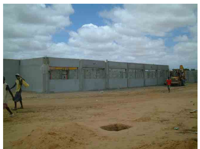
24 ポルトガル援助の小学校:「第一次計画」の対象校 No.965(500CASA)の隣地で建設中。