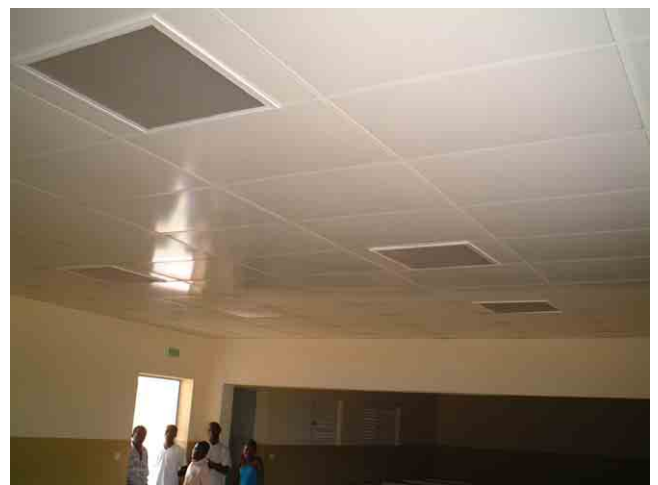
30 ポルトガル援助で 2002 年に建設された学校 No.315: 天井の照明設備はディフューザー (散乱光) つき蛍光灯。