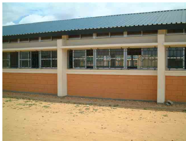
6 「第一次計画」の対象校 No.965 (500CASA): 控え柱、高窓下の庇、窓下の窓台は鉄筋コンクリート製。