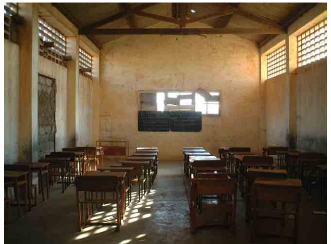
16 要請校 No.901(Viana 市):老朽化した教室内部。