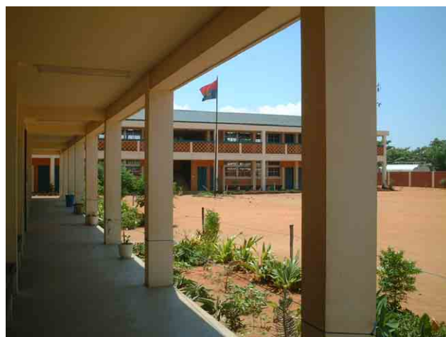
4 「第一次計画」の対象校 No.964 (KM9A): 「第一次計画」では2階、3階建ての建物が多い。