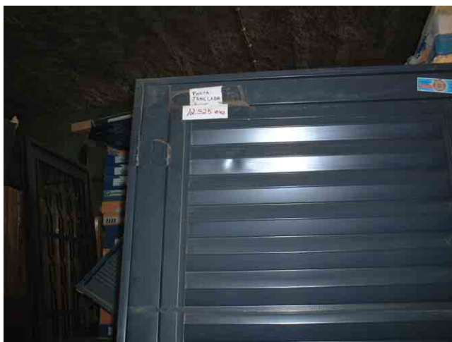
41 建材店に展示している南アフリカ産のスチールドアの価格は 157US$。