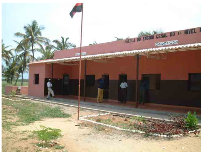
17 FAS(社会支援基金)が2003年に建設した学校 No.806。