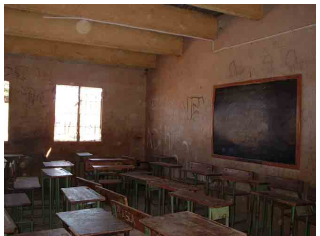
12 要請校 No.512(Rangel 市):教室内部は暗い。