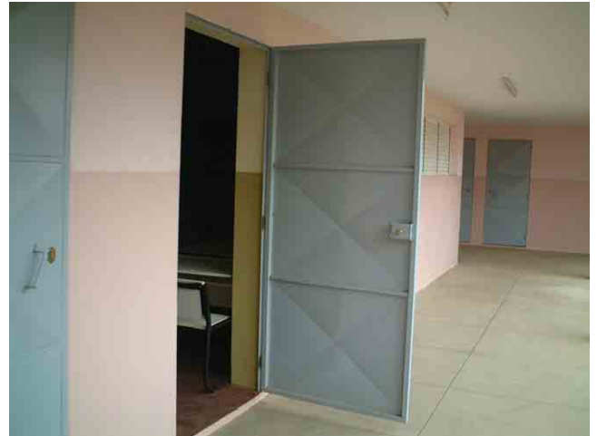
26 ポルトガル援助で 2002 年に建設された学校 No.315: スチールドアの価格は 746US$。