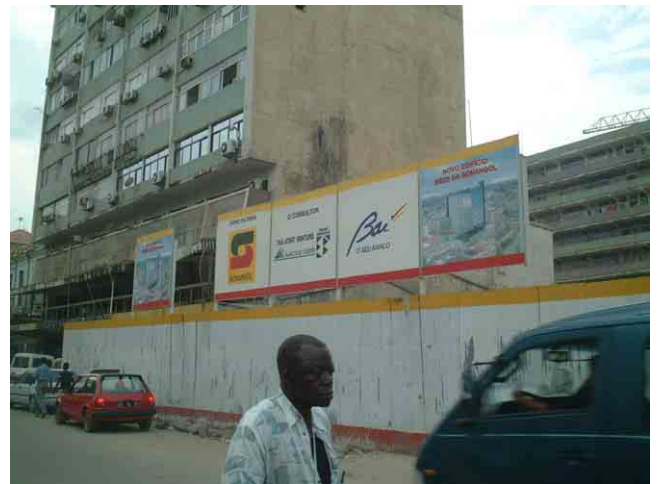
40 オフィスの建設現場。国営石油会社 Sonangol の新事務所を建設中。