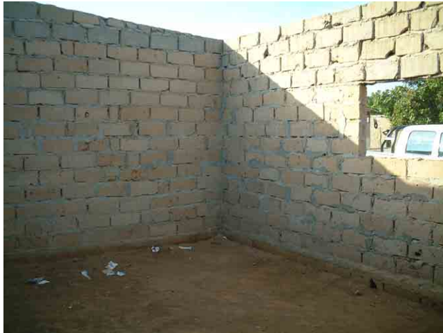
7 要請校 No.121(Samba 市):住民が建設した壁だけで屋根がない教室。