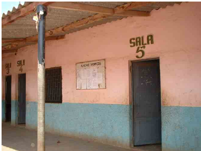
9 要請校 No.224(Maianga 市):廊下側から見た教室棟。