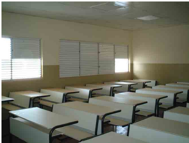
27 ポルトガル援助で 2002 年に建設された学校 No.315: 2 人用机椅子の価格は 334US$ (調達先不明)。