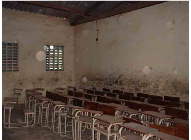
8 要請校 No.224(Maianga 市):狭く暗く老朽化している教室内部。