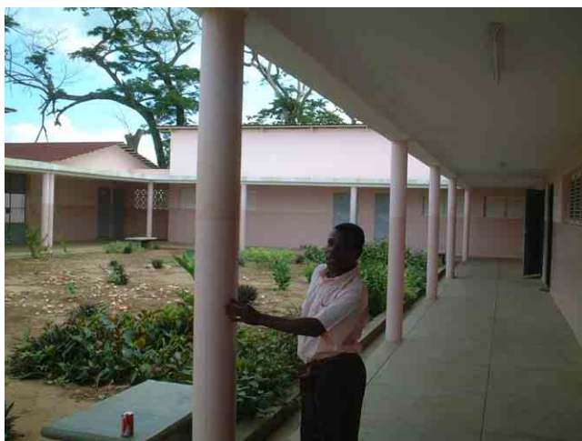
29 ポルトガル援助で 2002 年に建設された学校 No.315: 外廊下の床仕上げはモルタル仕上げ。