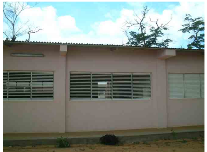
28 ポルトガル援助で 2002 年に建設された学校 No.315: 教室の外壁に柱型と梁が出ている。