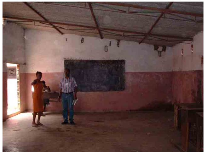
10 要請校 No.414(Sambizanga 市):ポルトガル統治時代に建設された倉庫を学校の教室に利用。