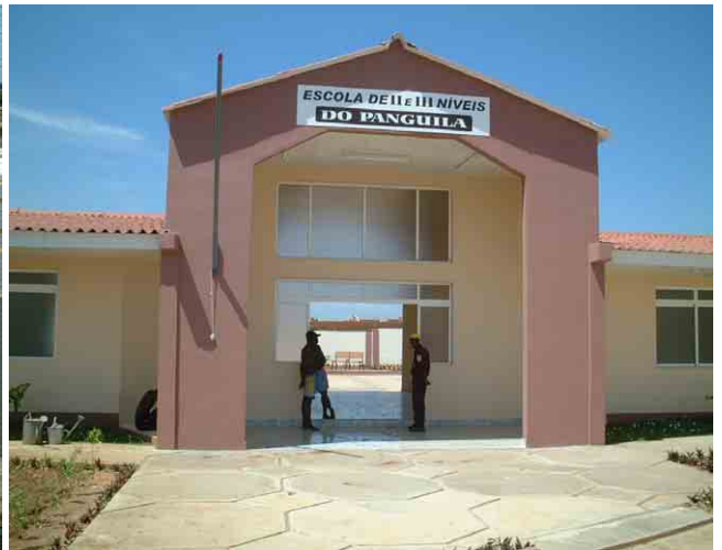
32 ルアンダ州政府が 2003 年に建設したレベル2・3 (5~8 年生) の小中学校。