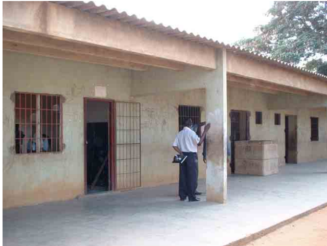
13 要請校 No.512(Rangel 市):教室のドアや窓は鉄格子部分だけが残っている。軒下が高く、廊下幅も広い点だけは快適。