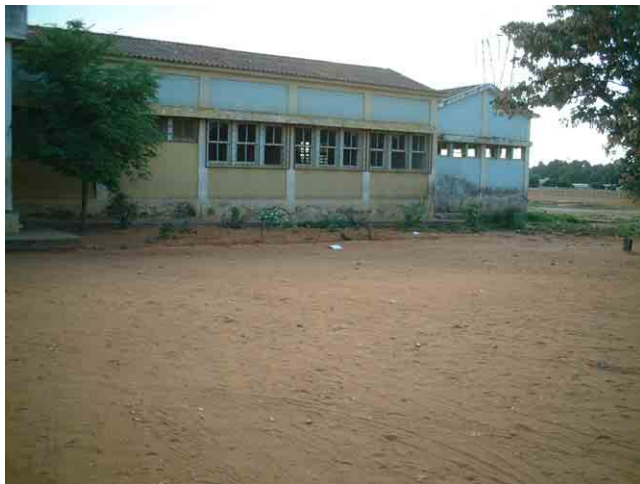
15 要請校 No.901(Viana 市):ポルトガル統治時代に建設された学校の外観。