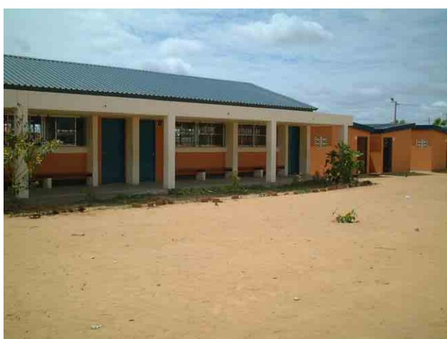
5 「第一次計画」の対象校 No.965 (500CASA): 平屋建て教室棟およびトイレ棟。