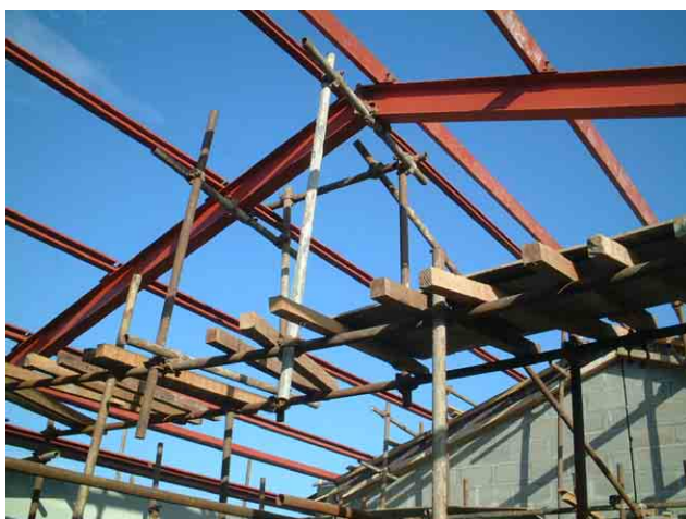
3 「第一次計画」の対象校 No.229: 屋根の鉄骨工事。ワイドフランジ形鋼を使った架構は現地では稀有。