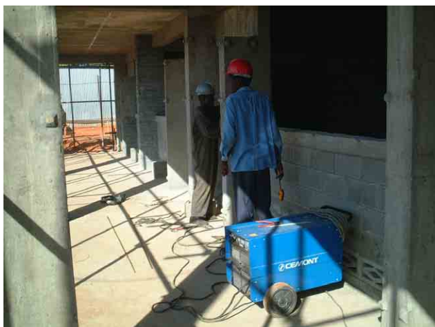
1 「第一次計画」の対象校 No.124: 教室廊下側壁下の通風ブロックの上のまぐさ(lintel)部分は鉄筋コンクリート製。