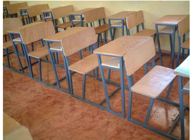
20 FAS(社会支援基金)が2003年に建設した学校 No.806:教室床のセラミックタイルの価格は19.16US$/m 2 。