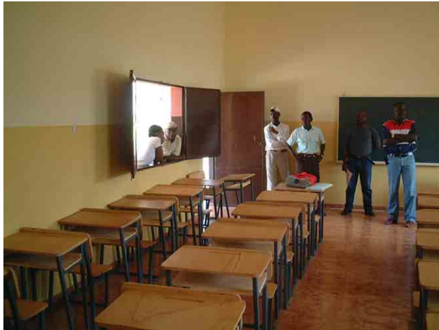
19 FAS(社会支援基金)が2003年に建設した学校 No.806:国産1人用机・椅子の価格は55US$。