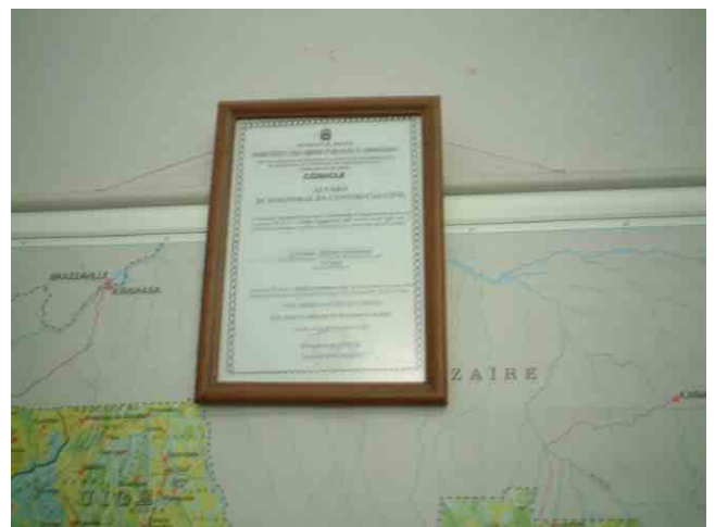
42 公共事業省の建設業登録証。