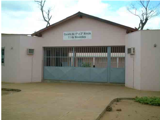
25 ポルトガル援助で 2002 年に建設された学校 No.315。