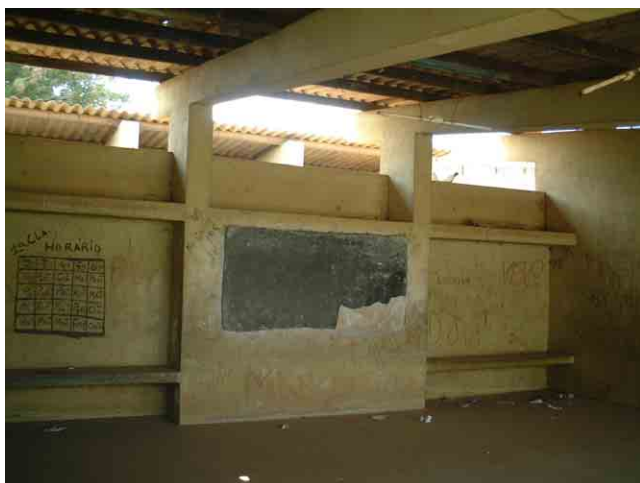
35 キューバ援助で建設された学校: 「第一次計画」の対象校 No.614 の既存校舎。