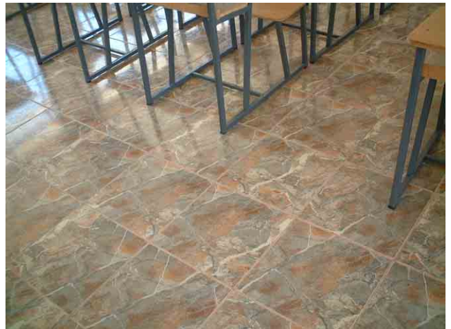
34 ルアンダ州政府が建設したパンギラ校: 教室床のセラミクタイトルの価格は 65US$/m 2 。