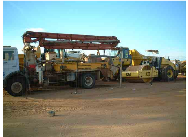
38 建設現場で見かけた大型建設機械。