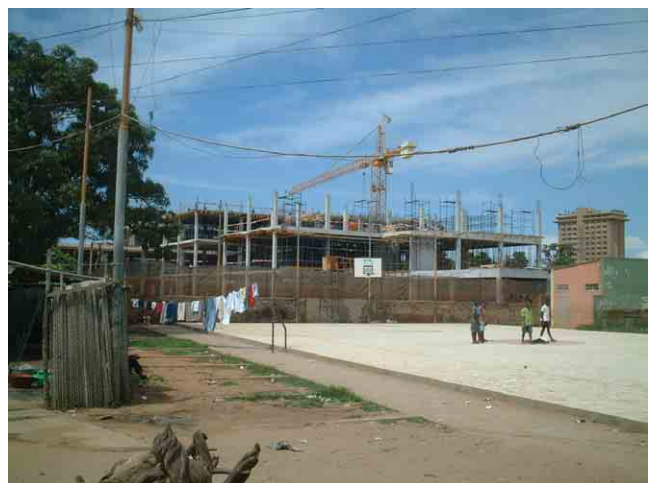
36 大規模病院の建設現場。ポルトガル系大手建設会社 Somague 社の施工。