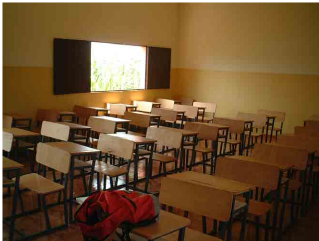
21 FAS(社会支援基金)が2003年に建設した学校 No.806:教室の柱型は壁厚内に収まっている。