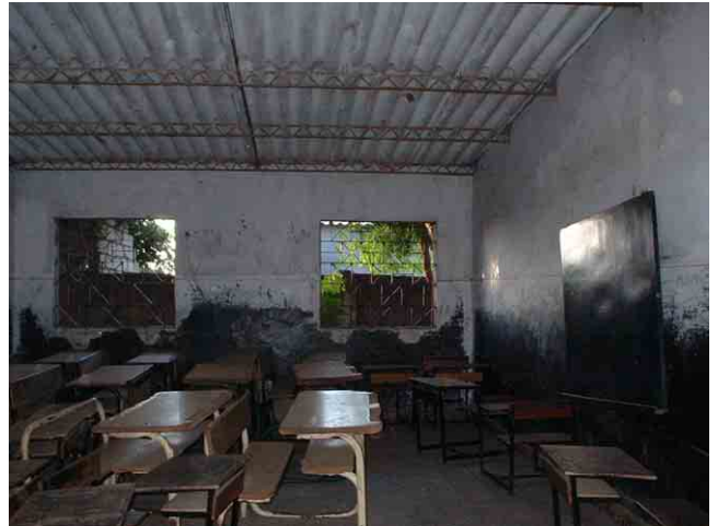
14 要請校 No.604(Kilamba Kiayi 市):ポルトガル統治時代に建設された教室で、破損は修理せずに放置。