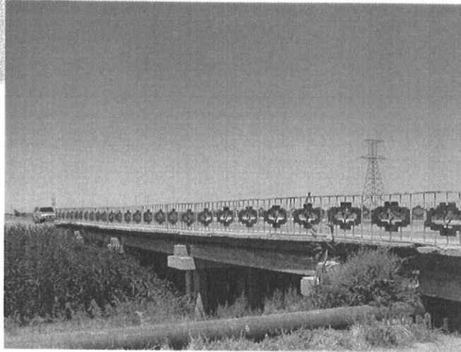
Km302 Bridge 5 x 9m section.