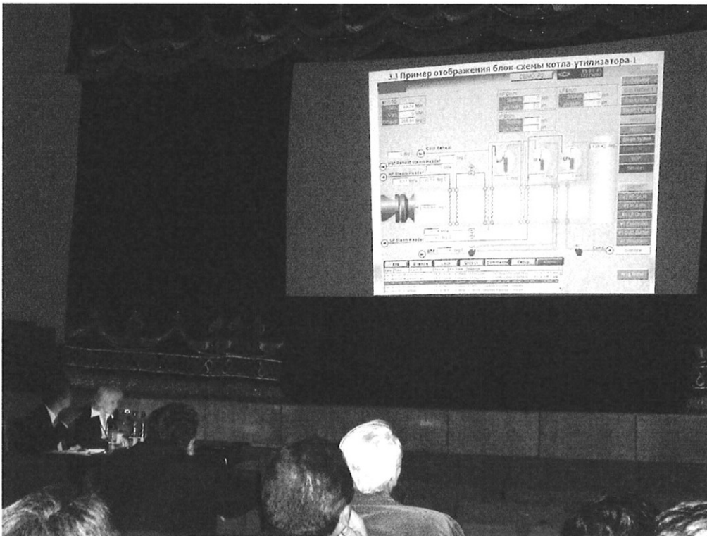
技術移転セミナー状況