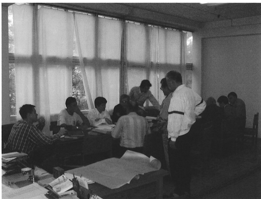
カウンターパート（タシケント火力発電所）との打合せ状況