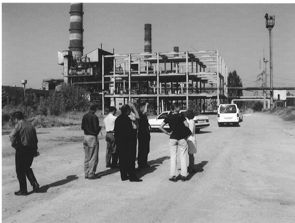
コンバインドサイクルプラント建設予定地（視察状況）