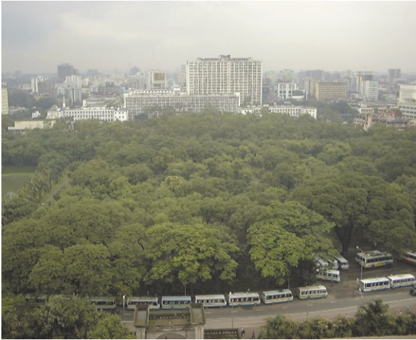
北部市街風景（ダッカ市庁舎より）