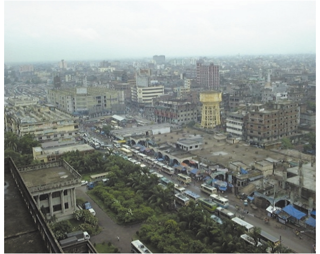
旧市街風景（ダッカ市庁舎より）