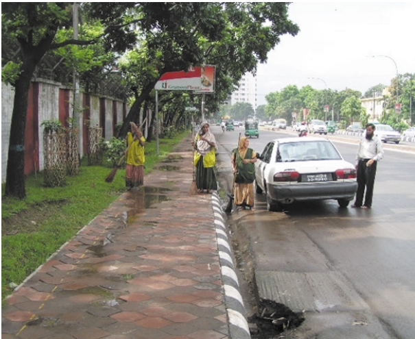
ダッカ市清掃員による道路清掃状況