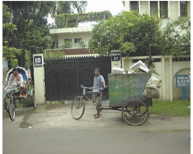
ボナニ地区戸別収集風景（その1）