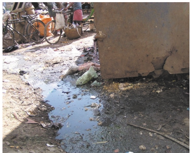
コンテナからの汚水