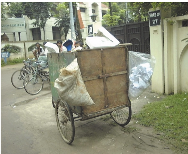
ボナニ地区戸別収集風景（その2）