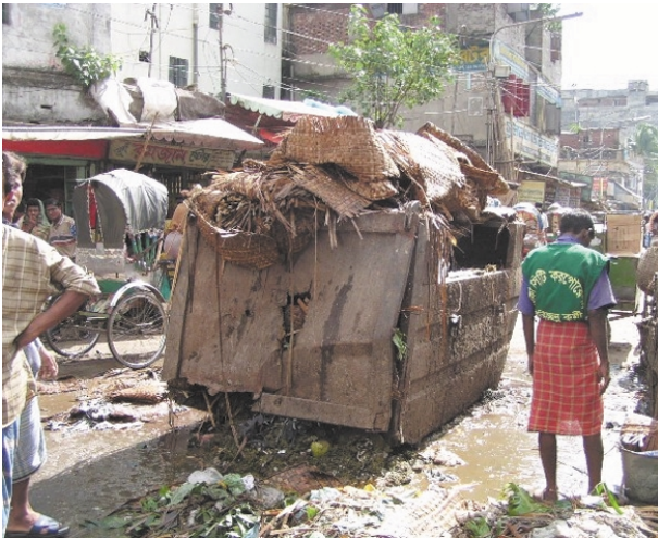
バザール内に設置されたゴミコンテナ