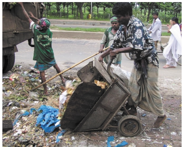
ダストビンへのゴミ排出状況