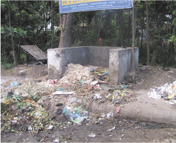
ダストビン周辺のゴミ排出（散乱）状況