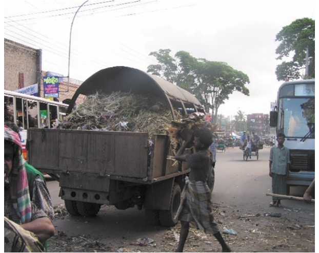
ダッカ市によるダストビンからのゴミ回収状況