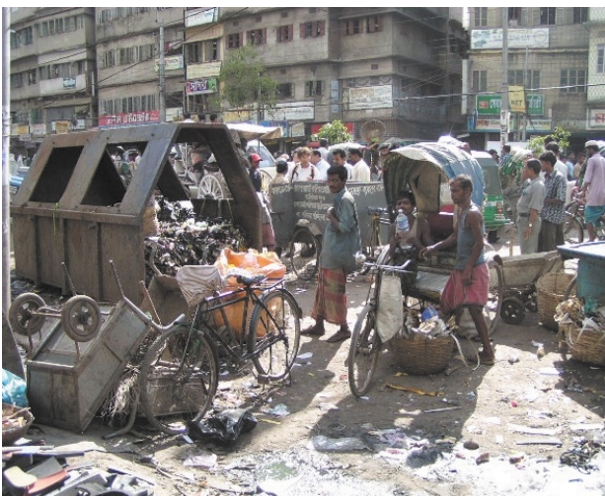
道路に設置されたコンテナ