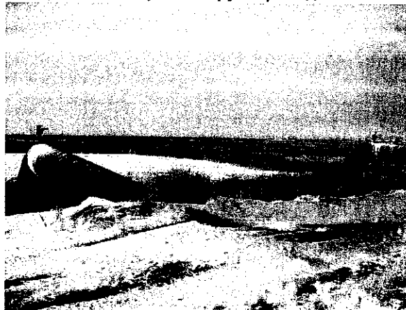
2 сифонных выпускных трубопровода