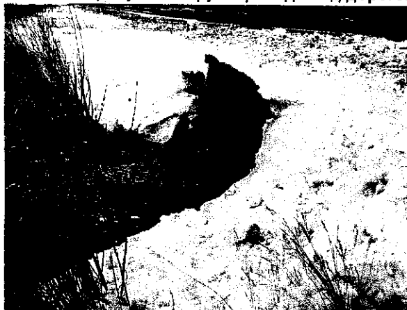
2 перепускных трубопровода под дорогой