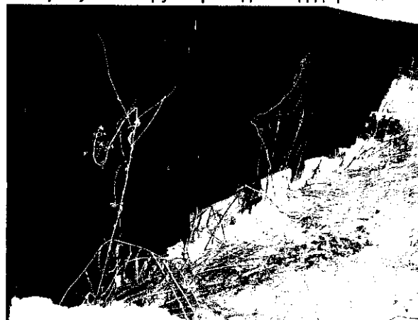
7 перепускных трубопроводов под дорогой