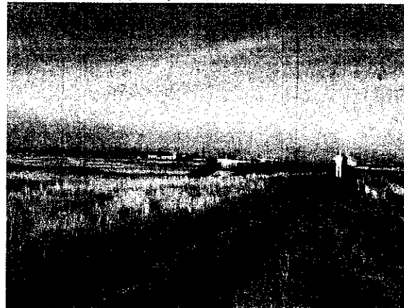
2 сифонных трубопровода на дамбе