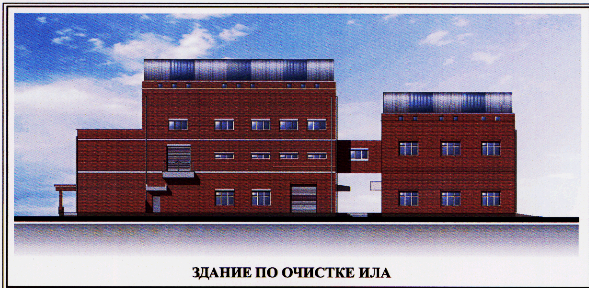
Рисунок Р-3 Вид сооружения очистки ила на КОС