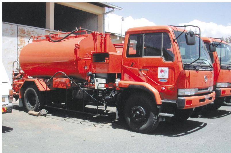
道路保守関連供与機材 (アスファルトディストリビューター)