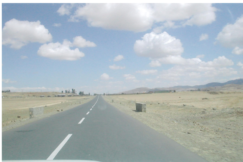
無償資金協力による道路整備状況 (アジスアベバ - フィッシュ間)