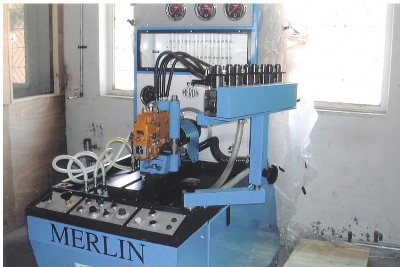
道路建設機械整備関連供与機材 (燃料噴射ポンプテスター)