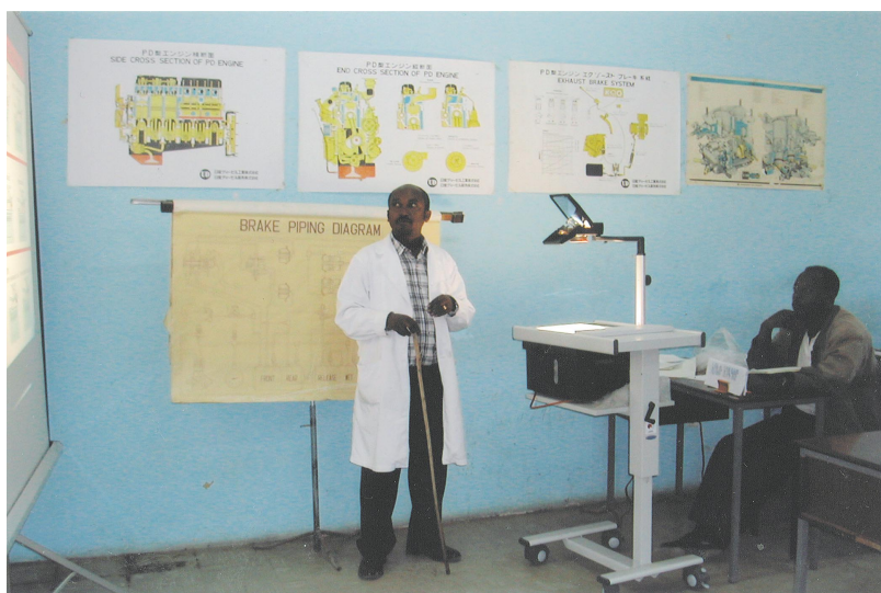
整備訓練コース講義状況