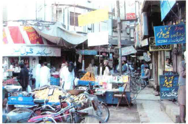
市街地中心部の商店街風景