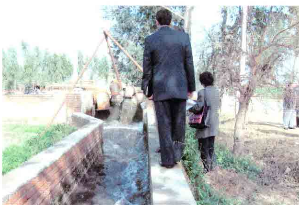
既設ポンプ場C-2の排出口と放流水路