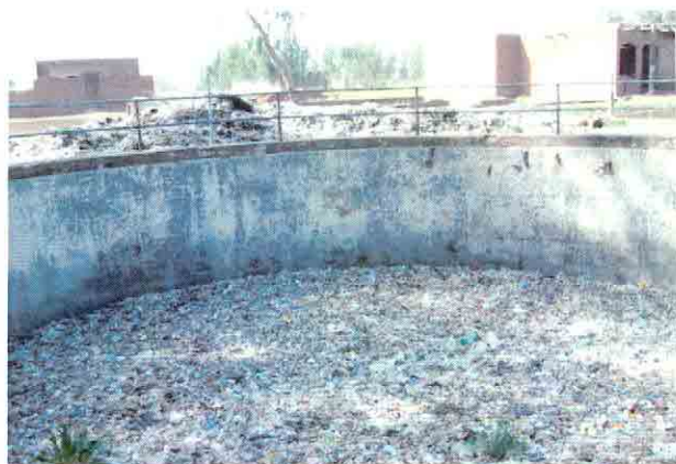
既設ポンプ場C-1の沈砂池(冠水して周辺のスクリーンかすが混入)