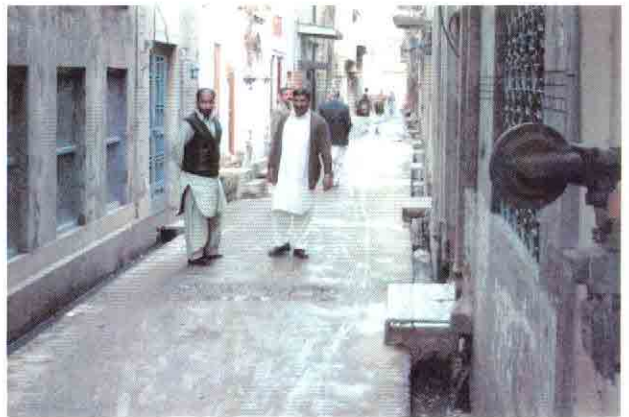
市街地中心部住宅密集地区の排水側溝