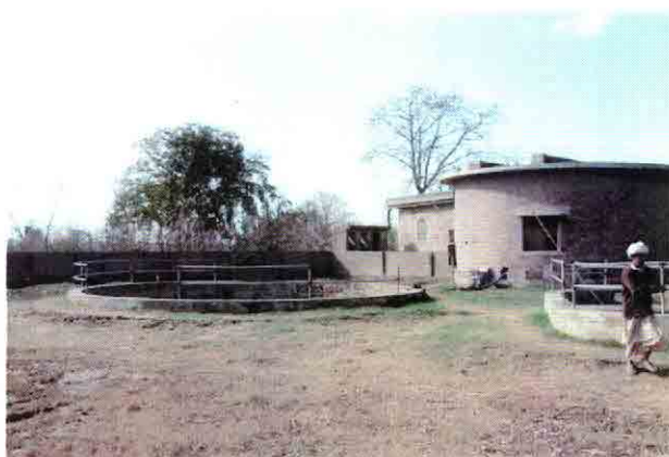
既設ポンプ場C-2全景