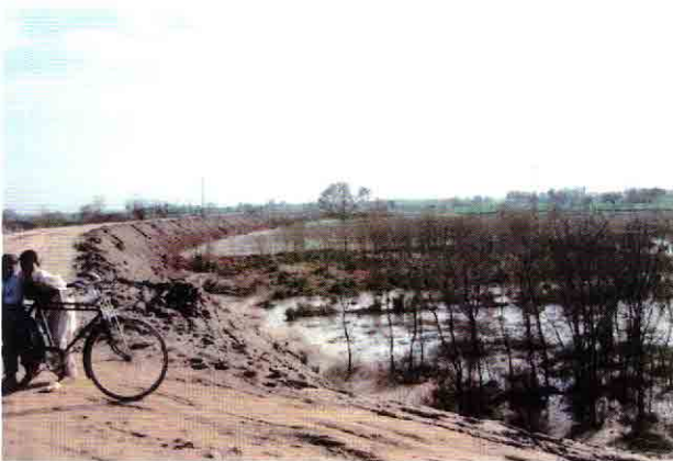
PS-2ポンプ場予定地(左側がHelsy川の堤防)