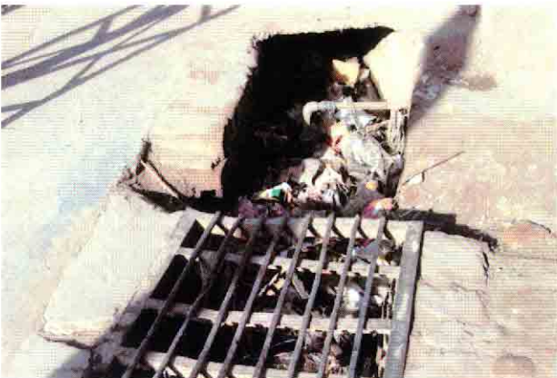
ゴミで詰まった市街地中心部の排水溝