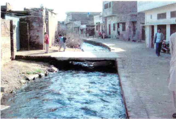
既設ポンプ場C-1下流の一部整備された排水路