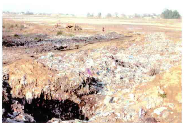
Bhimbar川河川敷のゴミ処分場