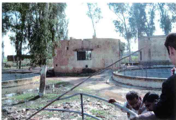
既設ポンプ場C-1全景