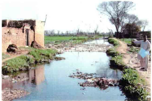
既設ポンプ場C-1下流の下水処理場予定地