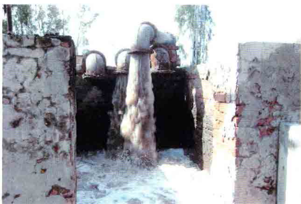
既設ポンプ場C-1の排出口