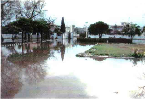
市内の住宅地の冠水状況