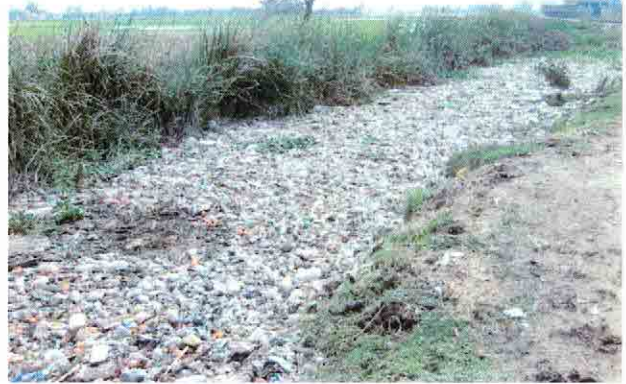
ゴミで埋め尽くされた滞留したままの市内の排水路