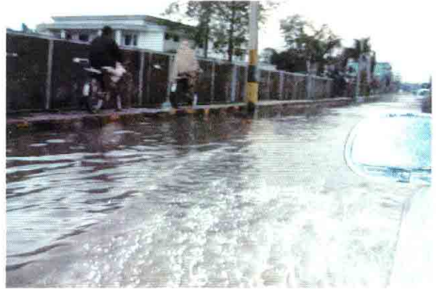
市内の道路の冠水状況