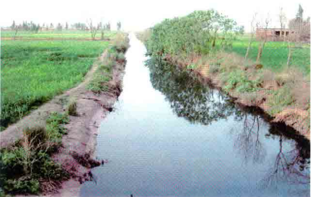
灌漑局が整備した市南端部～Chenab川への排水路