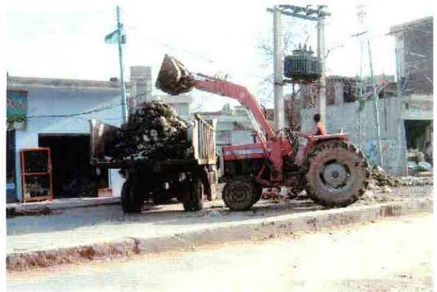
市内のゴミ撤去風景