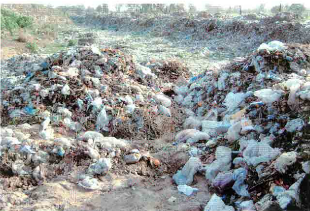
GT道路脇のゴミ投棄場所