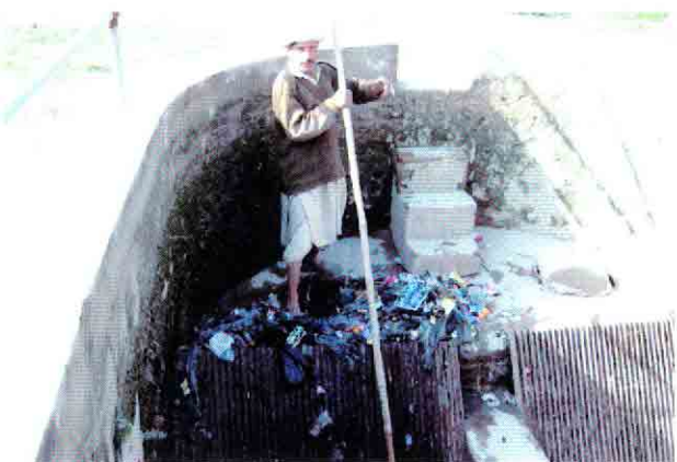
既設ポンプ場C-2のスクリーンかす除去作業風景