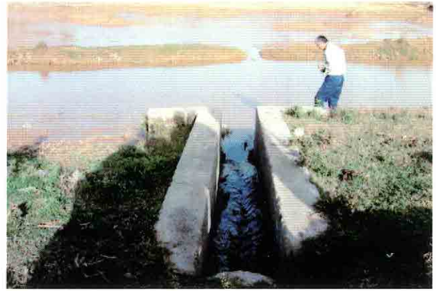
PS-1ポンプ場予定地付近のHelsy川への既設放流口