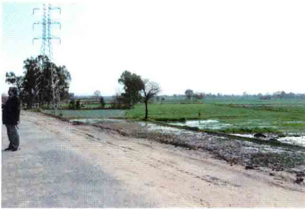
PS-1ポンプ場予定地(左側がHelsy川の堤防)