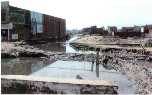
滞留したままの汚水とゴミで腐敗したの市内の排水路