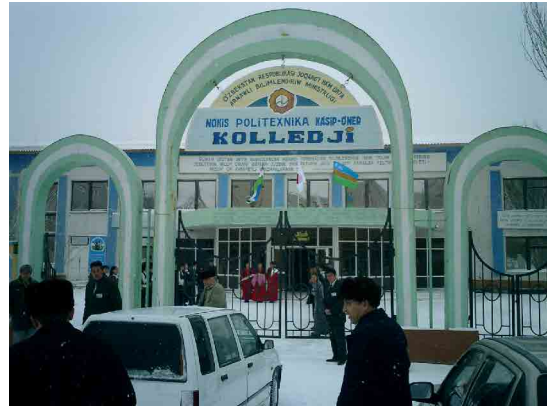
ヌクス PC 正門