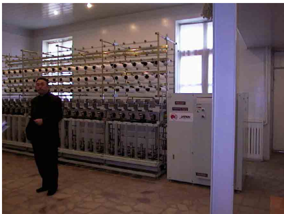
タシケント繊維軽工業大学無償供与機材