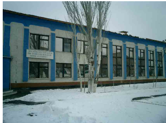
ヌクス PC 教育棟