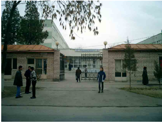
タシケント PC 正門