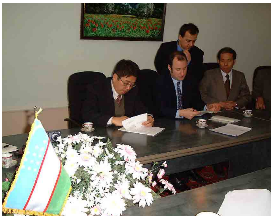
協議議事録 2 署名