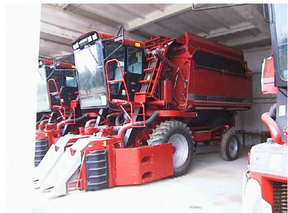
農業機械貸出センター