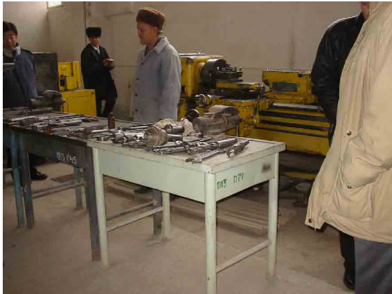
ブハラ PC 機械工作室