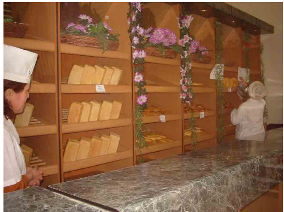
タシケント PC 附属製パン所