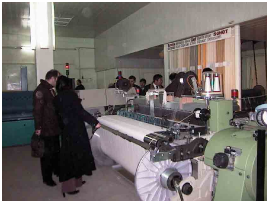
タシケント繊維軽工業大学無償供与機材