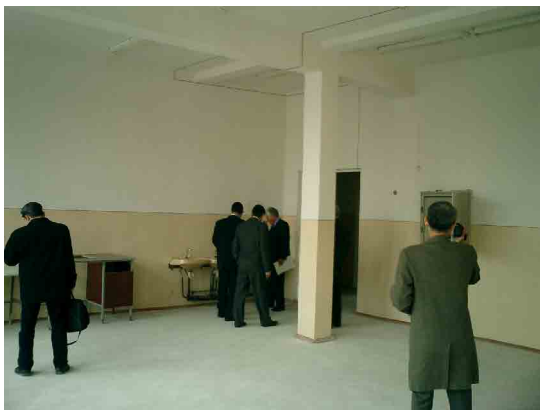
タシケント PC 製パン・製麺実習室