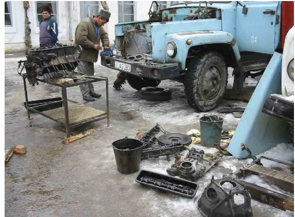
プハラ・ガス供給会社ワークショップ