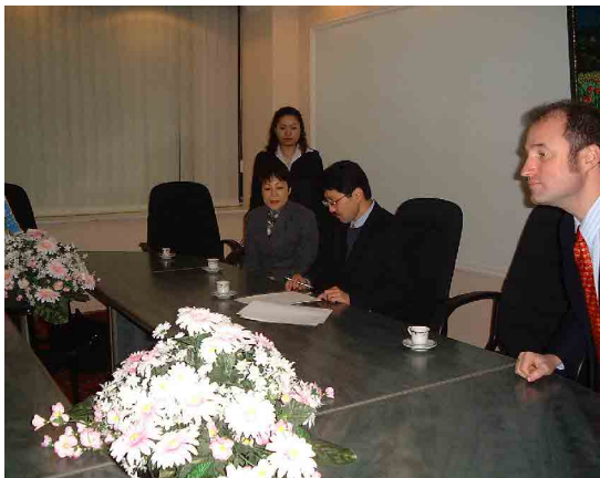
協議議事録 1 署名