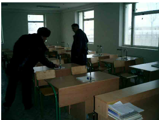
ウルゲンチ PC 化学実験室