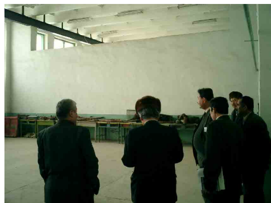
ヌクス PC 金属加工実習室