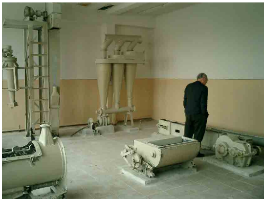
タシケント PC 食品加工機械保守実習室