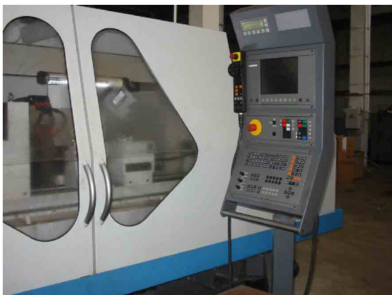
タシケント農業機械工場