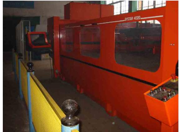
タシケント農業機械工場