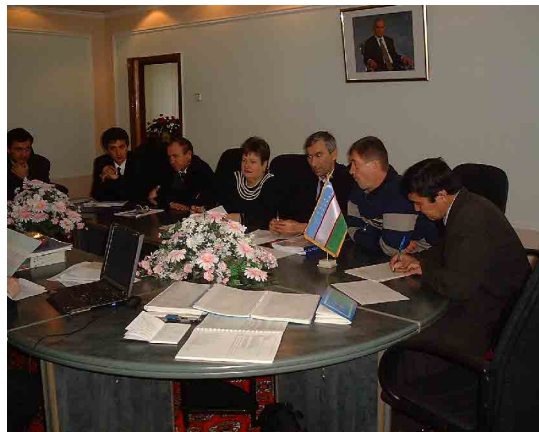
専門家小部会協議