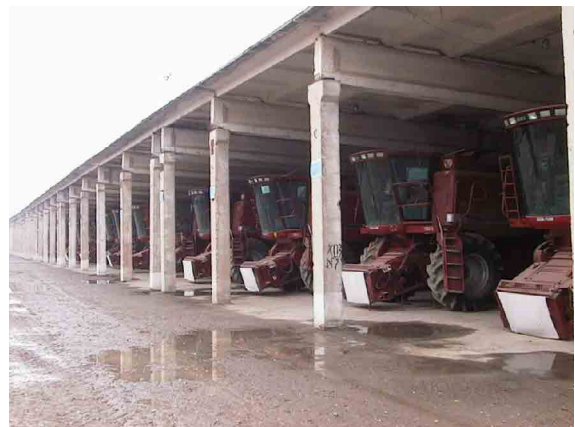
農業機械貸出センター