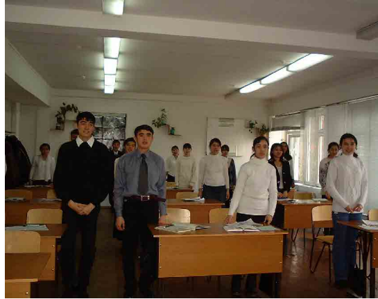
タシケント PC 生物実験室