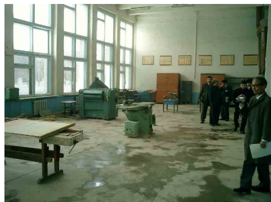
ヌクス PC 金属加工実習室