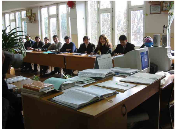
タシケント PC 教室