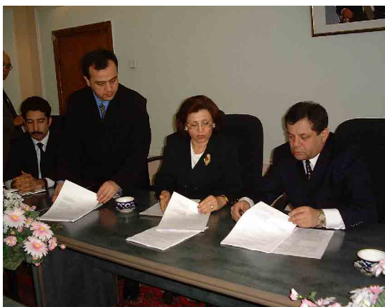
協議議事録 2 署名