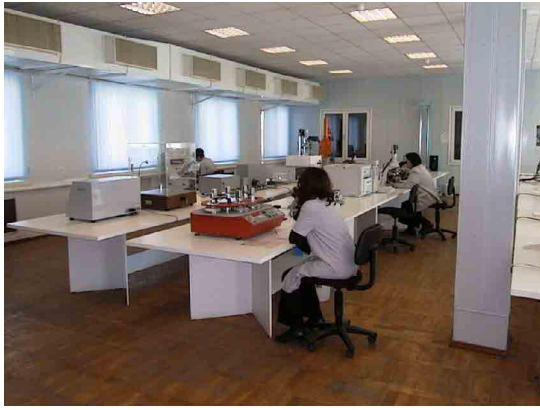
タシケント繊維軽工業大学無償供与機材