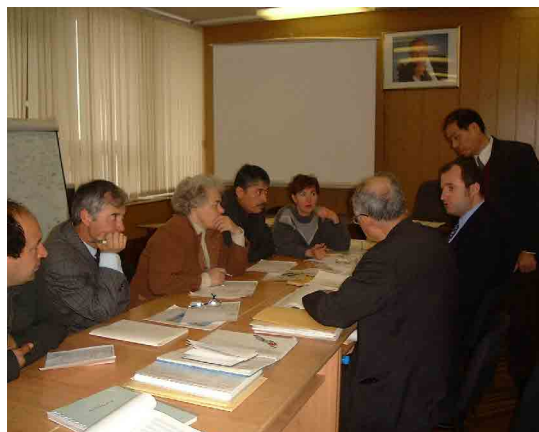
専門家小部会協議