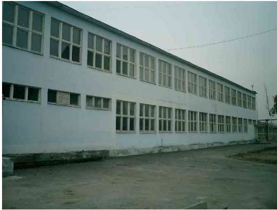
タシケント PC 実習棟