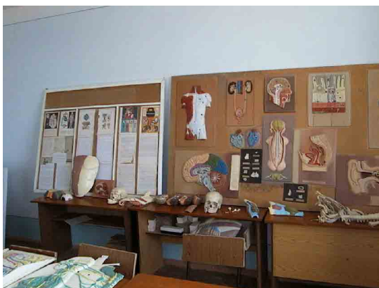
ウルゲンチ PC 看護教室