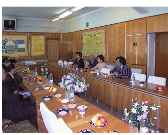
タシケント繊維軽工業大学協議