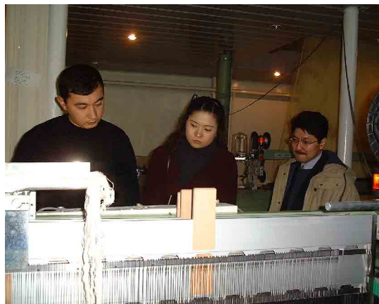
タシケント繊維軽工業大学無償供与機材