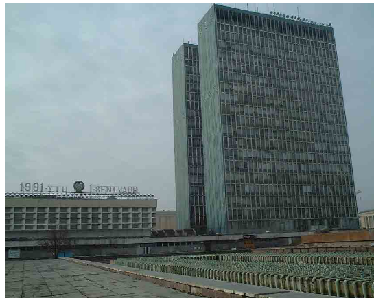
中等専門教育センター(CSSVE)