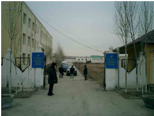
ウルゲンチ PC 教室棟