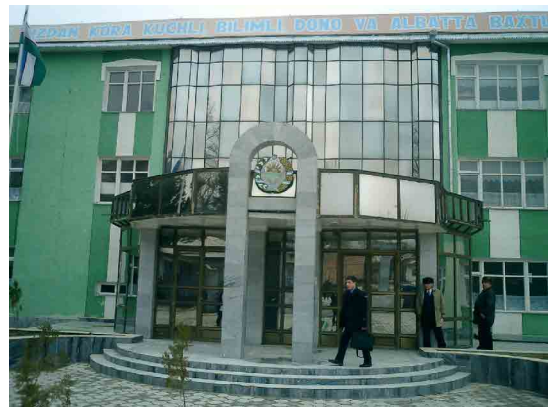
ウルグート PC 玄関