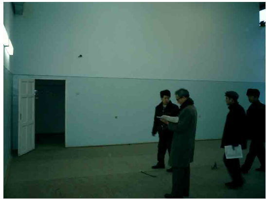
コーカンド PC 実習室（外食・仕出）