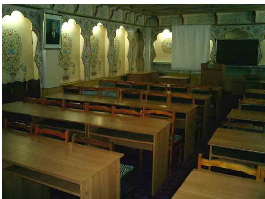
IDSSVE 再訓練学部 コンファレンス・ホール