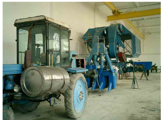
ナマンガン PC 農業機械実習室