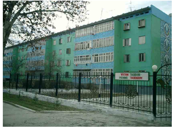
ナマンガン PC 教育棟