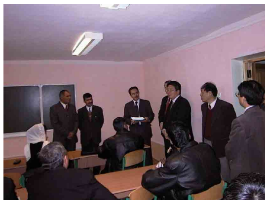
IDSSVE 再訓練学部 教室