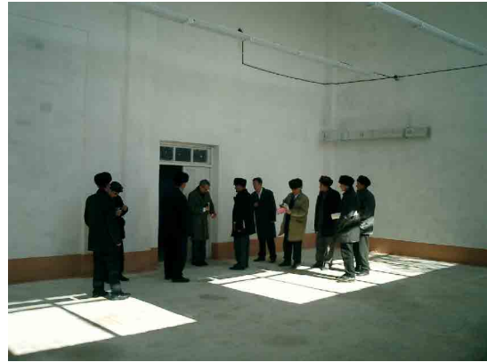
ベシュケント PC 農産品貯蔵実習室