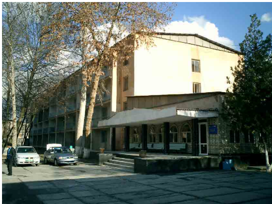
中等専門教育開発研究所(IDSSVE)本部