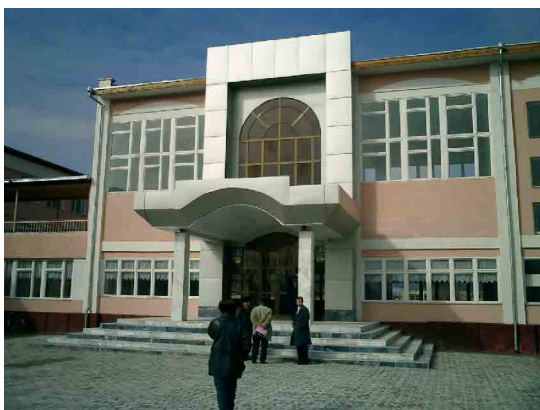
ベシュケント PC 玄関