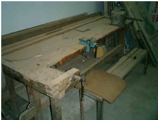
ウルグート PC 木工工作室