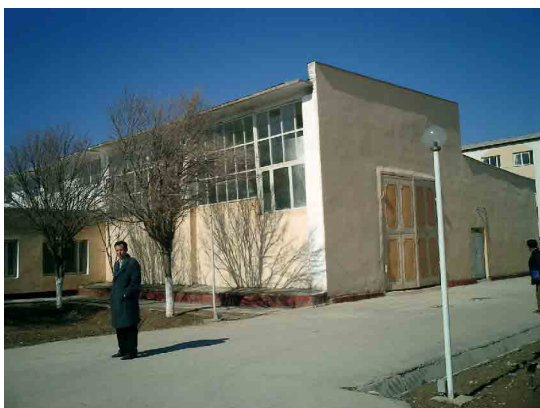
ベシュケント PC 実習棟