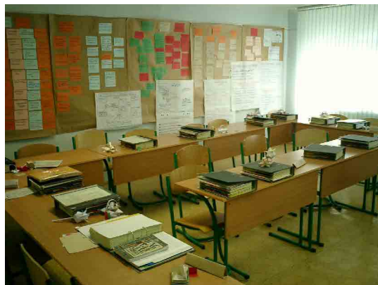
IDSSVE 再訓練学部 セミナー室