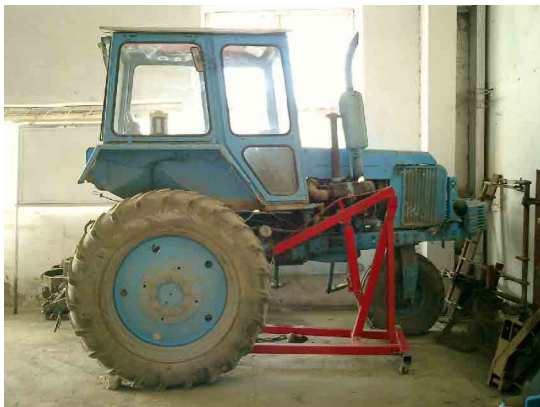
アサカ PC 農業機械保守実習室