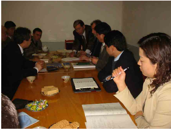
ISSSVE 基本設計調査協議