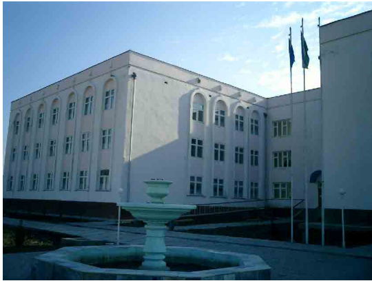
アサカ PC 教育棟