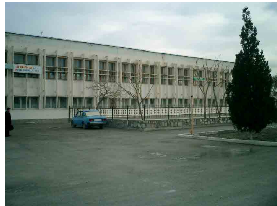
ブハラ PC 教育棟