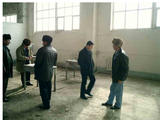
ブハラ PC ガス設備保守実習室