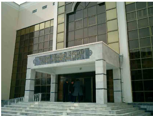
コーカンド PC 玄関