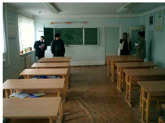
ブハラ PC 電気設備保守教室