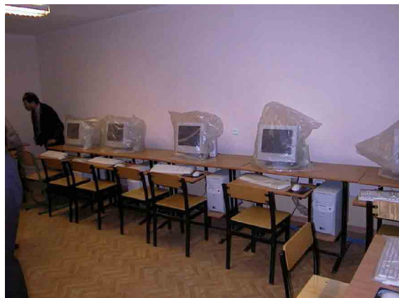
IDSSVE 再訓練学部 情報技術教室