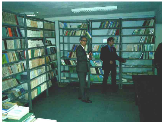
IDSSVE 再訓練学部 図書館