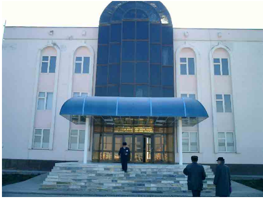
アサカ PC 玄関