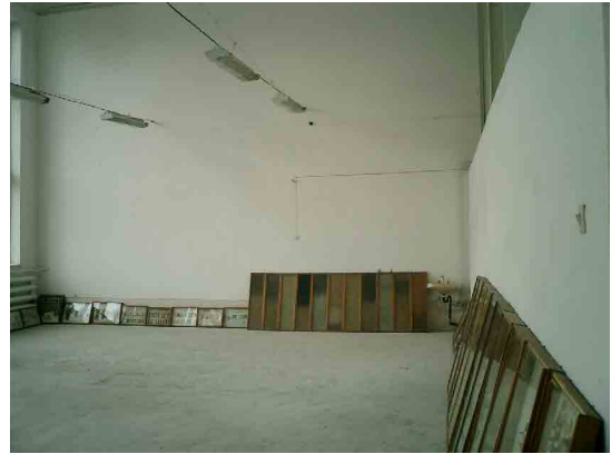
ナマンガン PC 農学実習室