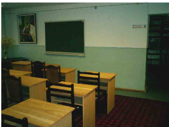
IDSSVE 再訓練学部 教室