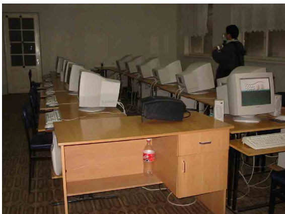
コーカンド PC コンピュータ室（韓国基金）