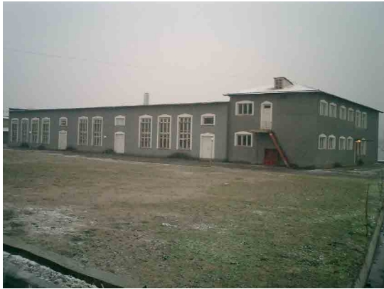
ウルグート PC 実習棟