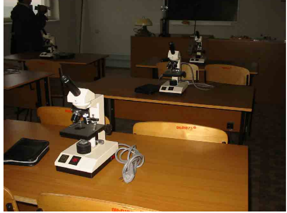
コーカンド PC 生物実験室（韓国基金）