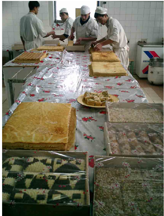
コーカンド PC 製菓実習室