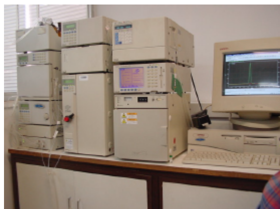
写真11 CCクロマトグラフラボ

高速液体クロマトグラフ:日本製1998年導入。現地代理店がしっかりしているためきちんと機能しているとのこと。