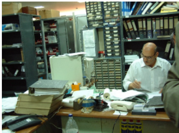
写真7 ESTC資料 部品庫

補修部品、消耗部品の保管と出入庫管理および技術資料・顧客データ管理を行っている。