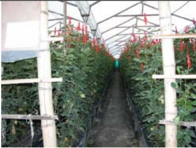
ボゴタ平原の花卉栽培農園の状況。花卉栽培はボゴタ平原における主要な産業の一つであり、大きな利益を生んでいる。