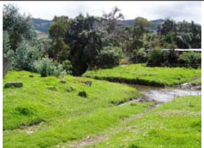
ボゴタ平原西部を流れるスバチョケ川の流水状況。洪水期における余剰河川水を、地下水人工涵養に利用可能である。