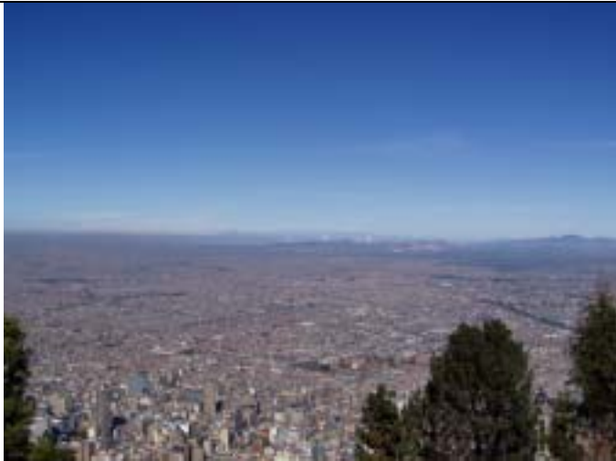
ボゴタ市。東部山地帯から撮影。本 M/P では、東部山地帯における 76 の井戸による地下水開発・保全事業を提案している。