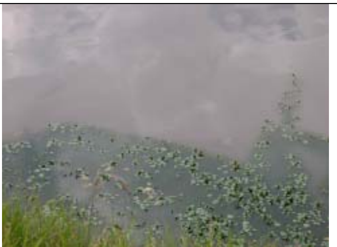
テイビトック浄水場付近のボゴタ川水面の状況。水質汚濁が認められる。ボゴタ平原における開発事業が河川水質環境を悪化させている。河川からの取水量を減らすことが河川環境の改善につながる。