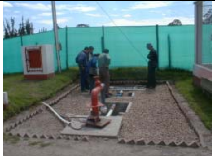
花卉栽培園における揚水井戸。ボゴタ平原では多量の地下水が花卉栽培に利用されている。