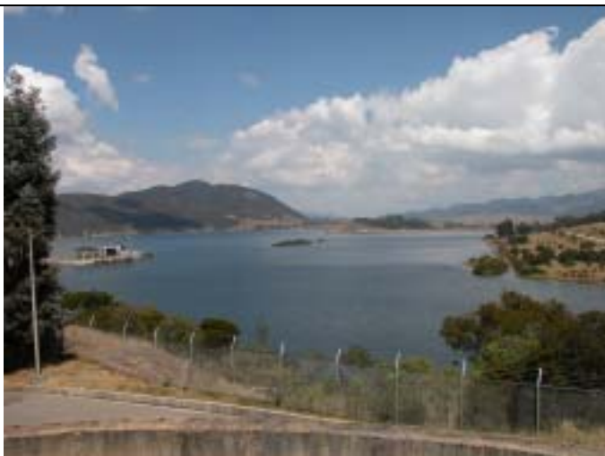
San Rafael 貯水池。この貯水池にはチンガサダムからの導水が貯水されており、ボゴタ市への最大給水源となっている。一方、自然災害によってチンガサダムからの導水が停止した場合、その代替水源として地下水が注目されている。