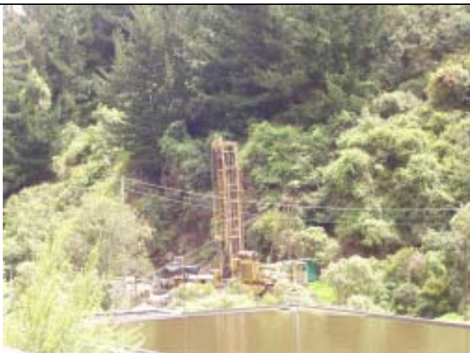
Vitelma 取水地における人工涵養パイロットスタディのための井戸掘削状況。この井戸はグアダルペ層の高い人工涵養能力を示した（900m 3 /日）。