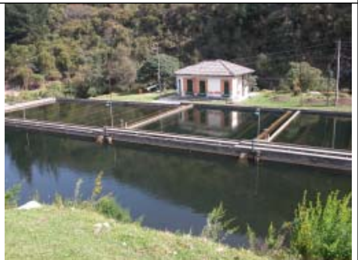
東部山地帯の Vitelma 取水地。この取水池はサンクリストバル川から取水している。本 M/P では、当取水池の周辺においてサンクリストバル川の河川水を利用した人工涵養事業を提案している。