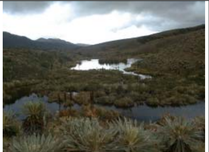
ボゴタ川の源流部。本調査域の最上流部に位置する。