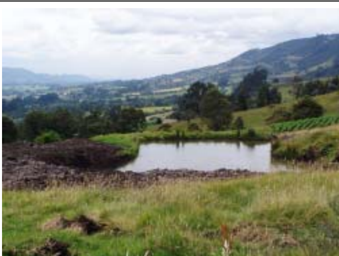
ボゴタ平原西部に位置するスバチョケ地域の風景。本 M/P では、ボゴタ平原中央部・西部地域における地下水保全事業（地下水人工涵養）を提案している。ボゴタ平原では農業用の溜め池が各地に分布し、表流水の利用が盛んである。