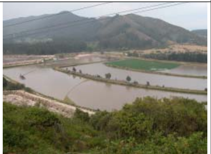
テイビトック浄水場。San Rafael 貯水池に次ぐ規模の給水源であり、ボゴタ市や近隣都市を給水対象としている。この浄水場ではボゴタ川の河川水が取水されているが、地下水の利用によって取水量を減らすことが可能である。