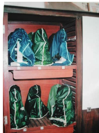
顕微鏡保管 (教室棟)