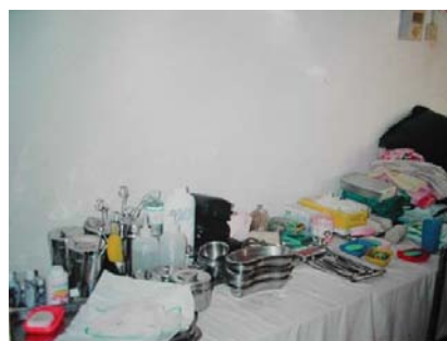
看護実習教材 (看護棟)