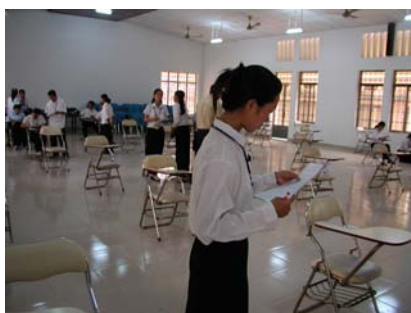
講堂 ( ADB )