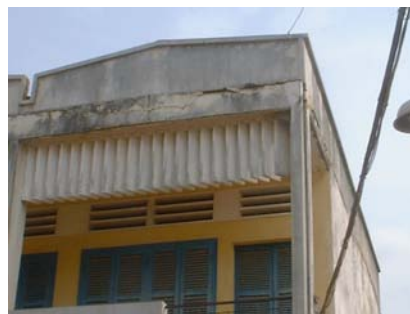
教室棟壁面老朽化