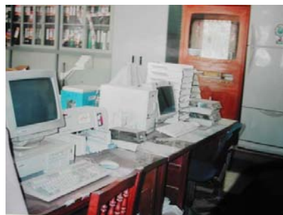
検査事務室・パソコン (教室棟)