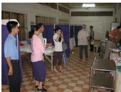
看護実習教材 (看護棟)