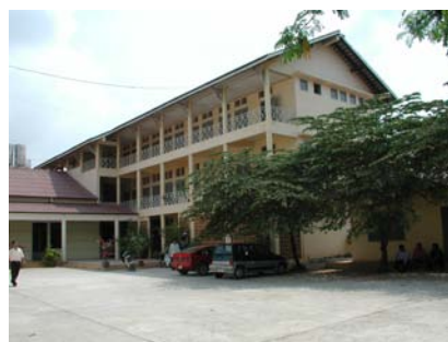
宿舎棟(ADB・看護実習に使用中)