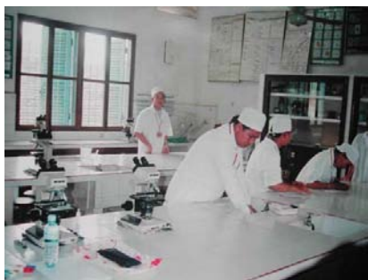
検査実習風景 (教室棟)