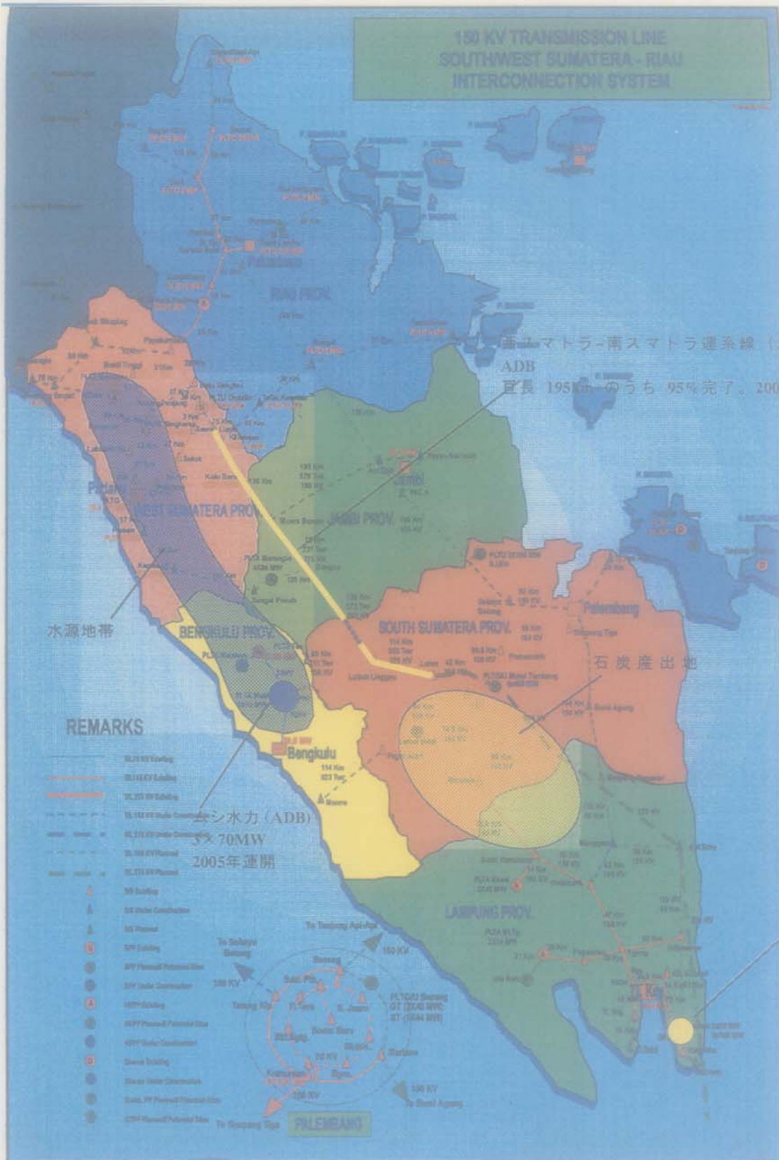
図3 南スマトラ系統図

(社団法人海外電力調査会「平成14年度インドネシア電力事情基礎調査報告書」より)