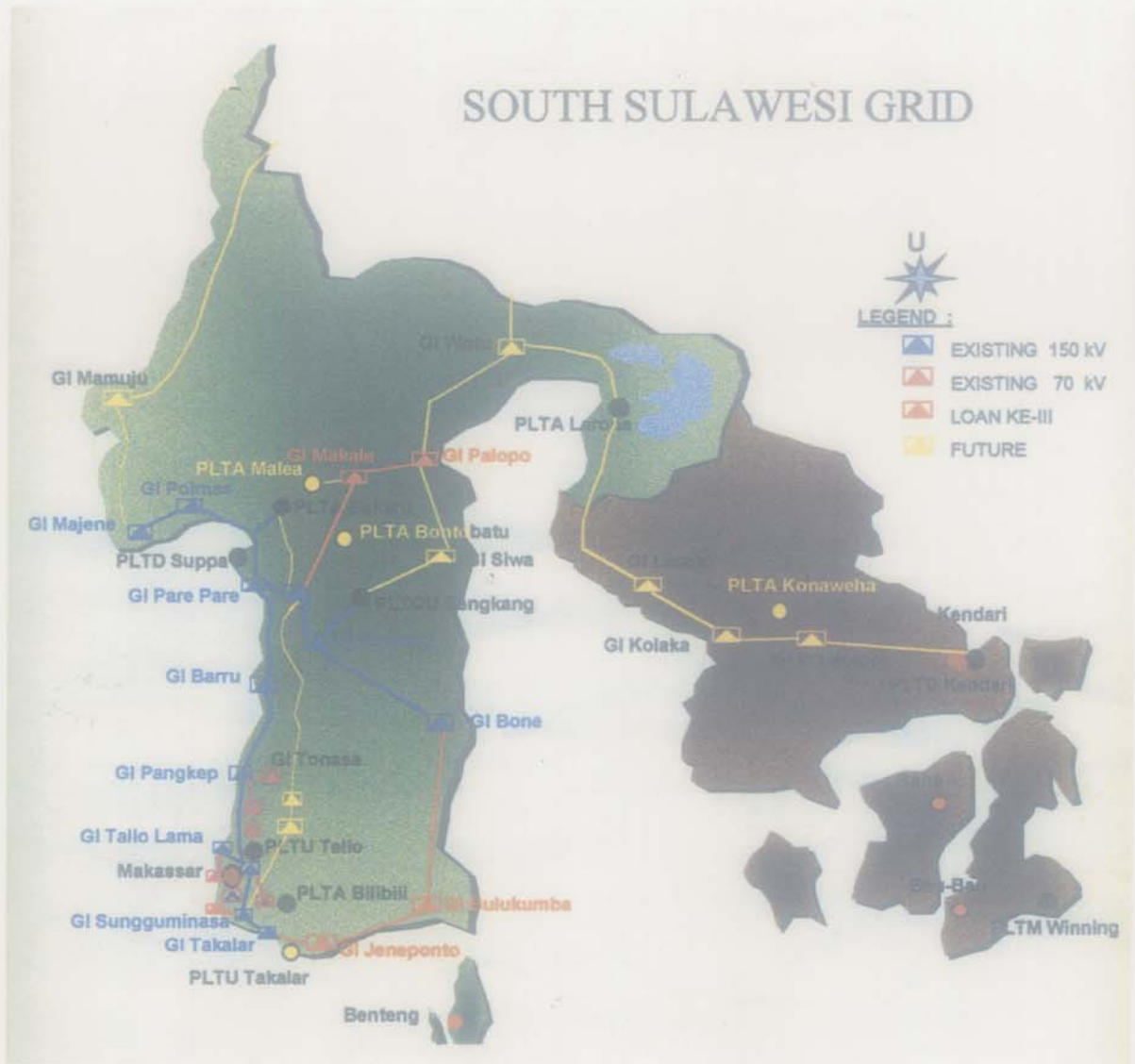
図4 南スラウェシ系統図

(社団法人海外電力調査会「平成14年度インドネシア電力事情基礎調査報告書」より)