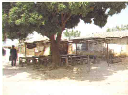
木の下に並べられた生徒用机