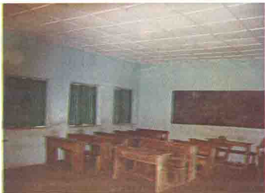
改修された教室内部