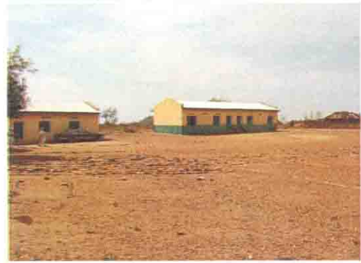
既存校舎の全景 (2001年改修済み)