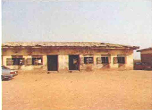
かなり老朽化している既存校舎