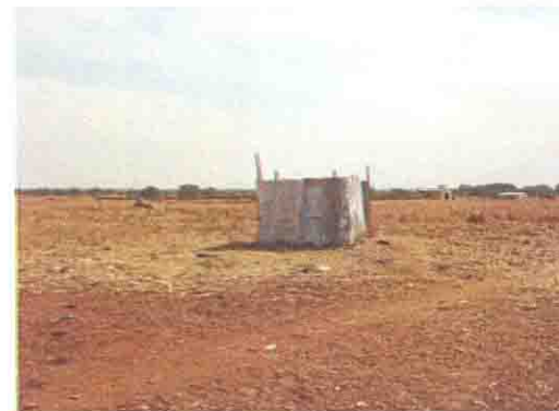
トタン板で囲われたトイレ