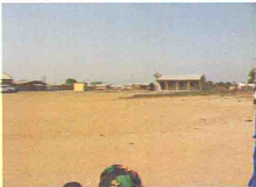
校庭とPTAの寄付により建設された校舎