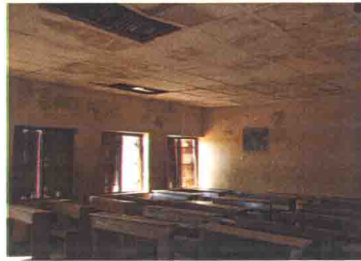
教室内部（天井が剥がれ、窓が壊れている）

Niger State: S/No. 6 S/Name: Wushishi Model L.G.A: Wushishi