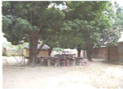
青空教室 1 (木の下教室)

Niger State: S/No. 9 S/Name: Rafin Karma L.G.A: K/Gora