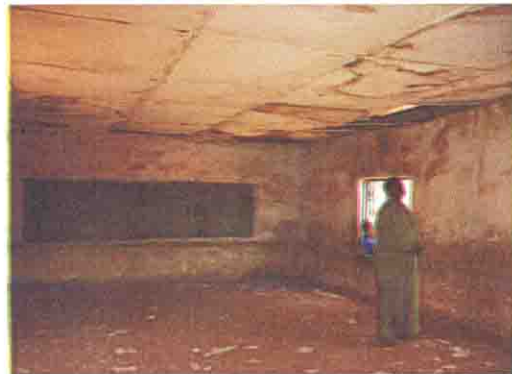
教室内部 (床が砂状になっている)