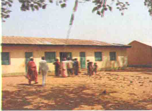
既存校舎の全景 (2001年改修済み)