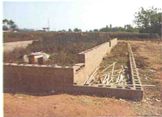
ブロック積みの基礎立上り