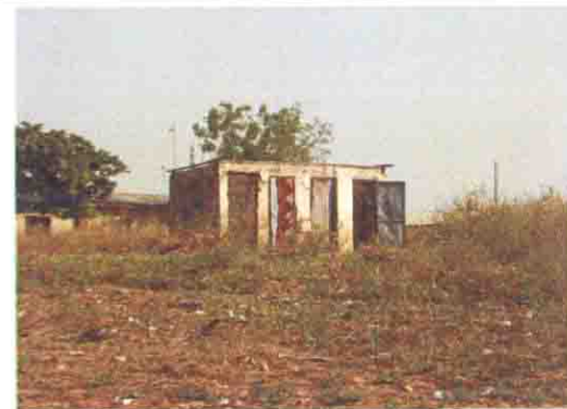
使用できない既存トイレ