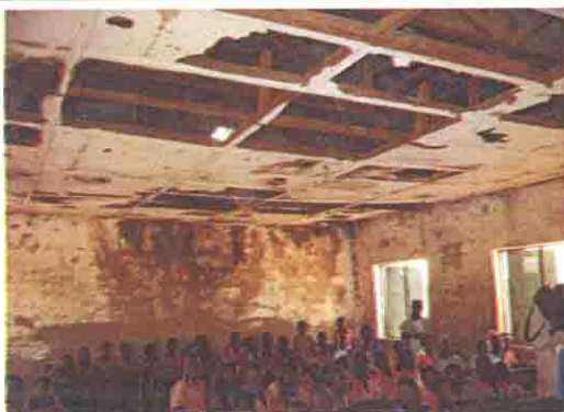
天井が剥がれ落ちている教室内部