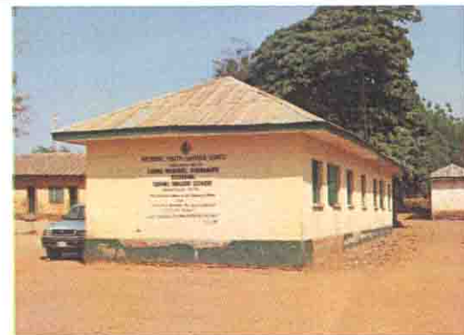
仮校舎として間借りしている学校