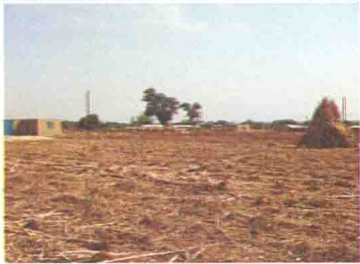
学校建設用の予定敷地

Niger State: S/No. 13 S/Name: Makafu UBE Prim. Sch. L.G.A: Gbako