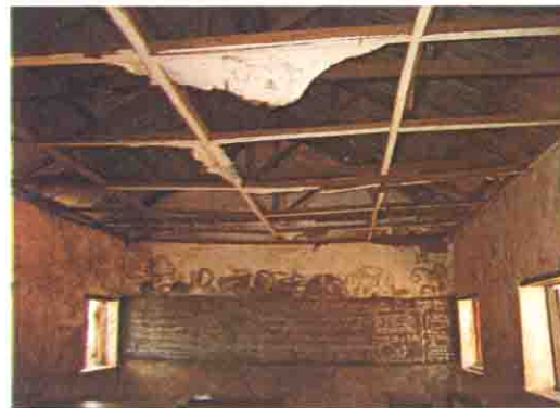
天井の下地材だけ残っている教室内部

Niger State: S/No. 9 S/Name: Rafin Karma L.G.A: K/Gora