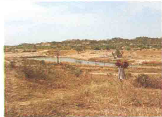
サイトの近くにあるダム (学校で飲み水に使用)

Niger State: S/No. 13 S/Name: Makafu UBE Prim. Sch. L.G.A: Gbako