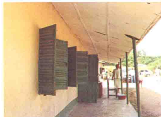
スチール窓のある外廊下