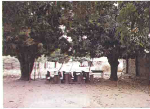
青空教室 2 (広場が住宅で囲まれている)