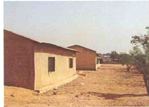
コミュニティにより建設された小さな校舎