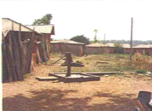
学校用地近くの地域住民の井戸