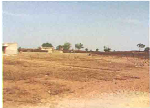
校庭とPTAにより建設中の基礎