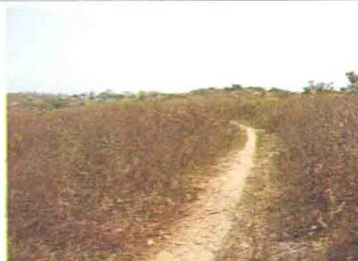
学校用地として確保されている敷地 (丘の最上部)