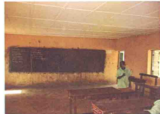
教室内部 (天井が改修されている)