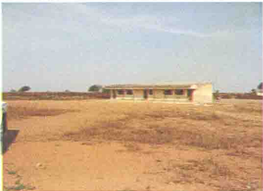
改修中の既存校舎（一部幼稚園で使用）

Niger State: S/No. 6 S/Name: Wushishi Model L.G.A: Wushishi