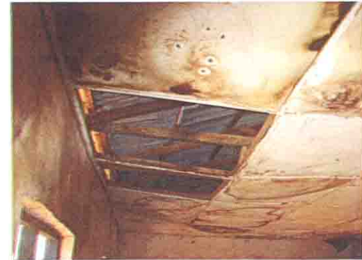
たわみ、剥がれた天井