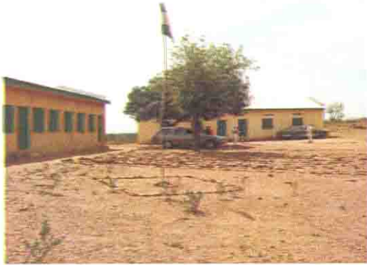
既存校舎の全景 (2001年改修済み)

Niger State: S/No. 11 S/Name: Rafin Mota L.G.A: Rijau