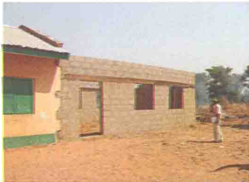
増築工事中の校舎