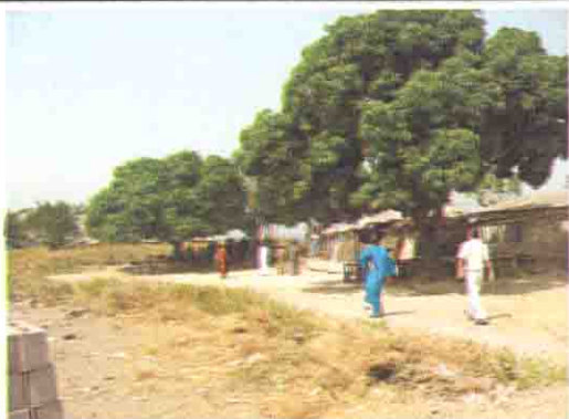
青空教室 (木の下教室)

Niger State: S/No. 15 S/Name: Tudunfulani Gabas L.G.A: Bosso