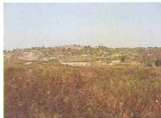
建設予定地からみえる給水用ダム

Niger State: S/No. 19 S/Name: Bangi Cent. L.G.A: Mariga