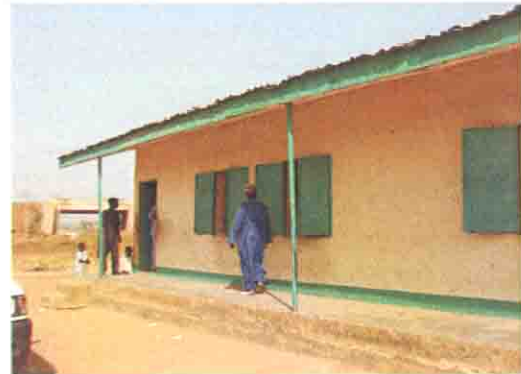
最近改修された校舎