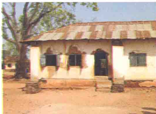
老朽化の激しい校舎