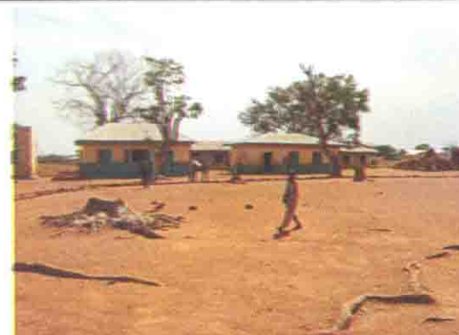
既存校舎の全景 (2001年改修済み)

Niger State: S/No. 19 S/Name: Bangi Cent. L.G.A: Mariga