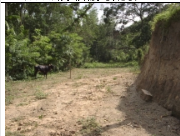
マリンバダ浄水場（汚泥処理施設）