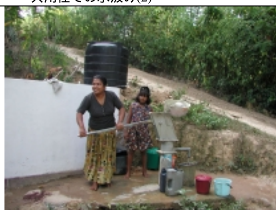
手押しポンプによる水汲み