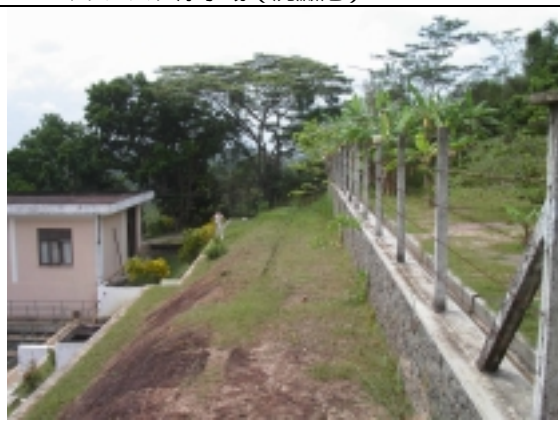
マリンバダ浄水場（薬品棟予定地）