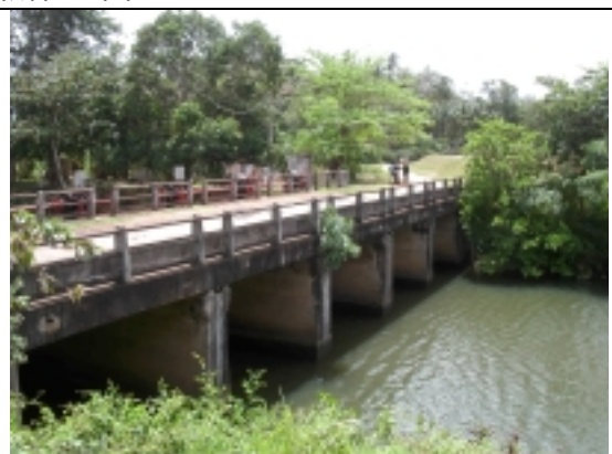
橋梁添加 (4)排水ゲート橋