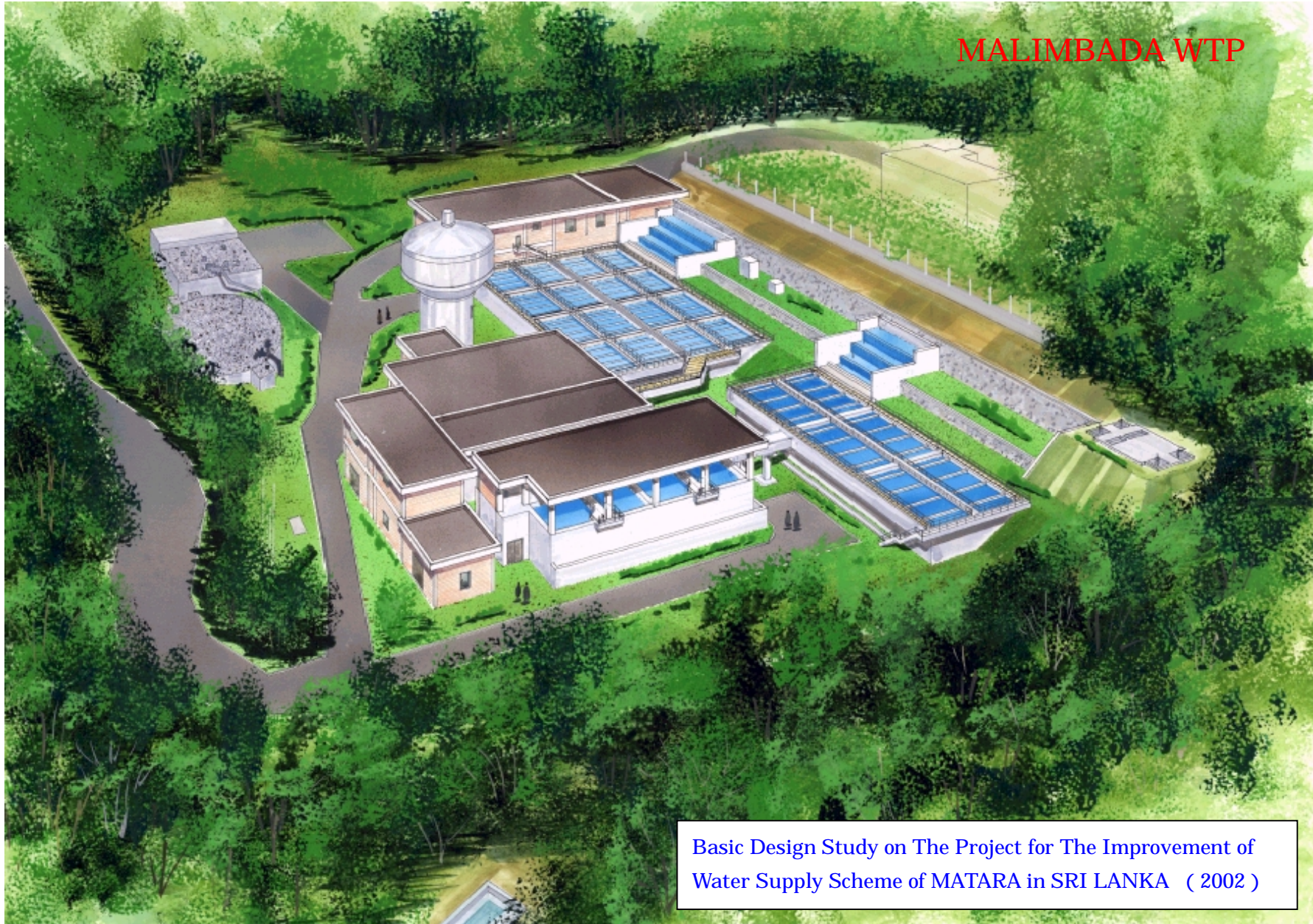
Basic Design Study on The Project for The Improvement of Water Supply Scheme of MATARA in SRI LANKA ( 2002 )