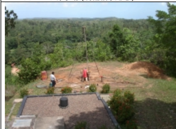
マリンバダ浄水場（配水地予定地）