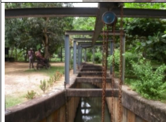
カドゥワ取水場（沈砂池予定地）