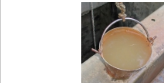
汲み上げられた井戸水