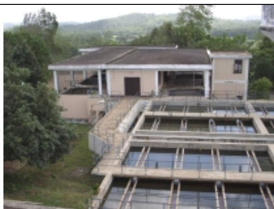
マリンバダ浄水場（沈澱池）