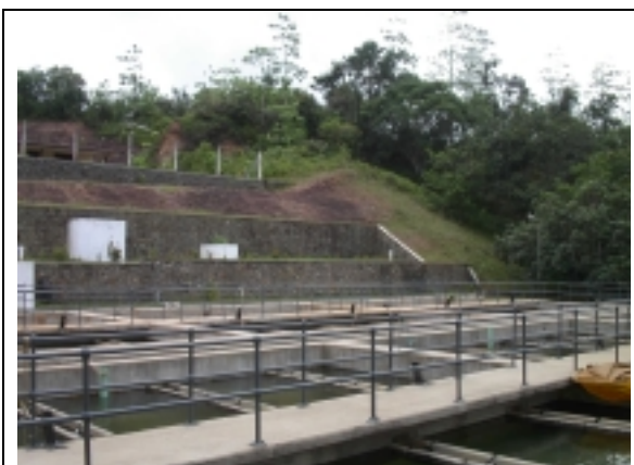
マリンバダ浄水場（分配槽予定地）