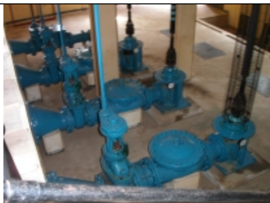
カドゥワ取水場（ポンプ交換予定地）