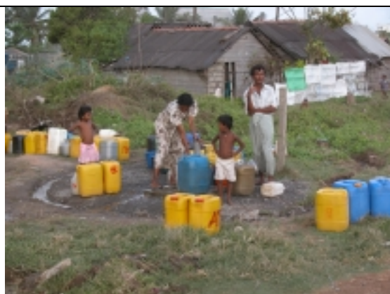
共用栓での水汲み(2)