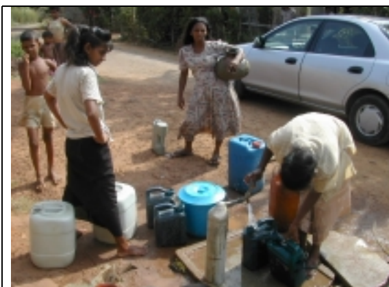
共用栓での水汲み(1)