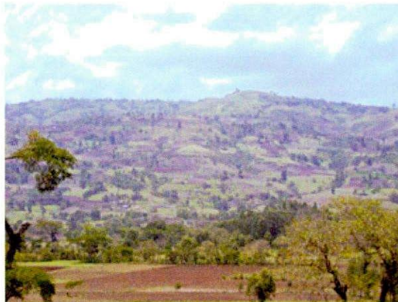
セカワレダ農地風景