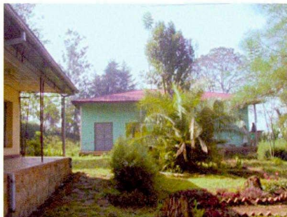
ジンマゾーン事務所 (左：農業局、正面： 自然資源開発環境保 護局 (NRDEPA))