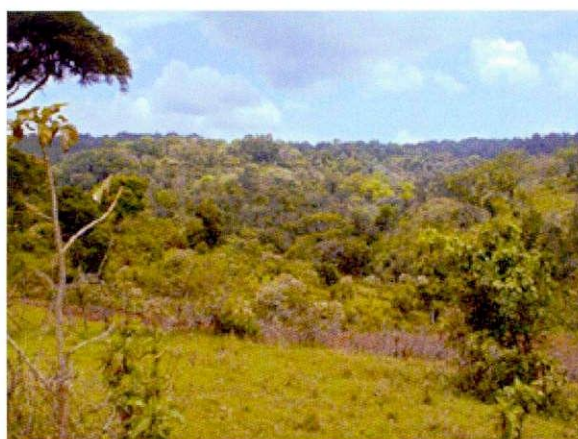
天然林遠望 (Gera forest)