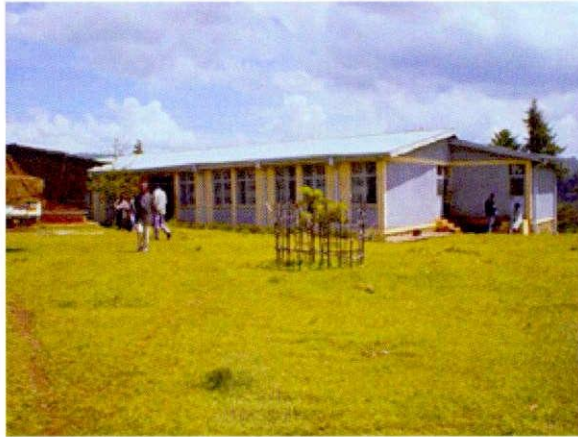
ゲラワレダ自然資源 開発・環境保護局 (NRDEPA)事務所