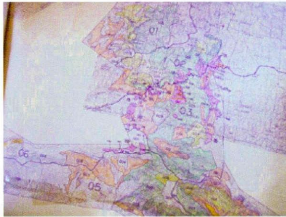
Belete-Gera-forest 土地利用/植生図 (開発調査「エティオ ピア国南西部地域森 林保全計画調査」にて 作成したもの)