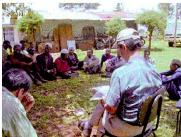
ゲラワレダにて農民へのインタビュー