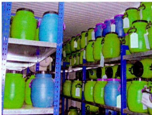
森林研究所 (FRI) 種子貯蔵庫 (アディスアベバ)