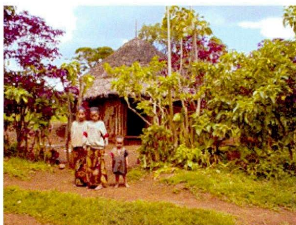
Gera forest 周辺農家