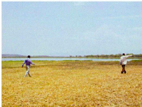
ガンベラ州湿地帯 風景