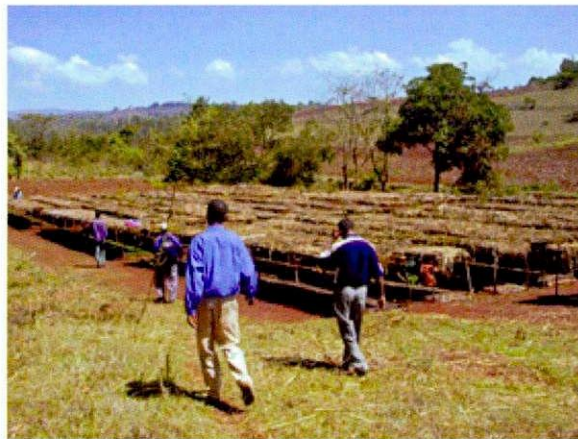
セカワレダの苗畑 (自然資源開発・環境 保護局 (NRDEPA) セカ ワレダ事務所管理)