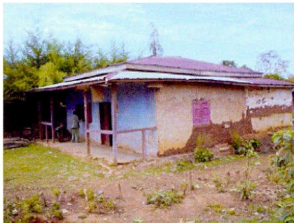
セカワレダ自然資源 開発・環境保護局 (NRDEPA)事務所