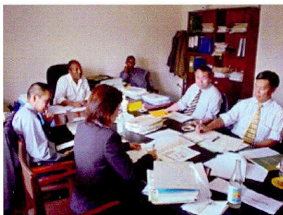
オロミア州自然資源開発環境保護庁 (ONRDEPA) にて協議