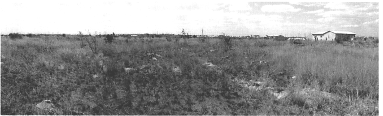
7. チレンジェ サウス