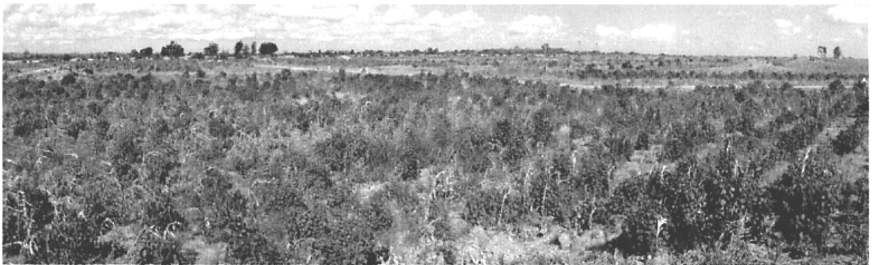
11. マラポディ/マンデヴ