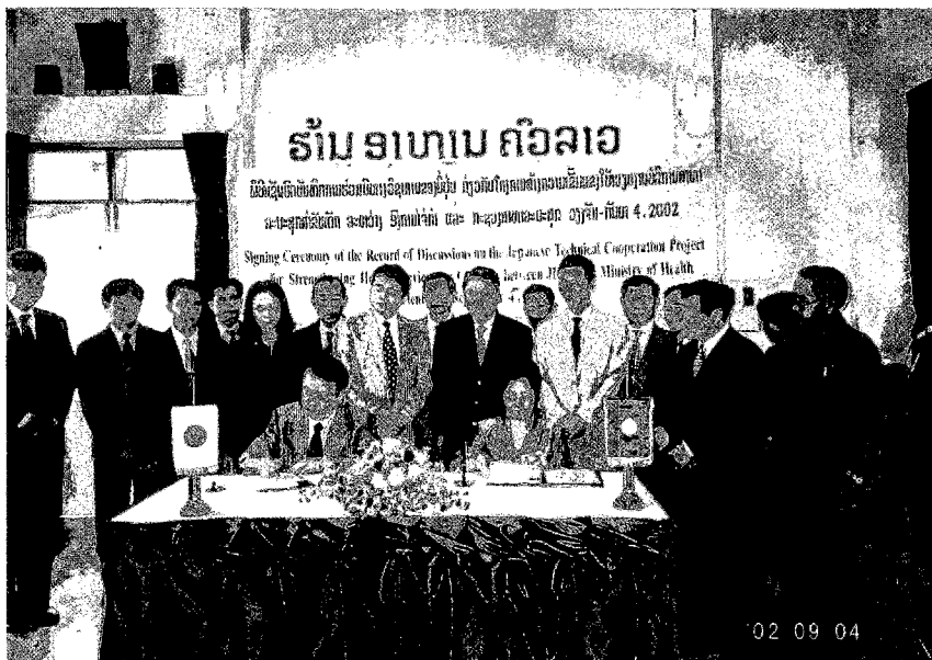
討議議事録(R/D)及び ミニッツ署名式