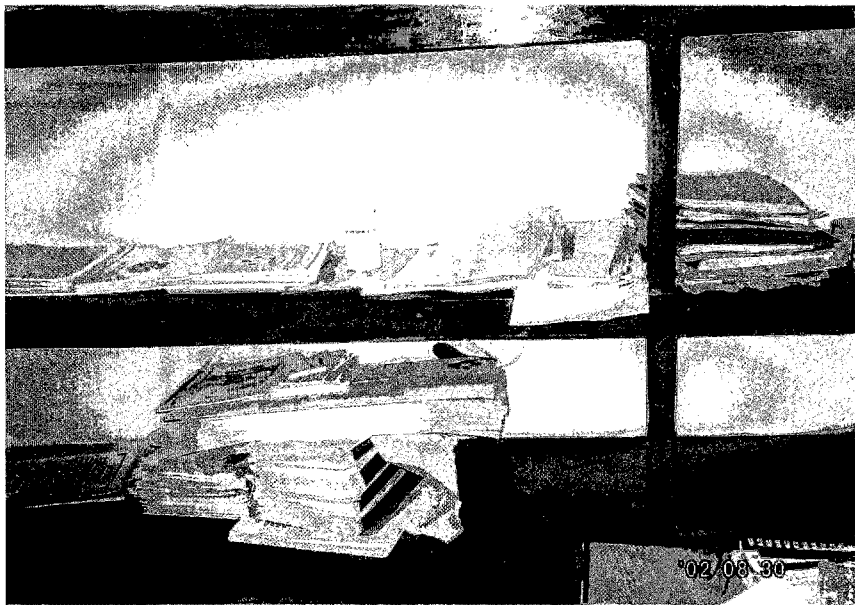
ウドムサイ県・郡病院に積まれた まま、ヘルスセンターへは未配布と なっているパンフレット等