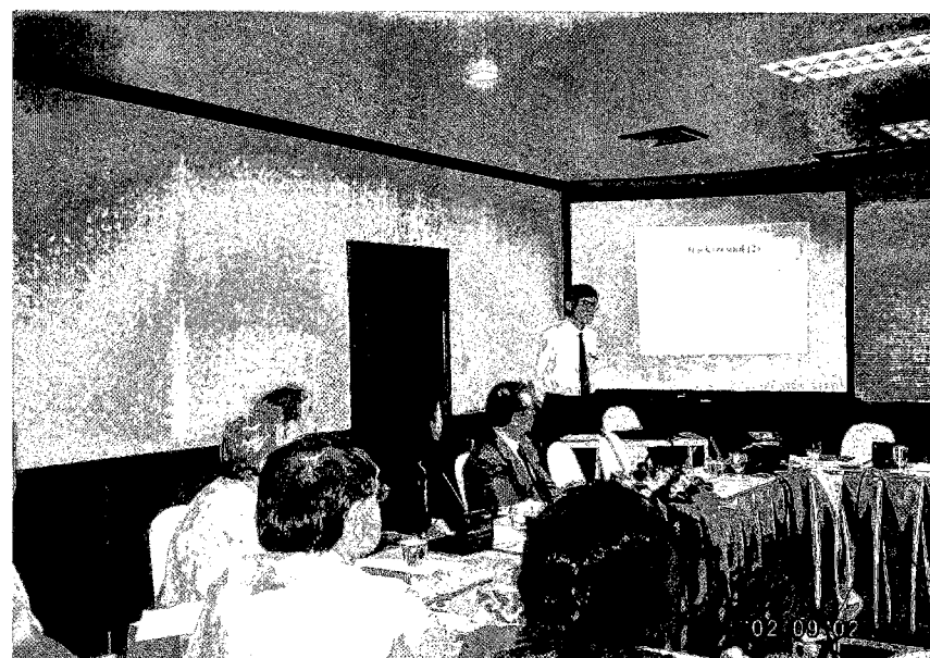
他ドナーへのプレゼンテーション (プロジェクト概要説明)