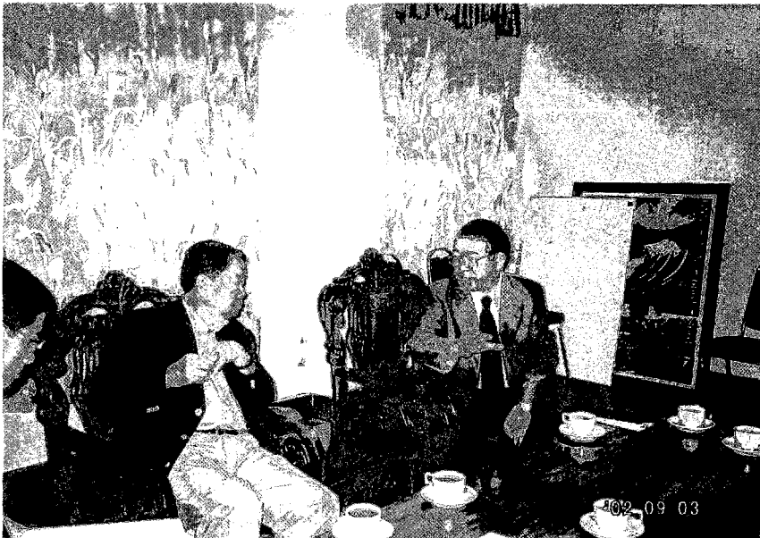
保健大臣との協議