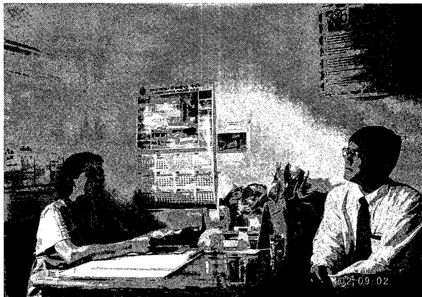
ヴィエンチャン県・ヘルスセンター 職員へのインタビュー