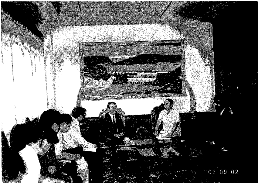
ヴィエンチャン県知事との協議