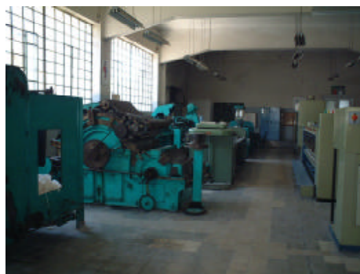
6.紡績学科 既存機材(1950年製)