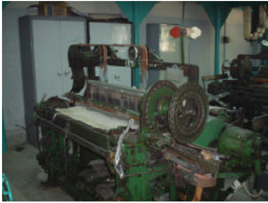
9.製布学科 既存機材 (1950年製)