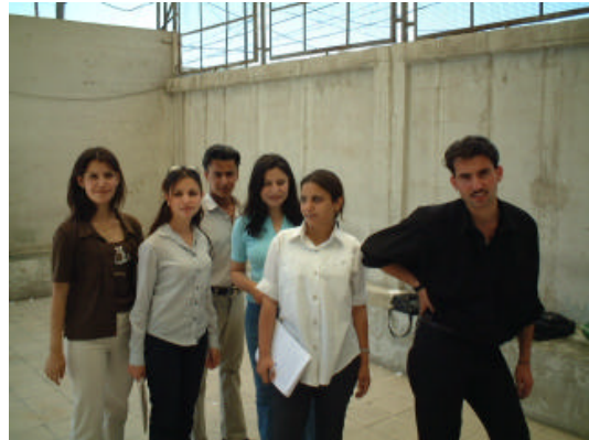
12.学生たち (学期試験中)