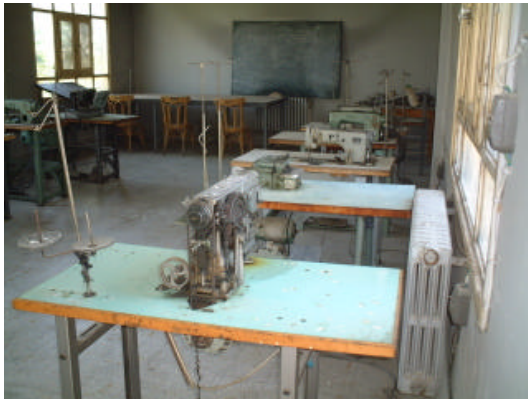
11.服装学科 実習場風景