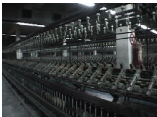
16.近代化のため廃棄される紡績機 (国営企業)