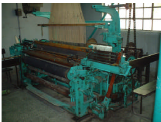
7.製布学科 既存機材(1930年製)