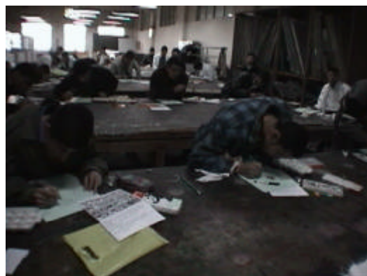
4.実習風景 (染色学科)