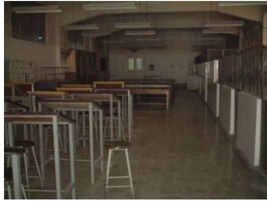
10.染色学科 実習場風景