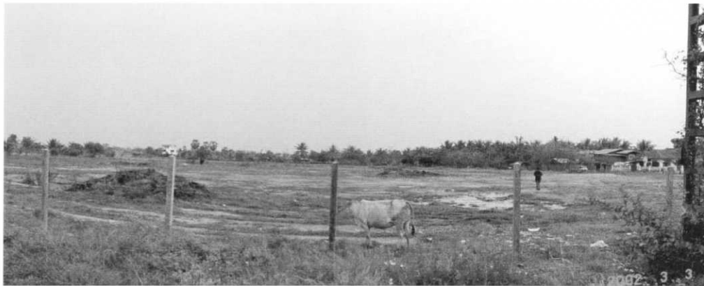
国道13号線の歩道よりサイト東側を望む。