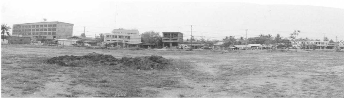
サイト中央から国道13号線を望む。左側の建物は建設中のトヨタショールーム。