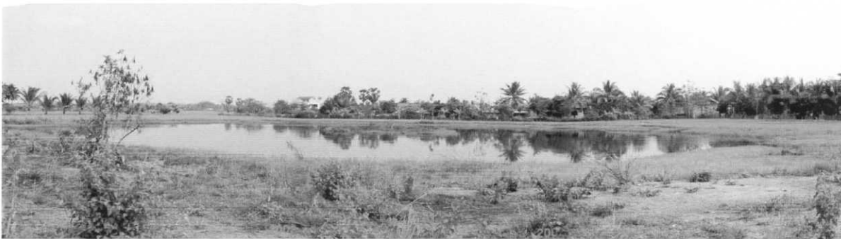
サイト中央から東側の池を望む。