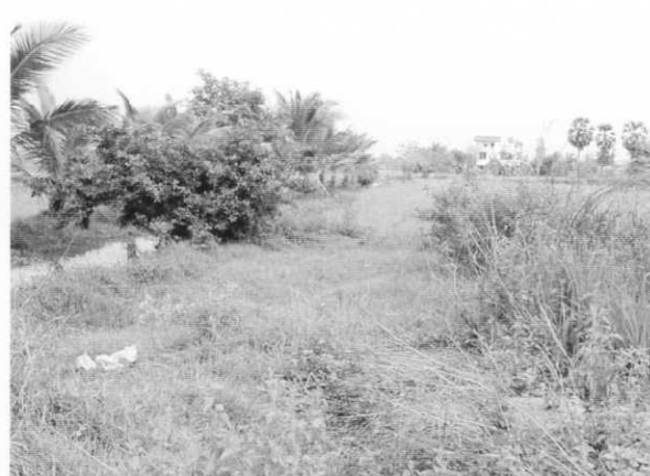
北側境界の運河を望む。