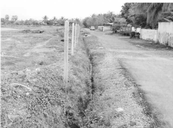
南側境界にある未舗装道路と排水溝。