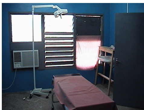
全景 婦人科手術室