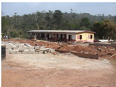
全景 (病棟建築現場)