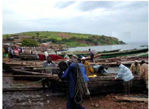
■同カトンカ水揚場における水揚げ風景。