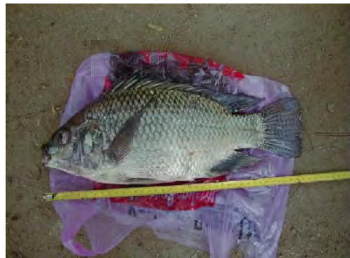
■ビクトリア湖のナイルパーチ同様移入種であるティラピア ( Oreochromis niloticus )。ただし現在では国民の重要な食用として輸出が禁止されている。