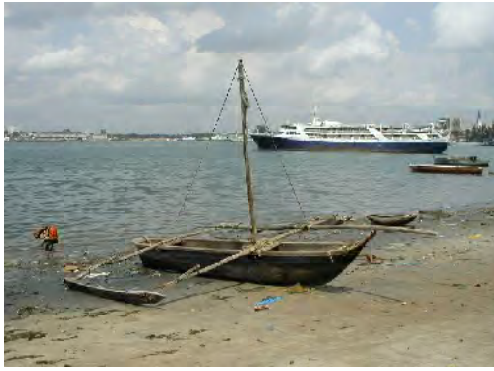
■ガラワと呼ばれるアウトリガーを装備したカヌー。通常は帆走で走行。