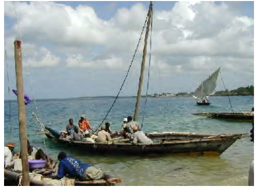
■ダウ。キール、肋材、外板からなる木造ボートで、長さは 6-10 m。マストとヤード、三角セーラー及び舵を装備し、通常は帆走で走行。