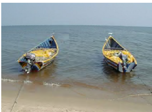
■ナイルパーチ刺網漁船。25-40HPの船外機を装填する。