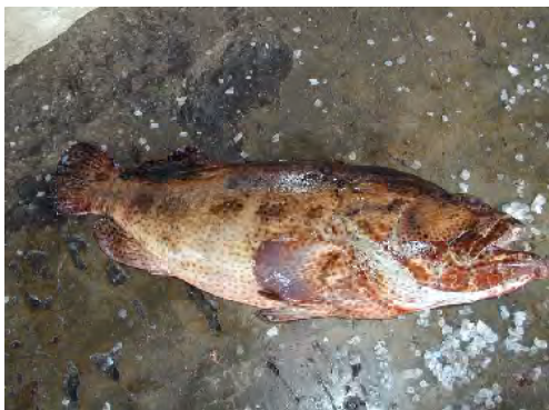
■ダルエスサラーム、バンダビーチに水揚げされたハタの一種。高級魚としてレストラン等で消費されるが、輸出はされない。