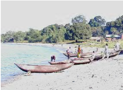
■ダグアウトカヌー。船外機、帆は用いられず、動力はパドルによる手漕ぎ。材料となる木によって耐久性が異なる。