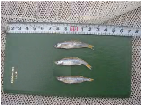
■ダガー・ムワンザ ( Rastineobola argentea ) は他のダガーと異なりコイ科に属する。味に苦味を含むため嗜好性が低く、調理の際に頭部、腹部を除去するケースが多い。このような嗜好性による食用需要への影響は無視できないものがある。 [ビクトリア湖産]