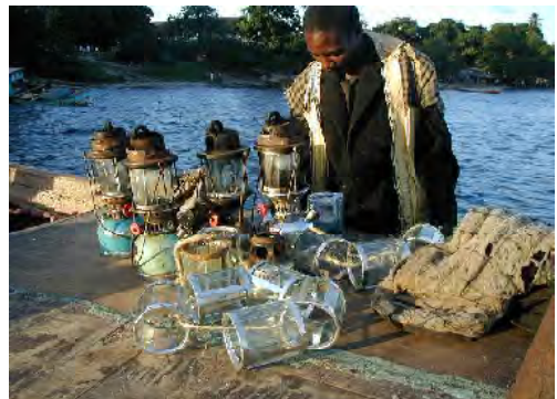
■ダガー漁に用いるライト。沿岸から湖まで広く、ケロシンランプが使われる。光力が集魚の時間に大きく影響することから電灯、水中灯及び反射板の改良などが本計画で検討されている。