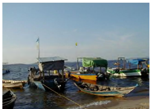
■ンコメ水揚浜での漁船係留風景。