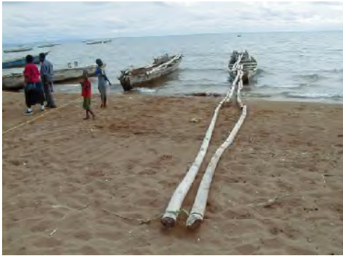
■リフトネットを用いたダガー漁に用いられるカタマランボート。魚場では手前にみられる木の棒で2隻の船をつなぎ、灯火による集漁業を行う。