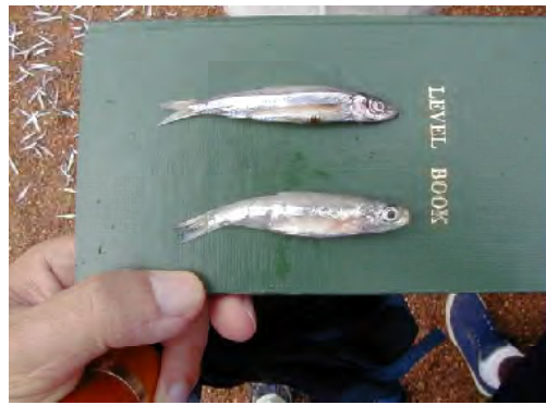
■タンガニーカ湖で水揚げされるダガー・キゴマ ( S. tanganyicae )。ダガー・ムワンザに比べ嗜好性は高い。日干しされたものがタンザニア全国に流通される。