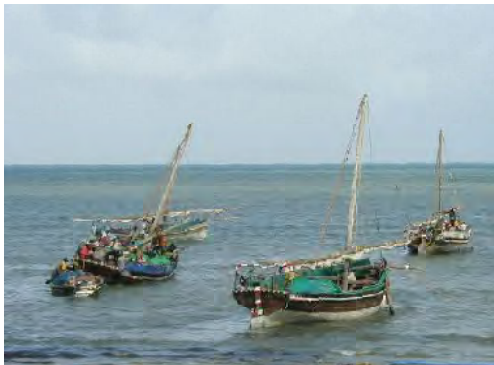
■マシュアと呼ばれるキール、肋材、外板からなる木造ボート。ダウと同様な帆走装置を有し、帆走で走行するが、トランサムに船外機を装備するものもある。マフィア島にて。