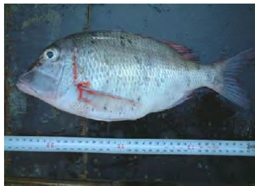
■インド洋沿岸で多獲されるフェダイ ( Lutjanidae )。価格は Tsh.1,500 - 2,000/kg と牛肉の Tsh.800 - 1,000/kg を上回っている。