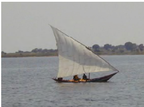
■帆を利用した小型カヌー。ティラピアの大半はこのような小型漁船で漁獲される。