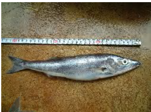
■タンガニーカ湖産スズキの一種であるミゲブカ ( Luciolates stappersii )。タンガニーカ湖で生産される重要経済種。ダガー漁の灯下に集まり、同様にリフトネットで捕獲される。