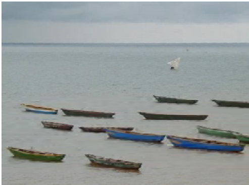
■カトンカ水揚場におけるダガー漁船の係留風景。