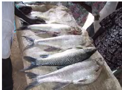
■キエラ (ニアサ湖) の魚市場に並び Mbasa ( Barilius microlepis ) と Labeo。Mbasa はレイク・サーモンと呼ばれる湖で代表的な大型経済魚種。