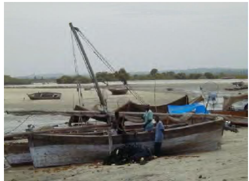
■同じくマシュア。クンスチにて。