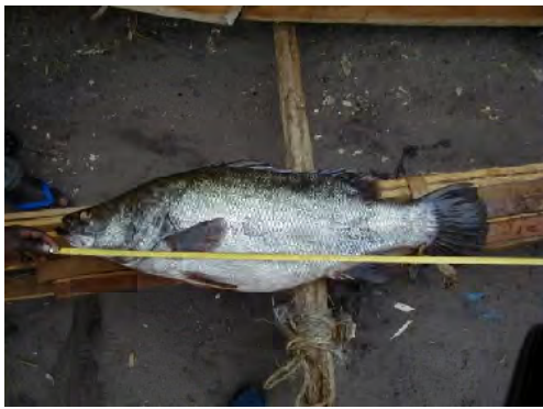
■タンザニア国総水揚げの約 40% を占める ナイルパーチ [ビクトリア湖産] ( Lates niloticus )。輸出では 90% を占める。