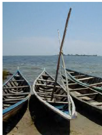
■同左。船外機をつけた漁船を母船とし、このような無動力ボートを5-10隻、魚場まで曳航する。