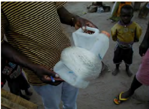
■ビクトリア湖。刺網。最小目合は5インチであるが、同サイズでは多くの未成熟魚を捕らえている。