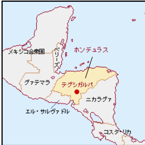
図1 ホンデュラス位置図