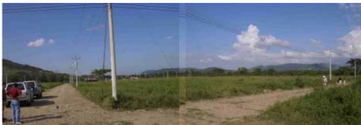
ヴィジャヌエバ敷地全景(前面道路より)