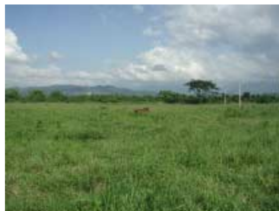
ヴィジャヌエバ敷地