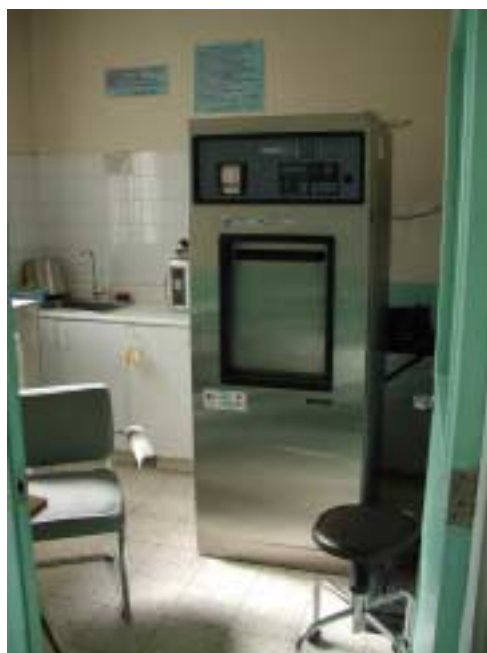
エル・シチオ救急クリニック