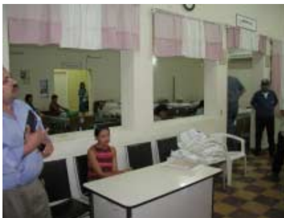
入院受付・会計 後方は産褥室