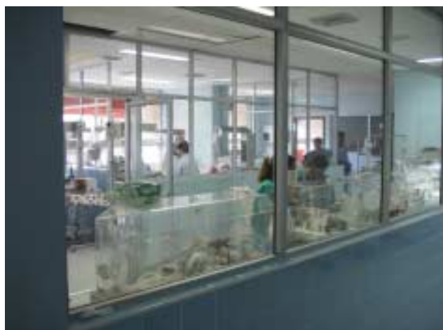
マリオ・カタリノ・リバス国立病院 NICU 室