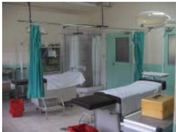
エル・シチオ救急クリニック