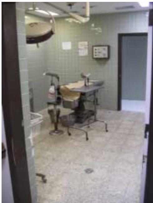
マリオ・カタリノ・リバス国立病院 分娩室