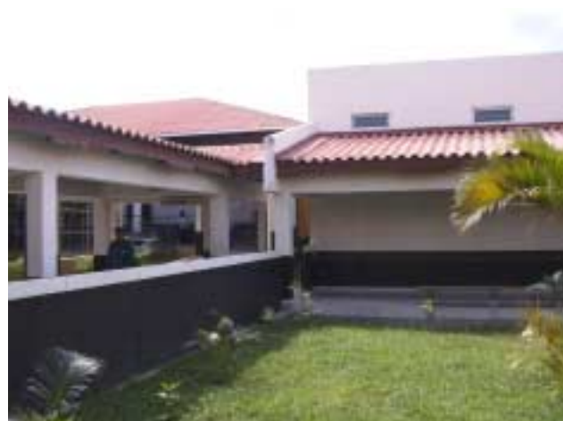
サン・フェリーペ国立病院 中庭