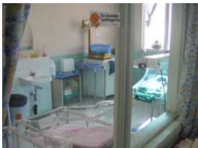
サン・フェリーペ国立病院 NICU