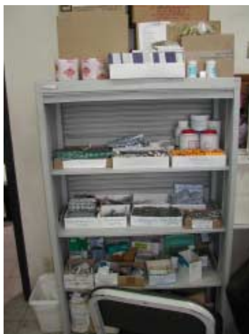
エル・シチオ救急クリニック