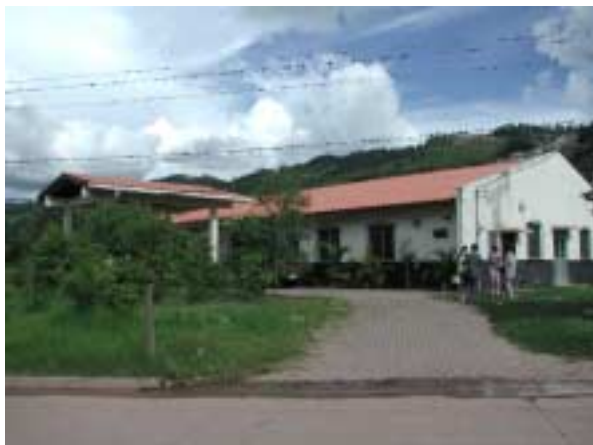
エル・シチオ救急クリニック