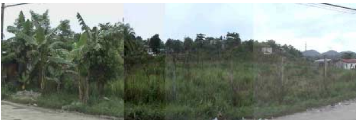
チョロマ敷地全景(前面道路より)