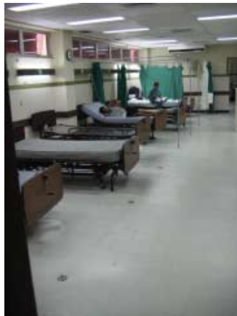
マリオ・カタリノ・リバス国立病院 陣痛室