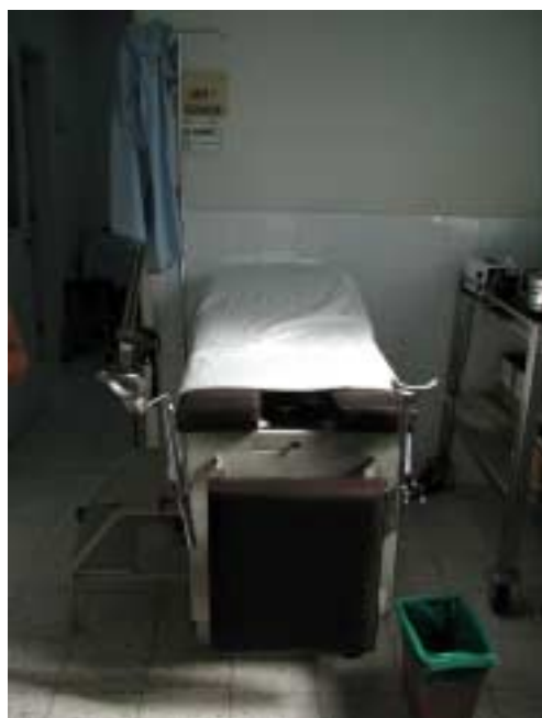
エル・シチオ救急クリニック