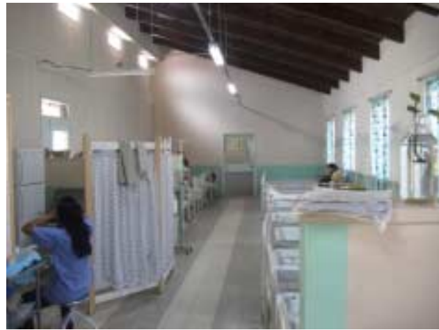
サン・フェリーペ国立病院 産褥室