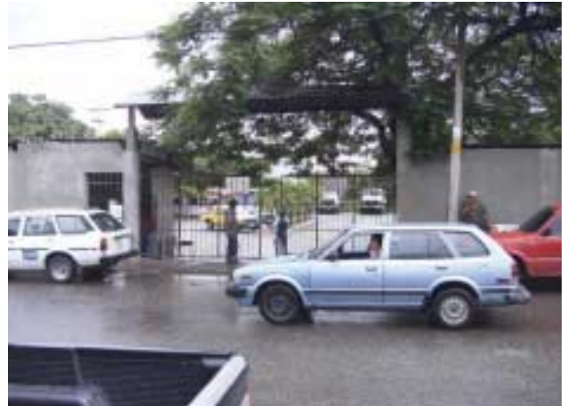
主出入口(西側道路より東方向を撮影)