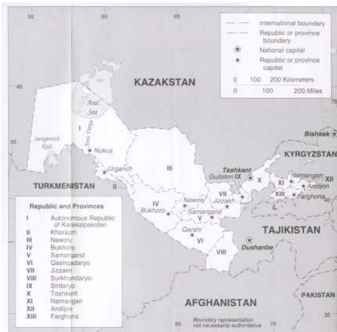
Figure 13. Uzbekistan: Administrative Divisions, 1996