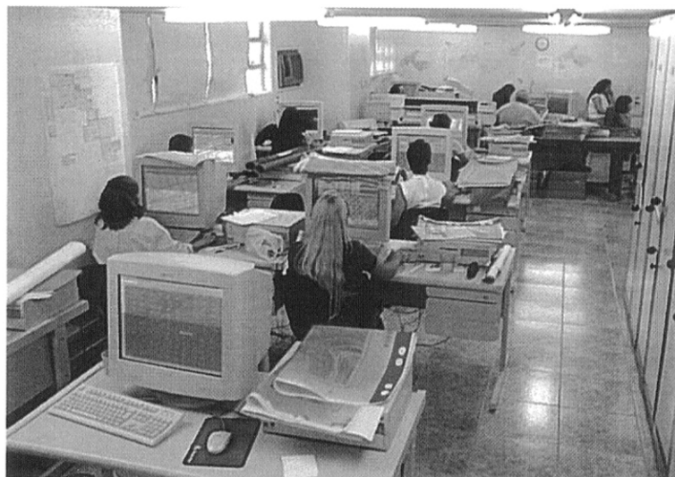
写真8 CEDAE上下水道台帳のデジタル化