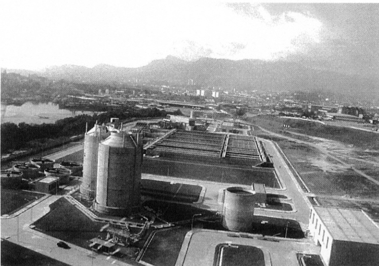
写真 6 上空から撮影したアレグリア処理場