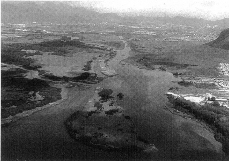
写真 5 水がよどみ腐敗している河川