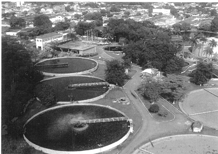
写真7 上空から撮影したペーニャ処理場