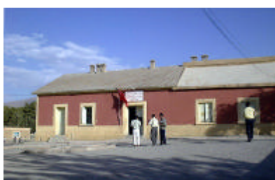
トゥネフィット保健センター外観 独立産室を建設する。