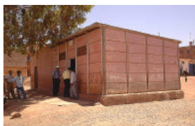
ウマナ診療所外観 CSCAを独立して建設し、DRを 格上げする。