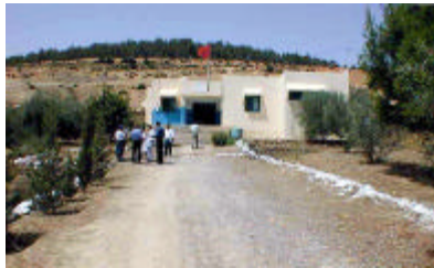
アドレジ保健センター外観 既存敷地内に産室を増築する。