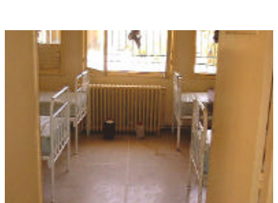
ミデルト ポリクリニック病室