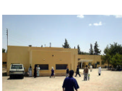
ミデルト ポリクリニック外観 独立産室を建設する。