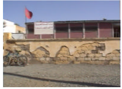
ムリルト保健センター 既存を撤去し、独立産院を建設する。