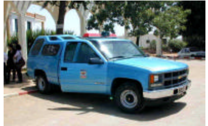
USAID供与による巡回車(シボレー) セフル保健局にて