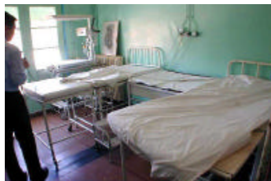
アズル-8月20日ポリクリニック 分娩室