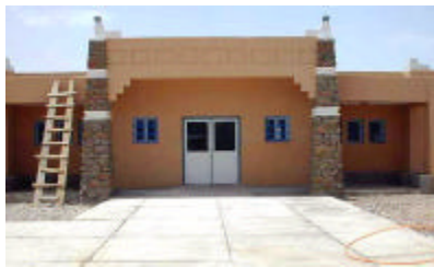
フム・ズギッド地域病院 独立産院を建設する。