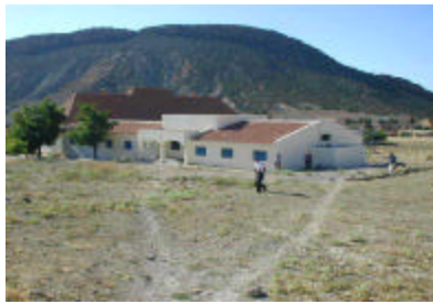
ブルマン地域病院 産院を建設する。