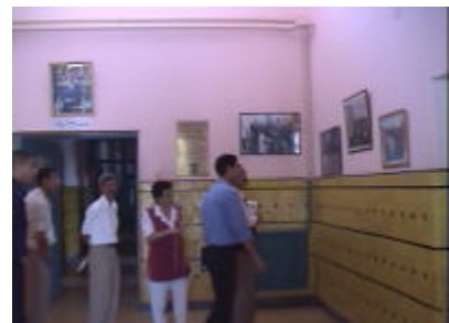
イブン・アル・カイイ 県病院産婦人科 USAIDにより改修された