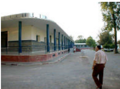
アルガッサニ県病院外観 産科、臨床検査機材の供与を行う。