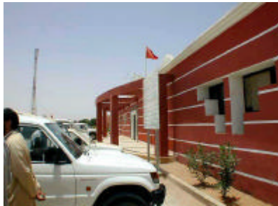
グルミン県病院外観 手術棟を増築する。