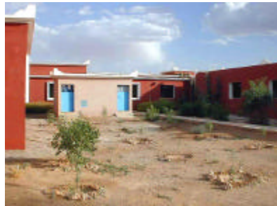
グルミン県病院手術棟増築スペース