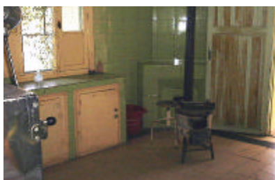
トゥネフィット保健センター処置室 石炭ストーブが仕様されている。