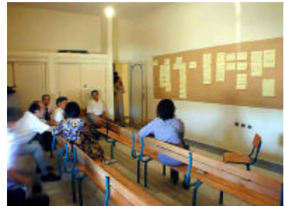
ワークショップ風景(PCM) (グルミン県病院にて)