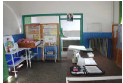
ブルマン地域病院(母子保健室)