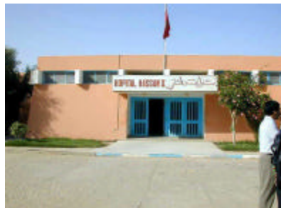
タンタンハッサン2世病院 手術棟を増築する。