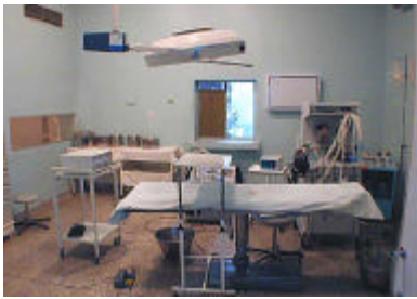
マルシュ・ベル県病院(手術室)