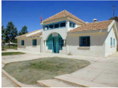
イフラン保健センター外観 既存に接して産室を造築し、地域 病院より参加を移設する。