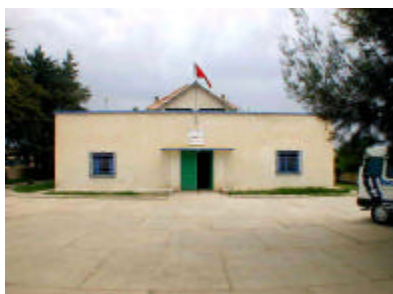
リバト保健センター外観 既存敷地内に産院を建設する。