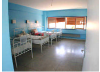
マルシュ・ベル県病院(産婦人科回復室) 臨床検査機材のみの供与を行う。