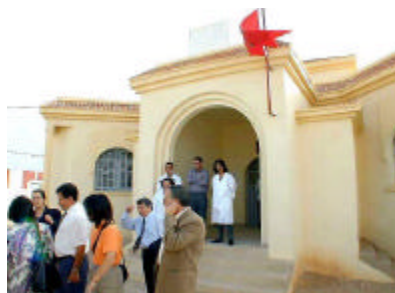
ミスール クアット・ブ' Qアア保健センター