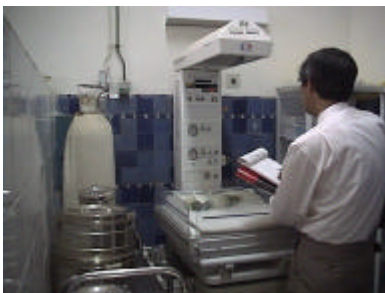
イブン・アル・カイイ 県病院産婦人科待 合いUSAID供与のインファントウォーマー