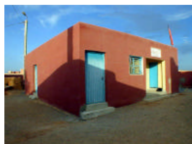
ファスク保健センター 既存敷地内にCSCAを建設する。