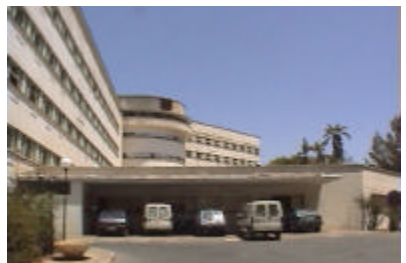
モハメド5世州病院外観 臨床検査機材のみ供与を行う。