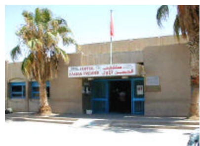
ティズニット病院