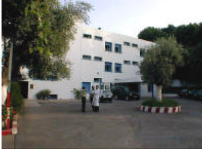
モハメド5世県病院（病棟北外観） 手術棟の増築を建物端部に行う。