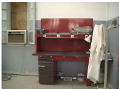
フェズ州メンテナンス・ワークショップ ワークショップ・テーブル