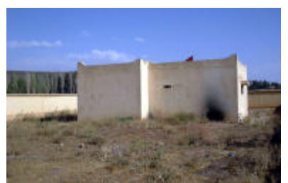
ブミア保健センター増築予定地 敷地内に独立産室を建設する。