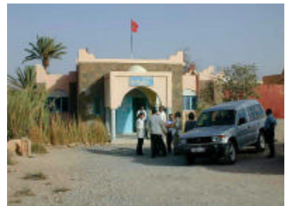
イフラン・グルミン保健センター 独立産室を建設する。