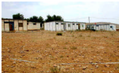
アユンスナン診療所外観 プレアブ' 宿舎の撤去後CSCAの建設。