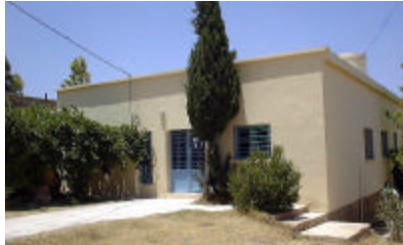
スクラ保健センター 既存敷地内に産室を建設する。