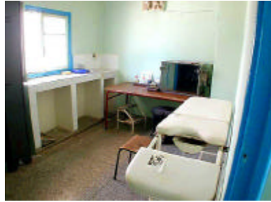
イフラン保健センター処置室