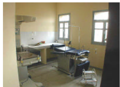
クアット・ブ' Qアア保健センター分娩室