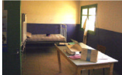
スクラ保健センター(内診室)