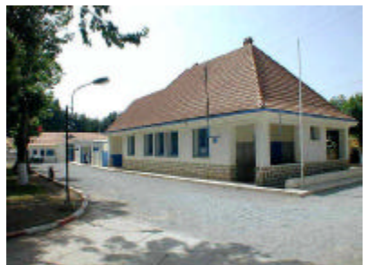
イムゼ保健センター外観 既存施設の横に産院を建設する。