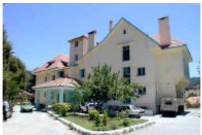
アズル-8月20日ポリクリニック外観 産科、臨床検査機材の供与を行う。