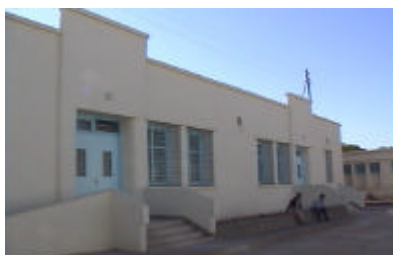
シディ・サイド州病院産婦人科 産婦人科は新設であり、産科、 検査機材を供与する。