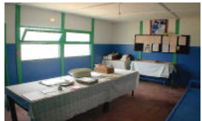
アユンスナン診療所(家族計画室)