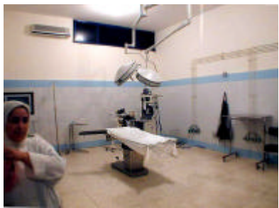
アルガッサニ県病院（手術室）