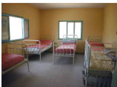
イフラン・グルミン保健センター 病室