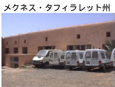
ケニフラ県病院、救急車 産科、臨床検査機材の供与を行う。