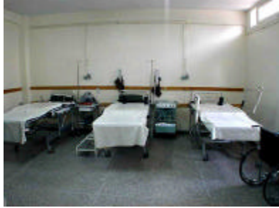
モハメド5世県病院（分娩室）