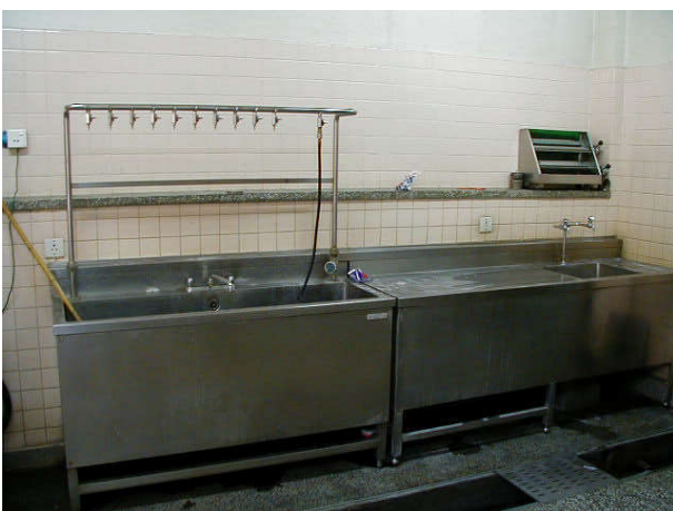
手術器具洗浄装置