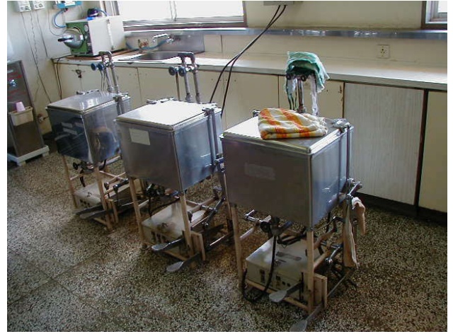
煮沸消毒器 (1台のみ架動)