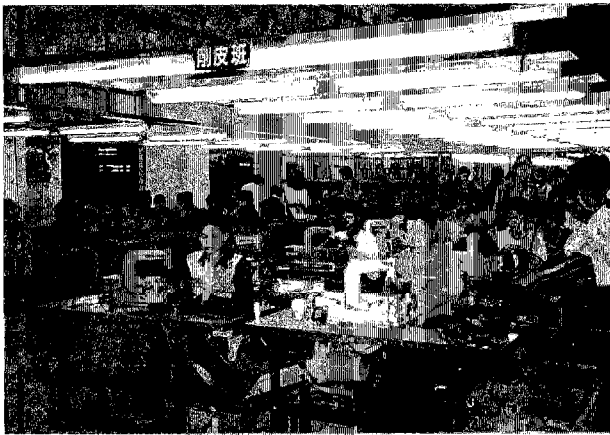
シハヌークヴィル製靴工場 (台湾資本)