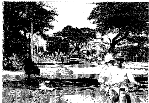
国道4号線 カンボンスプー付近