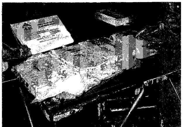
シハヌークヴィル 輸出用加工済み冷凍エビ