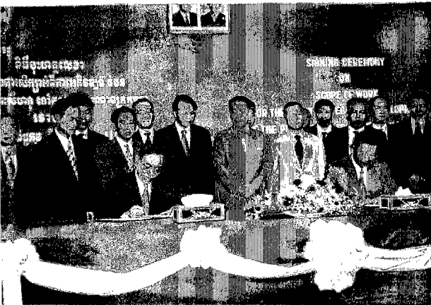
S/W、M/M 署名式 左より小山団長、Cham Prasidh 大臣