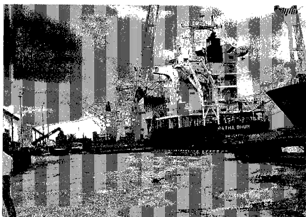
シアヌークヴィル港 岸壁は未舗装