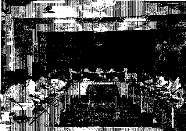
ステアリング・コミッティ 右側：関係省庁 左側：調査団