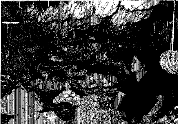
シハヌークヴィル市場 輸入品の果物が並ぶ