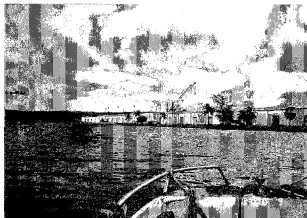
シハヌークヴィル港 コンテナを扱う