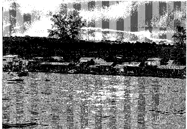
シハヌークヴィル港西側の漁港 FTZ 候補地 住居が並ぶ