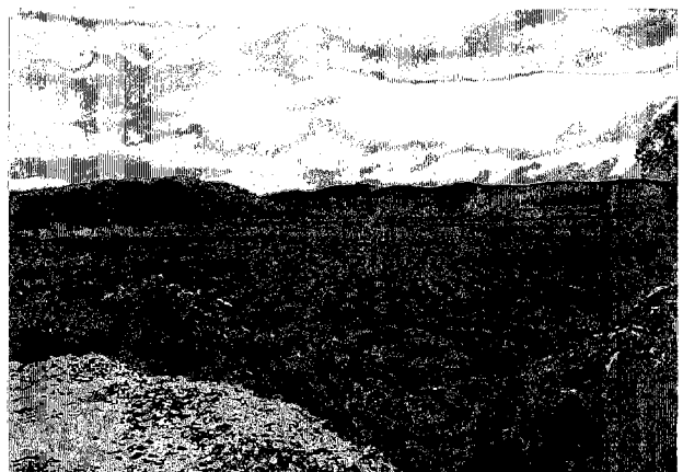
パーム椰子のプランテーション カンボンスプー