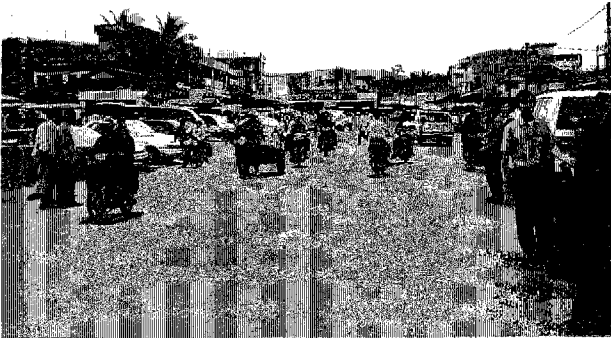
シハヌークヴィル市内