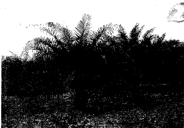
パーム椰子 1997年に植えられたもの