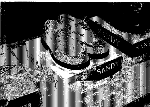
シハヌークヴィル製靴工場 最終製品 (日本向け)