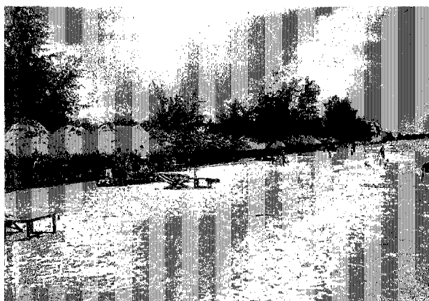
シハヌークヴィル砂浜 オーチャビル・ビーチ 海の家が並ぶ