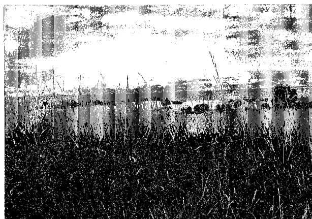
シハヌークヴィルEPZ候補地 端に位置するshellのタンク