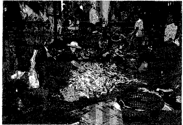
シハヌークヴィル市場