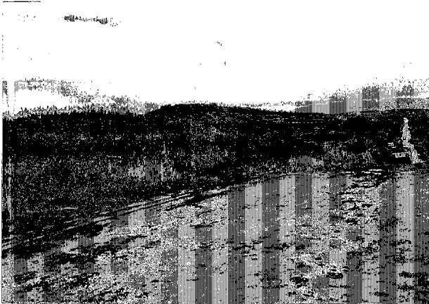
シハヌークヴィルEPZ 候補地