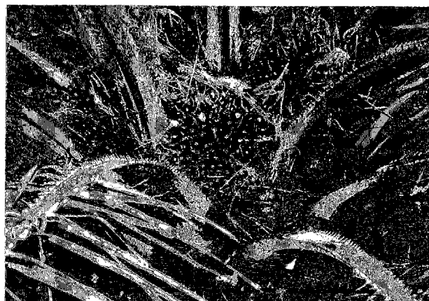
パーム椰子の実 根元付近に根を付ける