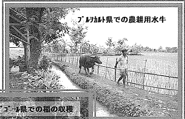
ブカバ県での農耕用水牛