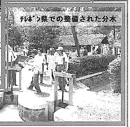
チベリ県での整備された分水