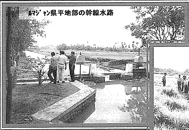
マジョラナ県平地部の幹線水路