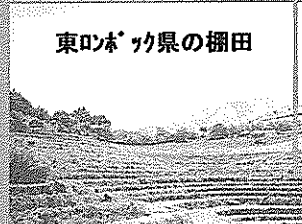
東ロンボック県の棚田