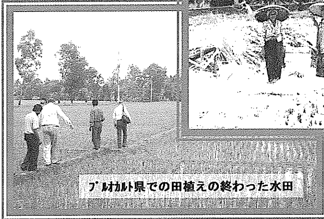
ブカバ県での田植えの終わった水田