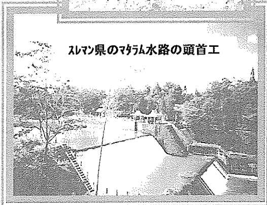
スラン県のマラム水路の頭首工