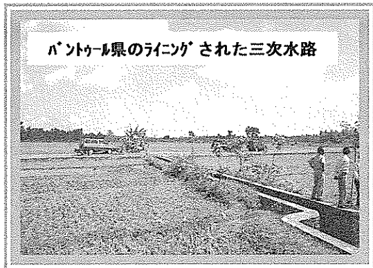
パントール県のラインガされた三次水路