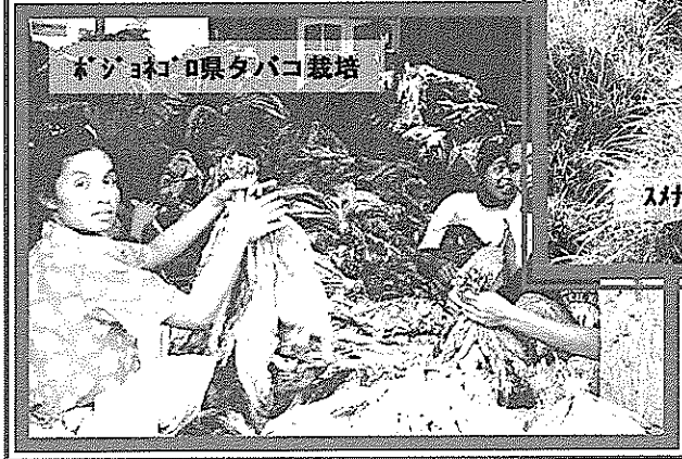
ボジョヨロ県タバコ栽培