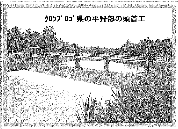
クワン・ロコ県の平野部の頭首工