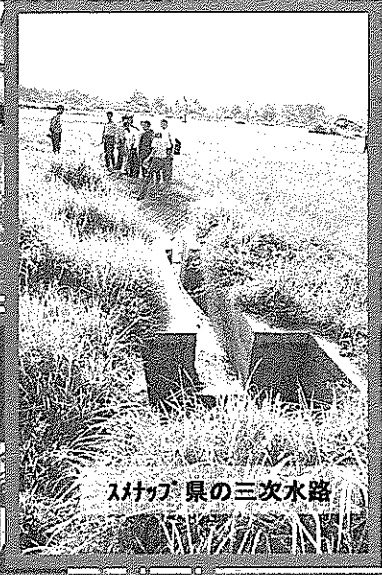
スラバヤ県の三次水路