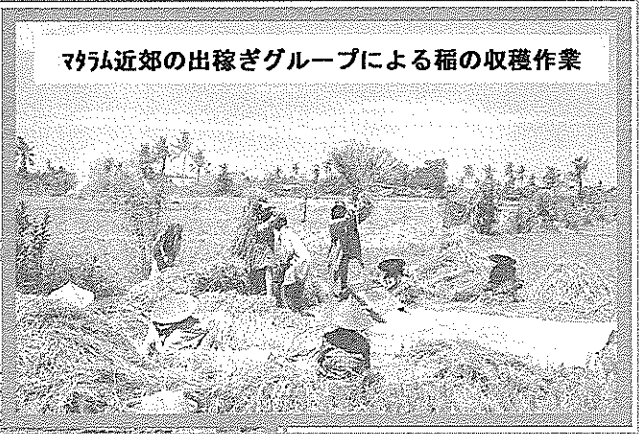
マラム近郊の出稼ぎグループによる稲の収穫作業