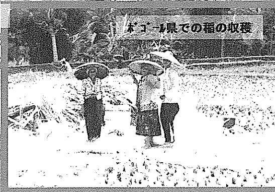
ドゴール県での稲の収穫