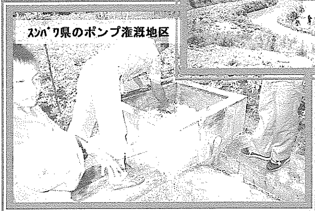
スバングラ県のポンプ灌漑地区