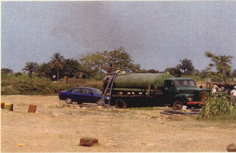
ベンゴ川から取水する 民間の給水車