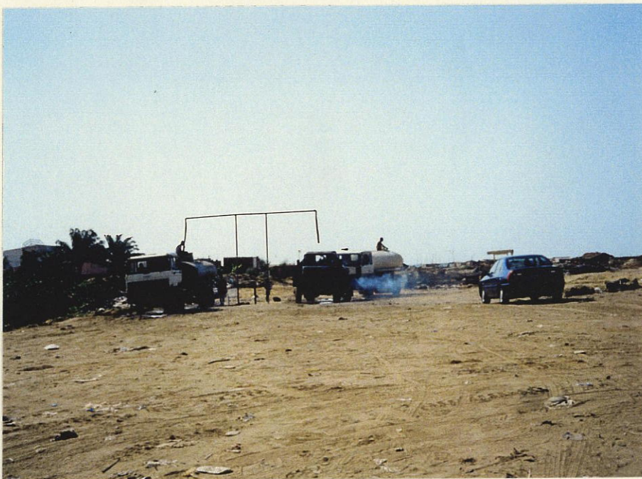
給水車への民間給水所 (ジ ラファ) 水源はルアンダ州水道公 社(EPAL)の浄水