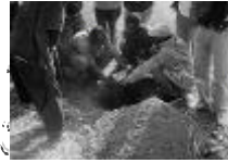
Implantation de borne