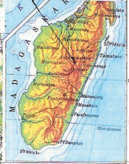
SITUATION DE LA ZONE OBJET DE L'ÉTUDE