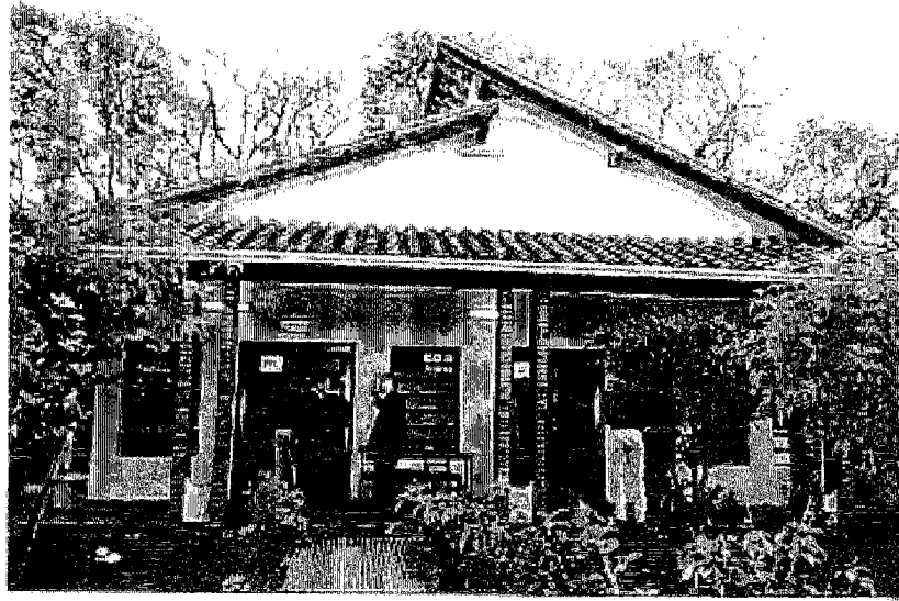
農牧省畜産研究生産局（DIPA）事務局