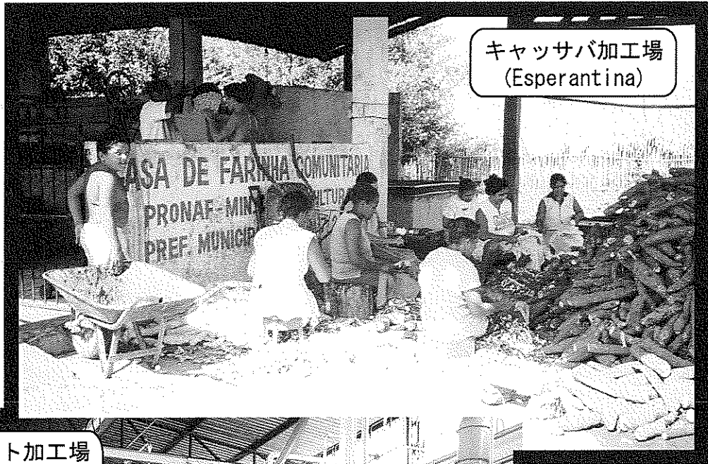
キャッサバ加工場 (Esperantina)