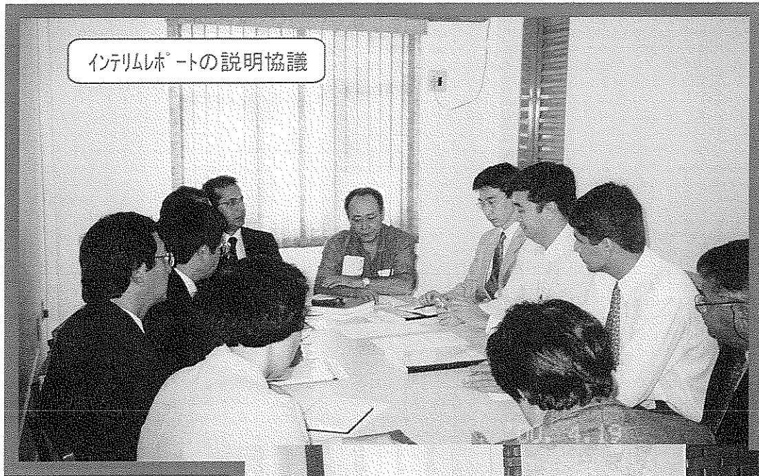
インテリムレポートの説明協議