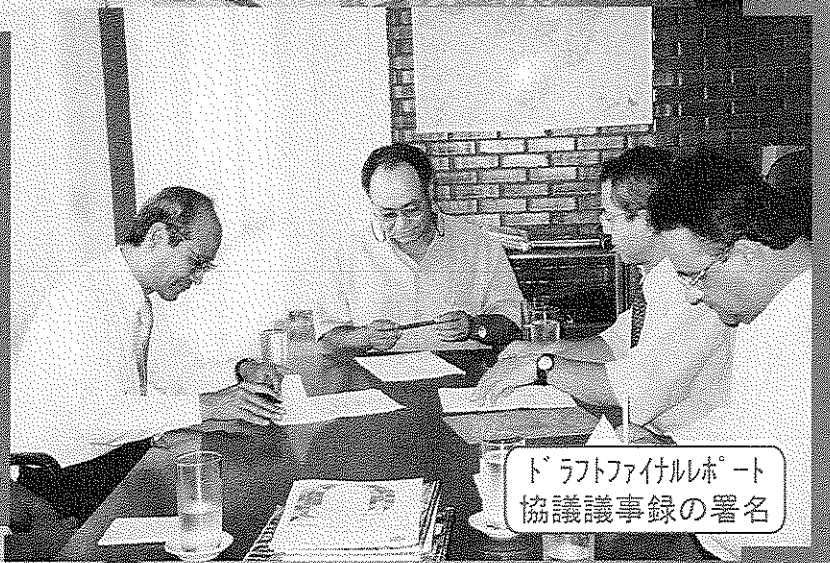
ドラフトファイルレポート 協議議事録の署名