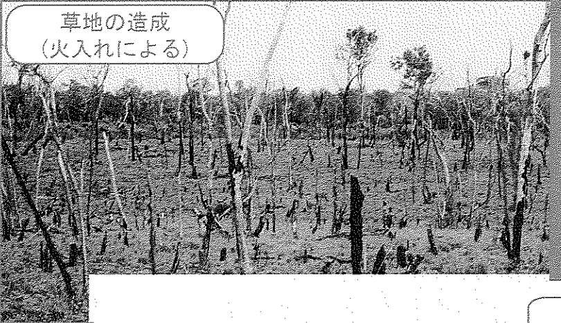
草地の造成 (火入れによる)