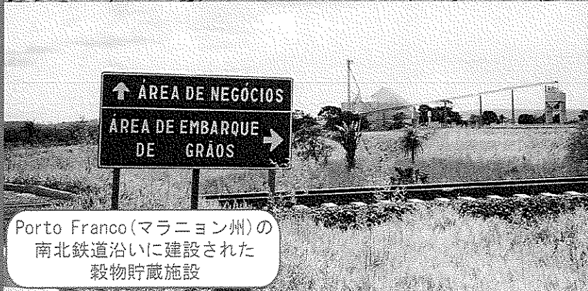
Porto Franco(マラニョン州)の 南北鉄道沿いに建設された 穀物貯蔵施設