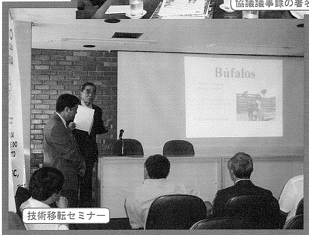
技術移転セミナー